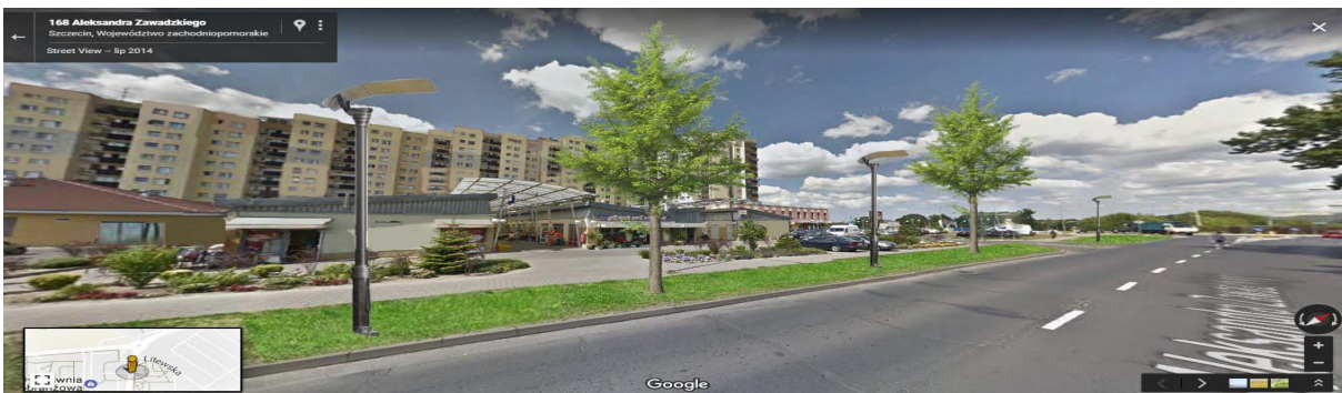
II. 5 Wizualizacja dobranej małej architektury oraz zieleni przyulicznej w oparciu o wytyczne dla jednostki krajobrazowej. Opr. Michał Adams, Weronika Krusińska, Aleksandra Wojnicz pod kier. dr inż. Paweł Nowak.