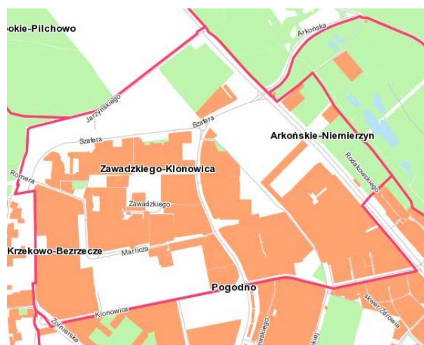
Il. 1 Osiedle Zawadzkiego-Klonowica w Szczecinie.

Obecnie dostępne komputerowe narzędzia analizy danych umożliwiają pracę na mapach w skali dynamicznej – przechodząc od skali całego miasta do skali ulicy. Podstawą pracy planistycznej i organizacyjnej jest przypisywanie danych do konkretnych obszarów i obiektów. Dane mogą dotyczyć historii danej dzielnicy, mogą zawierać zdjęcia dawnego wyglądu ulicy, wytyczne dotyczące projektowania budynków bądź zieleni miejskiej. Tego rodzaju uporządkowane dane mogą stanowić podstawę do zarządzania różnorodnym krajobrazem dużego miasta, pod warunkiem, że zostanie przeprowadzony podział przestrzeni miejskiej na jednostki krajobrazowe.