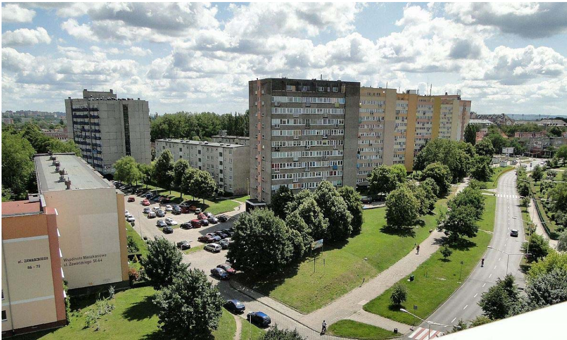
II. 4 Osiedle Zawadzkiego-Klonowica, stan obecny.