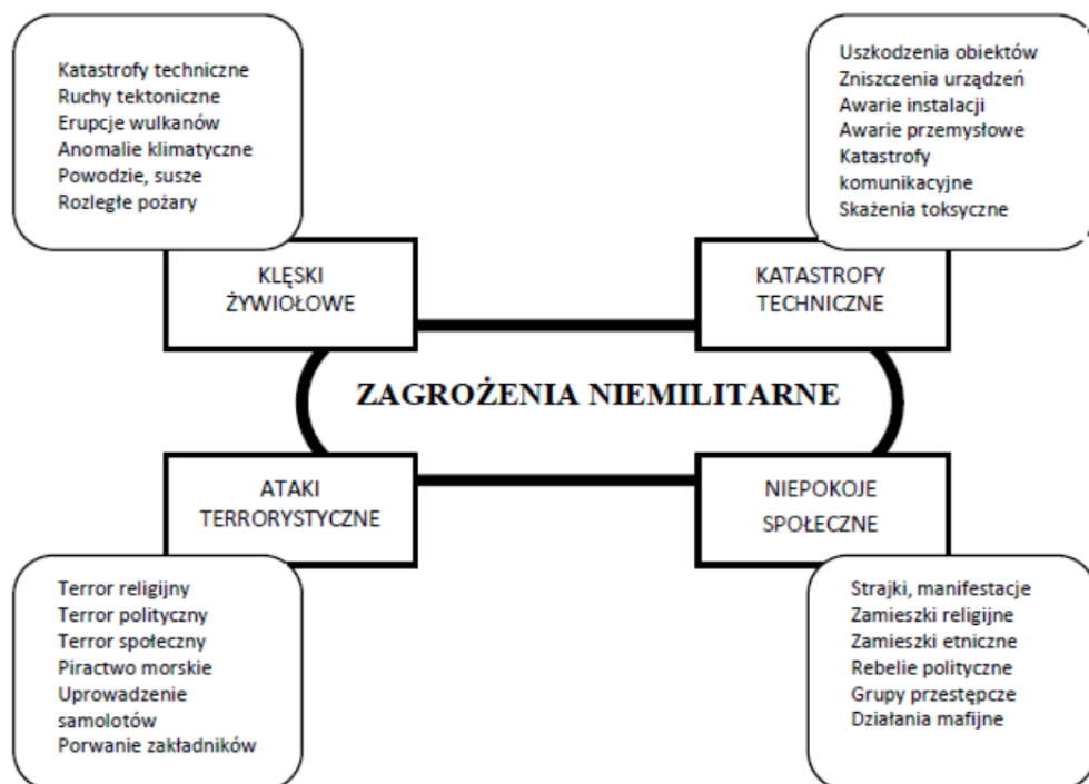
Rys.2. Klasyfikacja wybranych zagrożeń niemilitarnych