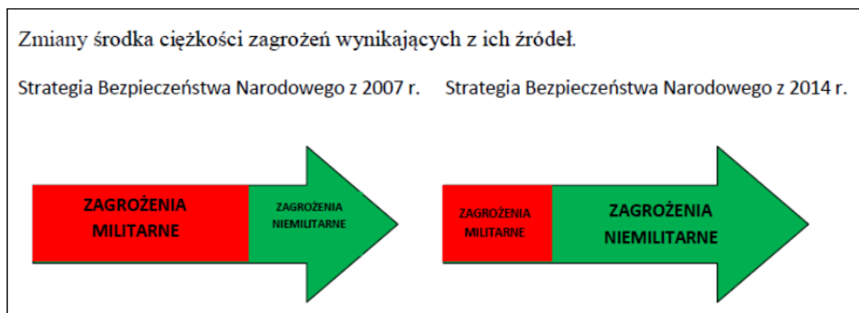
Rys. nr 1. Przejście środka ciężkości zagrożeń ze względu na ich źródło powstawania.