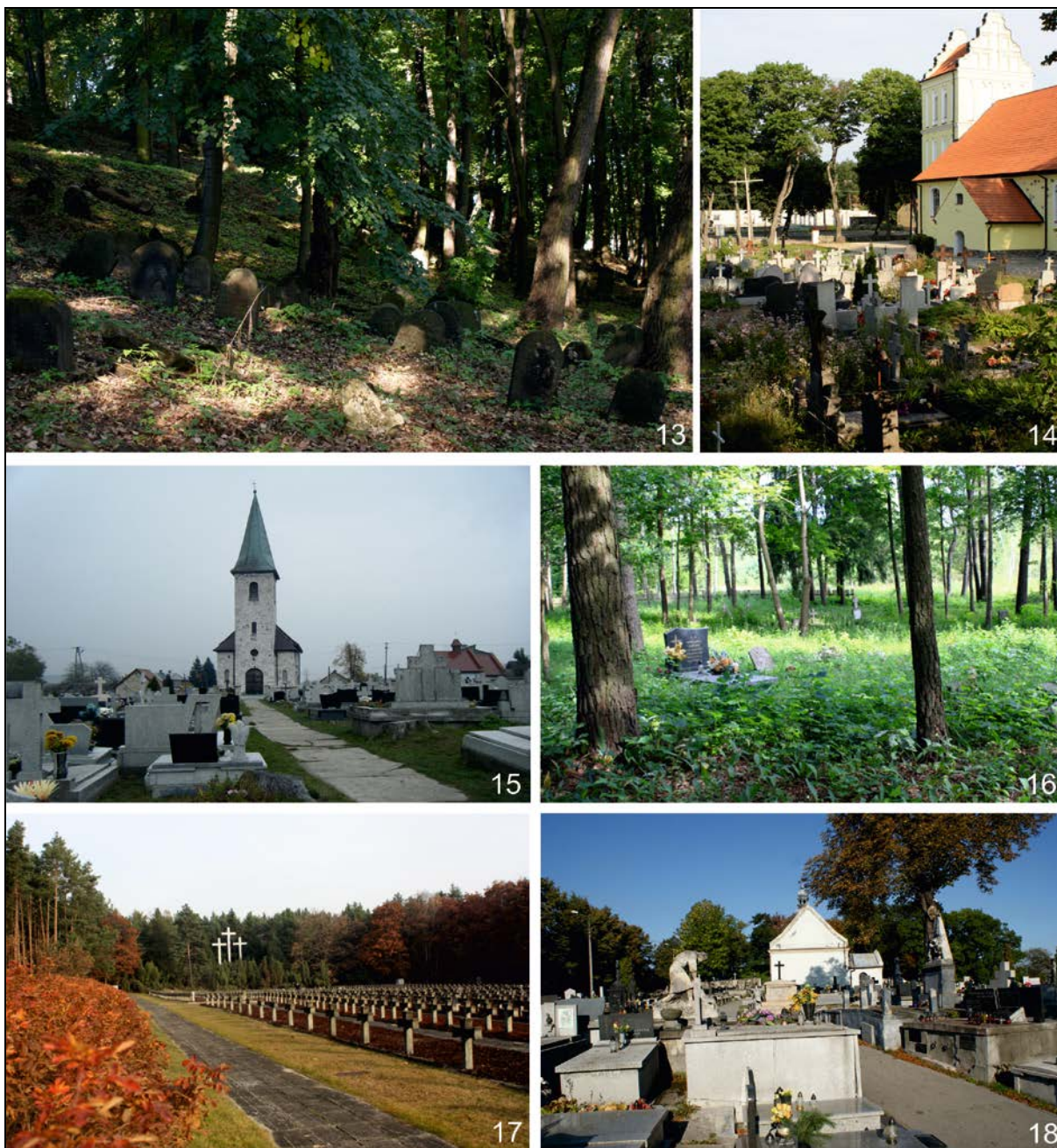
Fot. 13. Zrujnowany kirkut na Wzgórzu Zamkowym w Będzinie.