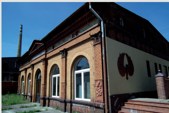
Rys. 6. Pawilon wzorcowni, południowo-zachodni narożnik z aplikacjami terakotowych płytcin na ścianie szczytowej (1928).