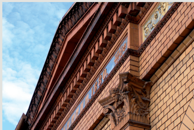
Rys. 7. Pawilon wzorcowni, fryz z terakotowymi tondami figuralnymi i dekoracją floralną (1880).