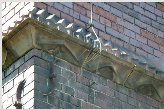
Rys. 9. W dekoracji ryzalitu piecowni (1928–30) zidentyfikowano charakterystyczne segmenty – formy wieloboczne, wrzecionowate i zygzakowate – wyprodukowane w latach 1927–28 dla nowego gmachu Prezydium Policji we Wrocławiu.