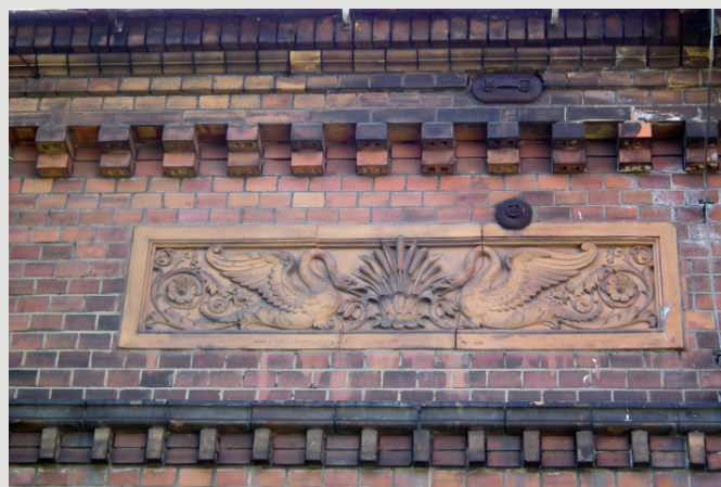
Rys. 8. Plakieta z parą łabędzi na murze wozowni (1890).

architektonicznych formach są typowymi murowanymi, przeważnie jedno- i dwukondygnacyjnymi halami nakrytymi dachami dwuspadowymi lub płaskimi, z układami przestrzennymi podporządkowanymi specyficznym wymaganiom technologii i technik ceramicznych.