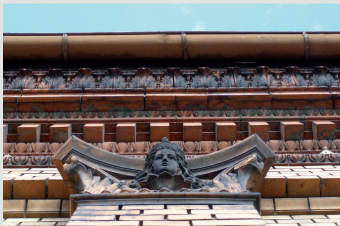
Rys. 5. Pawilon wzorcowni (1880) z ekspozycją antykizujących detali gzymsu.