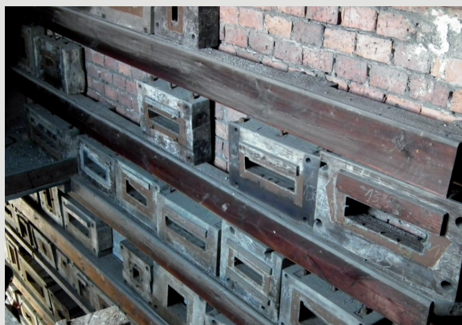
Rys. 2. Zbiór oryginalnych drewnianych form zachowanych w budynku modelarni.

zatrudniała ponad dwustu robotników. Do roku 1945 zakład specjalizował się w produkcji cegły klinkierowej pełnej, drażnionej i kształtowej, ceramicznych dekoracyjnych pustaków i odlewów oraz płytek posadzkowych [1]. W jednym z budynków modelarni zachował się zakładowy magazyn sygnowanych drewnianych modeli i form, dokumentujących ciągłość pracy wzorcowni Nowogrodzka od 1864 roku. Ten unikalny zbiór ma wielką wartość kulturową, w obliczu zniszczeń dziedzictwa materialnego Śląska po 1945 roku 3 .