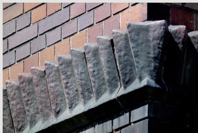
Rys. 10. Narożnik ryzalitu piecowni – formy wachlarzowate pokryte charakterystycznym fioletowym szkliwem, wyprodukowane w latach 1927–28 dla nowego gmachu Prezydium Policji we Wrocławiu.

funkcji prezentacji ciągłości produkcji zakładu, funkcji normatywnej (ważnej dla współczesnego historyka kultury), funkcji analitycznej (dla technologów produkcji) i funkcji swoistego warsztatu technologicznego dla konserwatorów ceramiki.