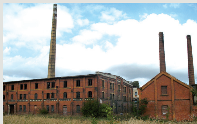
Rys. 4. Widok zespołu od strony południowej, na budynki piecowni (2011).