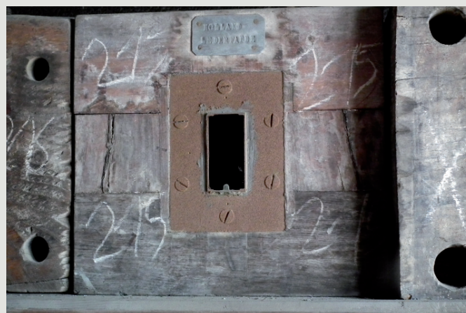
Rys. 3. Drewniany, składany blok formy ze znakami technicznymi i plaketką inwentaryzacyjną wzoru.