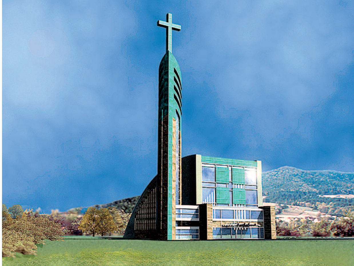
▲ ▼ Projekt koncepcyjny kościoła w Mszanie Dolnej. W koncepcji formy kościoła parafialnego w Mszanie Dolnej autorzy podjęli próbę nawiązania dialogu z krajobrazem otaczającym zespół mieszkaniowy, w którym zlokalizowany jest kościół. 2003. Conceptual project for a church in Mszana Dolna. In the design of the form of the parish church in Mszana Dolna the authors tried to accomplish dialogue between the surrounding landscape and the housing environment, when the church is settled. 2003. (arch. arch. J. Gyurkovich, M. Gyurkovich, E. Węclawowicz-Gyurkovich, K. Dudzic-Gyurkovich).