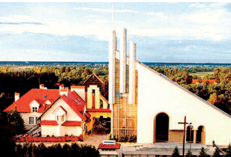
▼ Kościół p.w. Chrystusa Króla w Łękach Górnych. The Church of Christ the King in Łęki Górne. (arch. arch. J. Gyurkovich, E. Węclawowicz-Gyurkovich, wsp./coop. M. Gyurkovich, konst./const. L. Zapał).