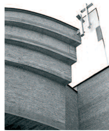
◀ Kościół p.w. Chrystusa Króla w Łękach Górnych – detale z realizacji. The Church of Christ the King in Łęki Górne: details of construction process.

For cultures rooted in European Christianity, the church served as this characteristic element of physical space. It was a strong form, clearly legible and dominant in the silhouette of a town, and it was the center around which local society organized its physical environment. For centuries, the presence of the church-a place of religious worship and a space in which people came to meet God-guaranteed residents a sense of security and of belonging to a spiritual collective.