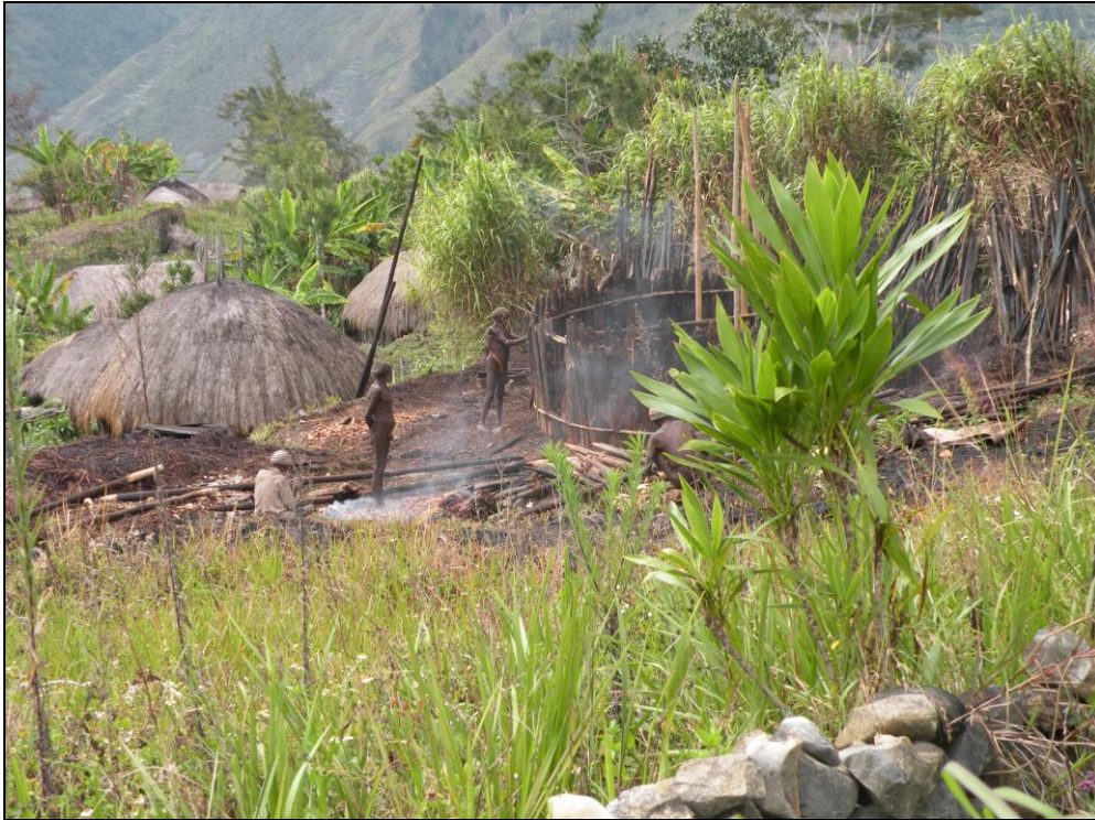
Fot. 7. „Tworzenie” krajobrazu osadniczego, Dolina Baliem, centralna Papua, Indonezja.

Photo 7. Settlement landscape creation, Baliem Valley, Central Papua, Indonesia.