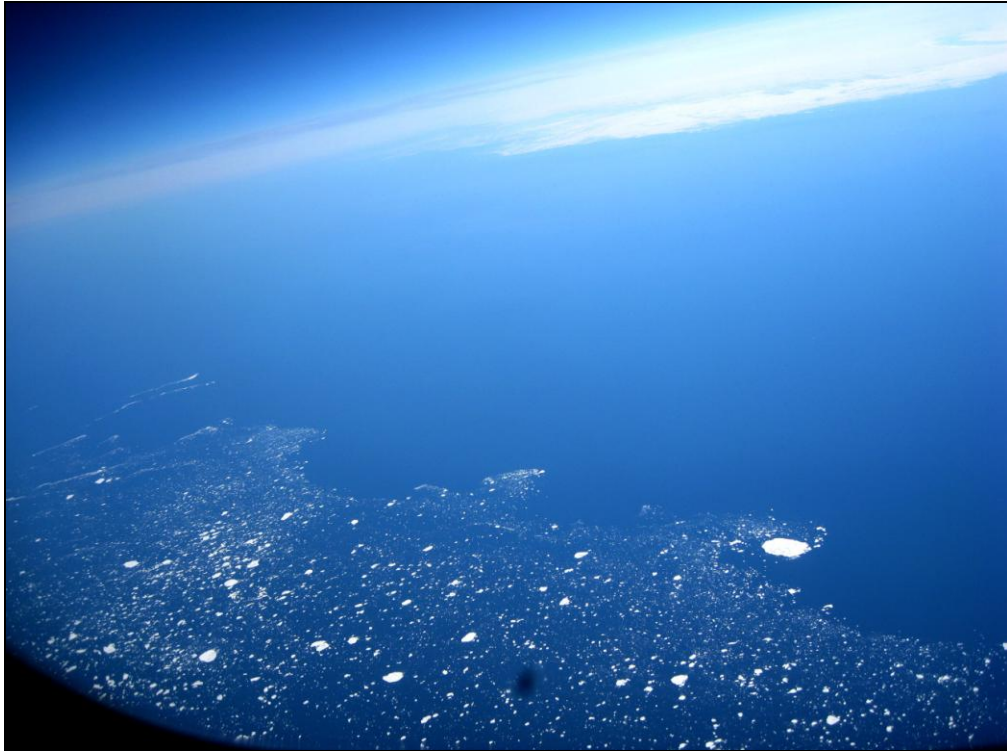
Fot. 1. Przestrzeń powietrzna nad Wyspami Japońskimi.

Photo 1. Airspace over the Japanese Island.