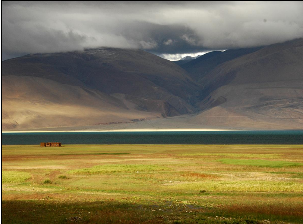
Fot. 3. Krajobraz seminaturalny okolic jeziora Tsomoriri – płaskowyż Changthang, Ladakh, Indiach.

Photo 3. Seminatural landscape Changthang plateau, Ladakh, India.