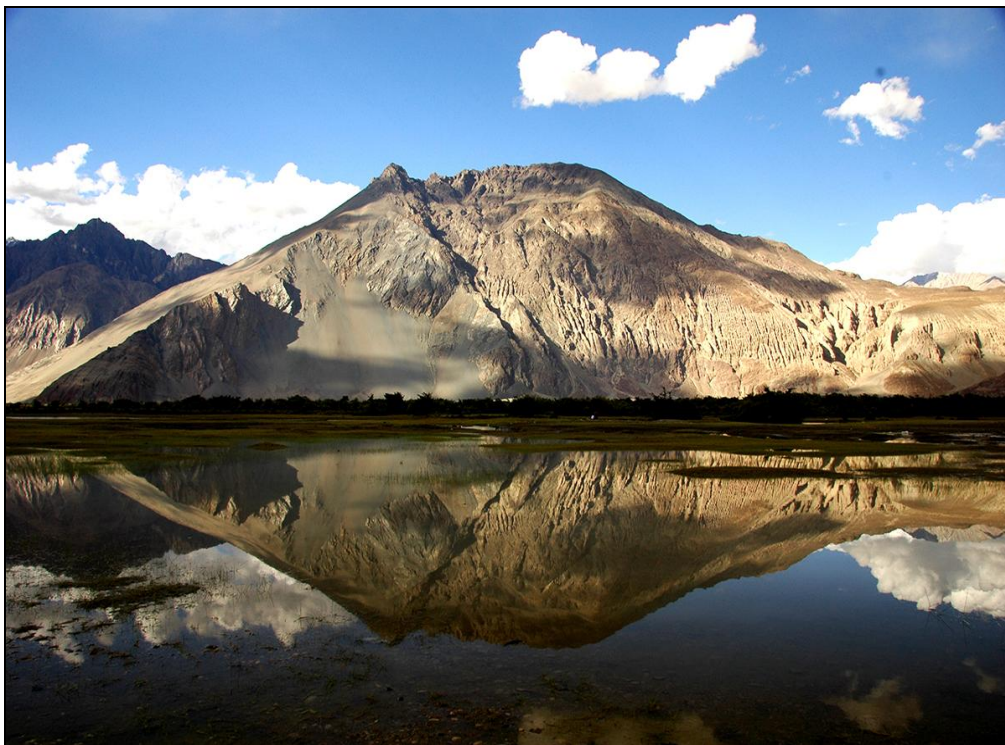
Fot. 4. Krajobraz przyrodniczy okolic jeziora Tsomoriri. – płaskowyż Changthang, Ladakh, Indiach.

Photo 3. Seminatural landscape Changthang plateau, Ladakh, India.