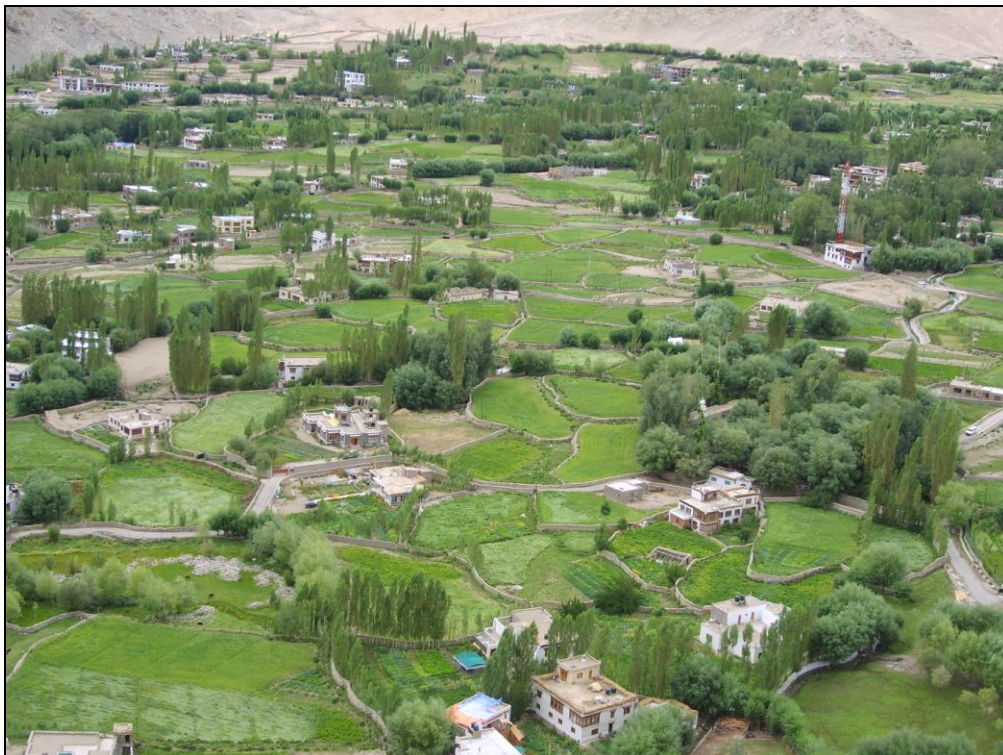
Fot. 6. Krajobraz kulturowy (rolniczo-osadniczy) w Indiach.

Photo 5. Settlement landscape, North India.