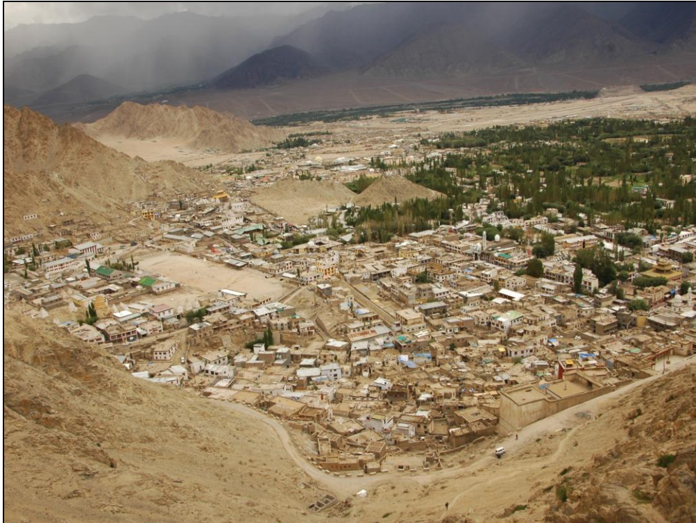
Fot. 5. Krajobraz osadniczy, północne Indie.

Photo 5. Settlement landscape, North India.