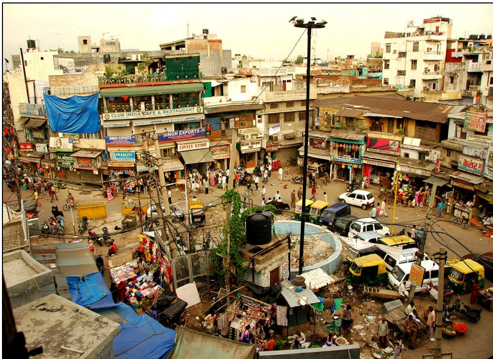
Fot. 8. Miejsce wraz ze środowiskiem kulturowym, Delhi, Indie.

Photo 7. Settlement landscape creation, Baliem Valley, Central Papua, Indonesia.