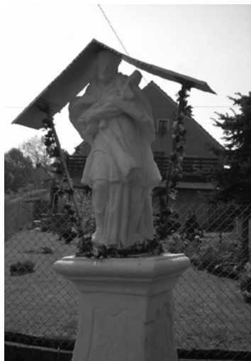
Fot. 19-20. Osobliwe współczesne dekorowanie figur religijnych.