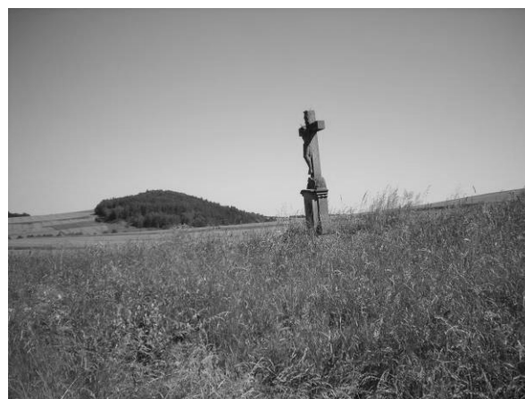
Fot. 2-3. Kaplice i krzyże krajobrazie wiejskim: po lewej – na granicach wsi, po prawej – w otwartym krajobrazie.