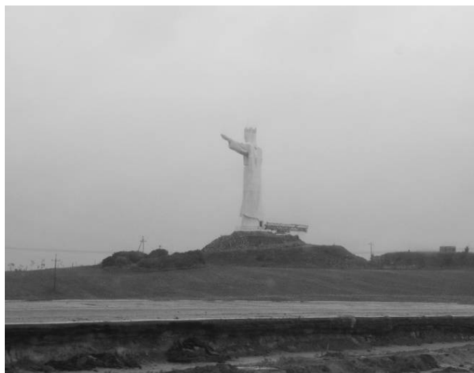
Fot. 7. Monumentalna figura Jezusa na obrzeżach Świebodzina.

Photo 6. Millenary cross (10 m high) tower over Dobromierz.