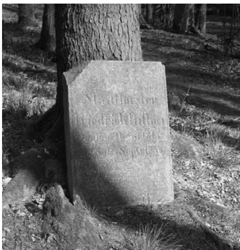
Fot. 16. Upamiętnienie tragicznie zmarłego (1867) leśniczego zlokalizowane w okolicach Grobli (w dolinie Młynówki, Pogórze Kaczawskie).

The roadside commemorations of the car crashes victims contemporary take the form of permanent constructions, architectonic projects, ‘wild’ – (illegal) but not less authentic – sacralization of the space (people take care of this place, putting grave candles etc.).