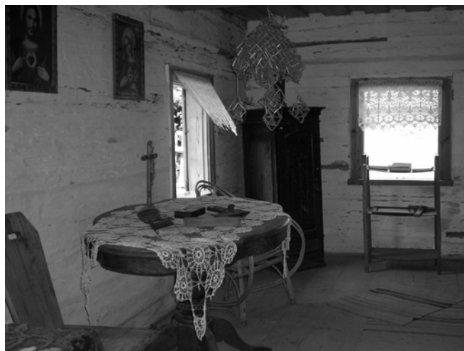
Fot. 9. Zrekonstruowana izba mieszkalna wiejskiego gospodarstwa w skansenie w Puńsku – święte obrazy nad stołem (lewy górny róg).

Photo 8. Large symbol of holy cross placed on the roof, created by colored roofing tiles.