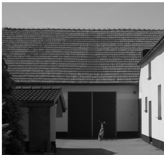
Fot. 8. Wielki symbol krzyża na dachu, powstały poprzez wykorzystanie kolorystyki dachówek.

starszych, kultywujących tradycyjny, przywiązany do rytuałów model religijności – generalnie „nienowoczesnych”. W tym rozumieniu sakralizacja jest reliktowym rytuałem, coraz mniej zrozumiałym, zanikającym, mającym wyłącznie religijny (lub magiczny) wymiar. Dzisiaj taką „sakralną aranżację” przestrzeni domowej coraz częściej można zobaczyć w skansenie (jako zrekonstruowane świadectwo dawnych zwyczajów (fot. 9), niż w „zwykłym” mieszkaniu. Ale przecież w tych samych miejscach pojawiają się „nowoczesne” odpowiedniki tamtych artefaktów: podkowa, jemioła, posążki Buddy, plakaty idoli (!) a sama struktura mieszkania przekształcona została zgodnie z wymogami feng shui.