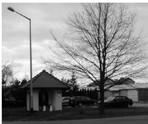
Fot. 18. Kaplica Matki Bożej na osiedlu kontenerowym w Świętej Katarzynie.

Popular representation of the Christ – contemporary, rustic form in interesting placement (a hollow in a tree on a churchyard).