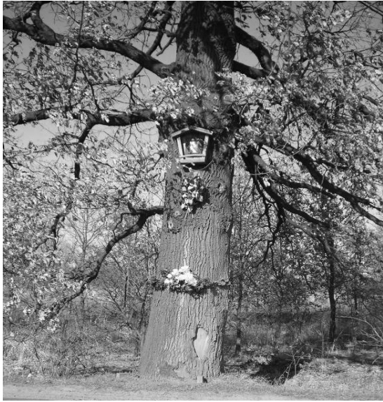
Fot. 4. Kapliczka szafkowa z obrazkiem Matki Bożej na przydrożnym dębie w obrębie Wrocławia (ul. Rdestowa).

Forma uświęcenia nietypowa dla ofiar wypadków drogowych, w pobliżu nie znajdują się natomiast żadne zabudowania – choć MB uświęca nadal to miejsce, kontekst sakralizacji pozostaje nieznan.