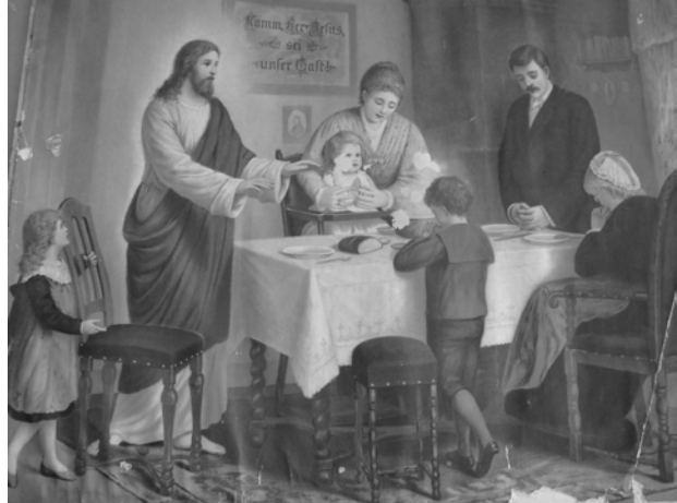
Fot. 13. Przykład, rzadko już spotykanego, świętego obrazu zawieszanego nad stołem kuchennym.

W samym wnętrzu domu wyróżniano miejsca mniej lub bardziej „uświęcone”, z których jednym z ważniejszych było miejsce, w którym stał stół („święty kąt, pokucie na Mazowszu). Przy stole kontakt z sacrum uwidaczniał się najmocniej poprzez modlitwę poprzedzającą spożywanie posiłków, umieszczanie świętych obrazów na ścianach ponad stołem (Sulima, 2008) (fot. 13). Także czas, kiedy wszyscy członkowie rodziny gromadzili się w tym miejscu nabierał sakralnego charakteru (kolacja, obiad, święta, ważne/trudne momenty); niekwestionowanym przewodniczącym tym wydarzeniom był ojciec, mąż, głowa rodziny, zasiadający w miejscu eksponowanym, naczelnym – w każdym razie na stałe swoim. Nie tylko miejsce, ale również zebrana wspólnota i czas gromadzenia nabierały uświęconego charakteru. Wkroczenie do tej świętej przestrzeni i czasu przez osoby trzecie było limitowane i zależało od wielu okoliczności: stopnia pokrewieństwa / powinowactwa (rodzinnemu, codziennemu posiłkowi mogła towarzyszyć tylko najbliższa rodzina), czasu (uroczystość / świętowanie), ranga/waga wyjątkowych wydarzeń (szczęśliwe albo tragiczne wydarzenie)etc. Obcych przyjmowano przed progiem domu a sprawy oficjalne/urzędowe załatwiano w przedpokoju lub gościnnym czyli w domowej przestrzeni publicznej.