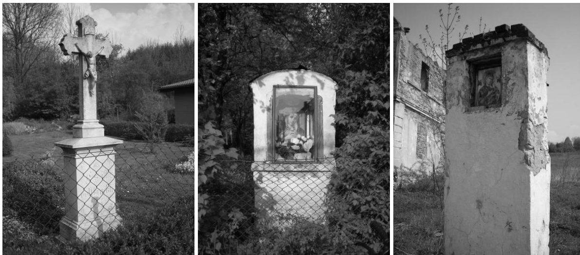
Fot. 10-12. Formy „bożej protekcji” w otoczeniu domów mieszkalnych: po lewej – przydomowy krzyż, w środku – rodzaj przydomowej kapliczki, po prawej – święty obrazek umiejscowiony bezpośrednio w filarze bramy wjazdowej domostwa (stan zachowania nie ma tu żadnego znaczenia).

Wszystkie te interpretacje nie mają znaczenia dla człowieka wierzącego. Wymieniane artefakty wypełniające świętą przestrzeń, religijnie nacechowana aranżacja przestrzeni, zachowania rytualne, mają wobec samych relacji z sacrum znaczenie drugorzędne.