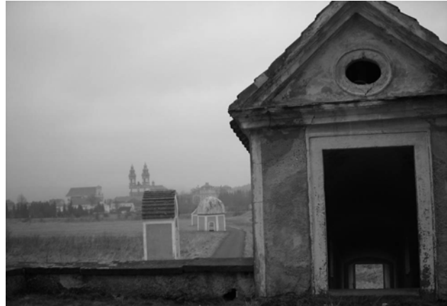
Fot. 1. Kalwaria krzeszowska, w tle wieże kościoła klasztornego.

W krajobrazie wiejskim w wielu regionach Śląska powszechnie praktykowanym zwyczajem stało się umieszczanie symboli religijnych (najczęściej w postaci przydrożnych kaplic, krzyży) w miejscach wyznaczających ramy codziennego życia mieszkańców: przy głównych drogach, ale również w otwartym krajobrazie wiejskim