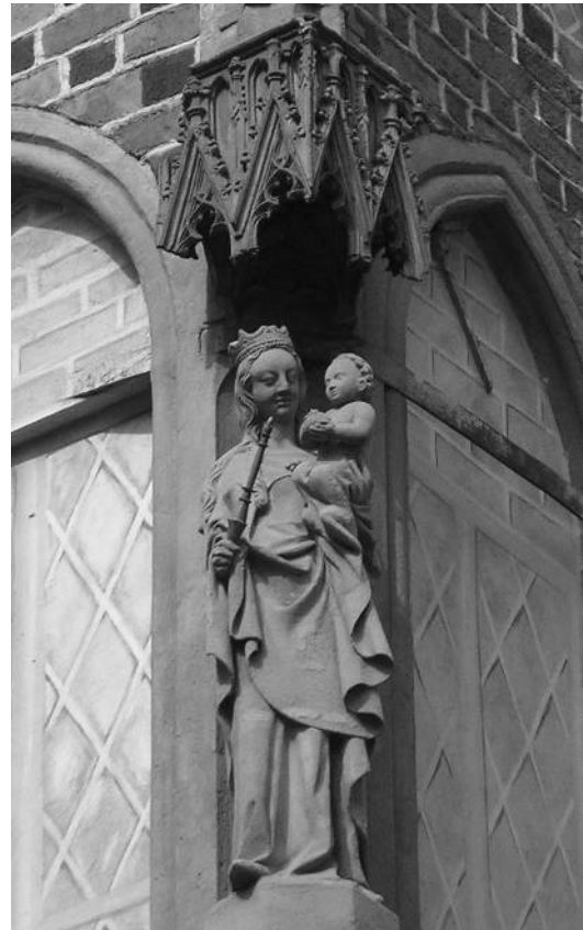
Fot. 5. Figura Matki Bożej z Dzieciątkiem na narożniku kamienicy przy ul. Szewskiej we Wrocławiu.

Rzadki przykład występowania symbolu religijnego na budowli nie pełniącej religijnych funkcji. Czy jest to po prostu pewien ewenement czy też wyjątkowość tego typu obiektów jest potwierdzeniem postępującej desakralizacji (dechryścianizacji) przestrzeni miejskiej?