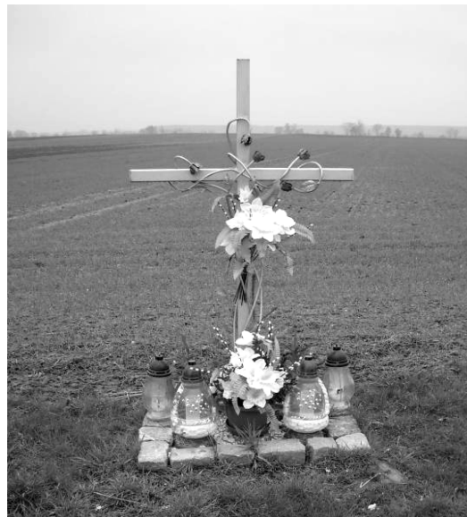
Fot. 15. Krzyże przydrożne „powypadkowe”.

Przydrożne upamiętnienia ofiar wypadków współcześnie przybierają formę trwałych konstrukcji, projektów architektonicznych, „dzikiej” (pozaprawnej), co nie znaczy, że mniej autentycznej sakralizacji przestrzeni (o czym świadczą np. znicze).