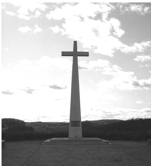
Fot. 6. Krzyż milenijny (10 m wysokości) górujący nad Dobromierzem.

Photo 6. Millenary cross (10 m high) tower over Dobromierz.