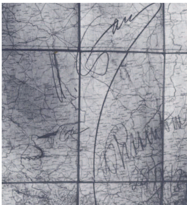
Moskwa 28.09.1939 r., mapa IV rozbioru Polski, podpisy Stalina i Ribbentropa