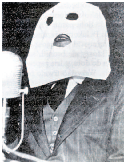
Polski świadek zeznaje przed Specjalną Komisją Kongresu USA