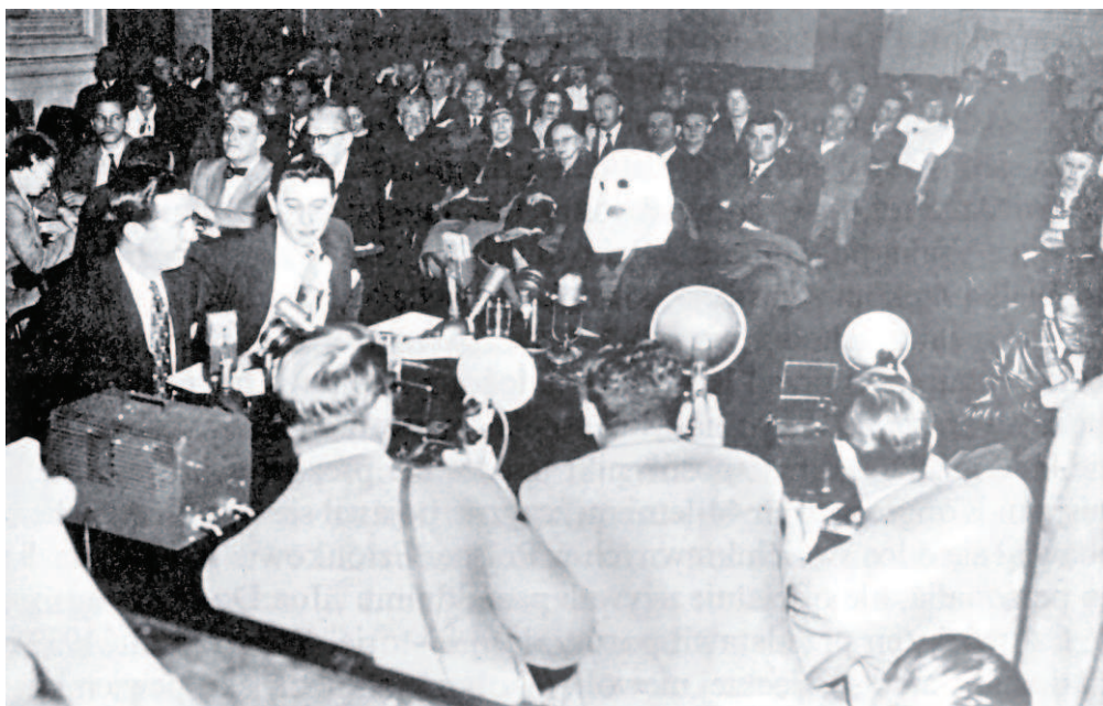
Zeznania Polaka z zasłoniętą twarzą przed Specjalną Komisją Kongresu USA