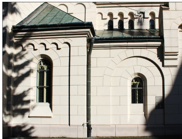
Ryc. 6. Dekoracja elewacji, 2019; fot. M. Zub.

Czas budowy kościołów zamyka się na przełomie XIX i XX wieku. Najstarszy jest kościół w Bachórze (1871–1873), najmłodszy w Łubnie (1927), pozostałe budowano w ostatnim 80-leciu XIX wieku, np. Rakszawa (1880–1882), Miejsce Piastowe (1886–1888) i Albigowa (1895–1897). Zatem okres inwestycyjny świątyni w Zarzeczu (1880–1895) mieści się w ramach przyjętych dla podobnych realizacji.