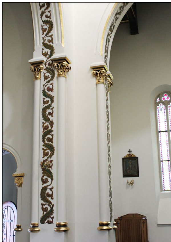
Ryc. 4. Filar międzynawowy, 2019; fot. M. Zub. Fig. 4. Inter-nave pier, 2019; photo by M. Zub.

Trójkątnie zamknięte prezbiterium o szerokości nawy głównej i jednym przeszle zostało pozbawione szkarp, jedynie przy kwadratowych aneksach ściany wznoszą dwuskokowe przypory z pulpitywami daszkami, a ściany zdobią boniowane lica murów, profilowany gzyms wieńczący oraz fryz arkadowy o półkolistym zamknięciu. Nakryto je dwuspadowym, w zamknięciu trójpołaciowym dachem krytym blachą, a wnętrza przekryto ozdobnym drewnianym belkowaniem wspartym na słuźkach, z motywem krzyża i gwiazdy; w zakryściach zastosowano sklepienia krzyżowe. W ścianie czołowej prezbiterium przepruto wysoki otwór okienny o półkolistym zamknięciu i umieszczono go w głębokiej wnęce, a w oknie założono pulpitywy blaszany parapet. W ścianach zachodniej i wschodniej ulokowano po dwa triforia w boniowanym opracowaniu z fryzem arkadkowym, wewnątrz oddzielone prostymi romańskimi kolumnkami. W okno wsadzono barwny figuralny witraż z postacią Michała Archanioła, a wokół okna w ścianie szczytowej i podłuczach wnek po jego bokach naniesiono polichromię o motywach wici roślinnej; obrys okna i podłuczy pozłocono.