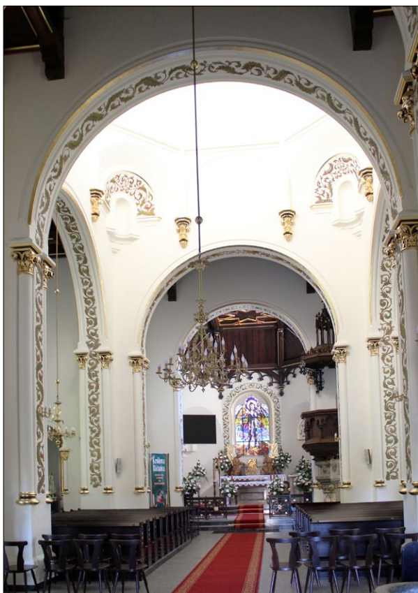
Ryc. 3. Wnętrze – widok w kierunku prezbiterium, 2019; fot. M. Zub. Fig. 3. Interior – view towards the presbytery, 2019; photo by M. Zub.