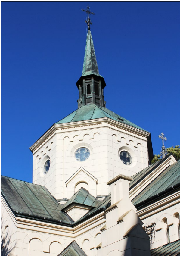
Ryc. 5. Kopiała nad środkowym przęsłem transeptu, 2019; fot. M. Zub. Fig. 5. Dome above the central bay of the transept, 2019; photo by M. Zub.

wewnętrznej zdwojonymi kolumnami o złożonych stylizowanych roślinnych głowicach i złożonych kolistych bazach, a komunikację z aneksami zakrystyjnymi zapewniają półkoliste profilowane przeprucia drzwiowe po obu stronach prezbiterium.