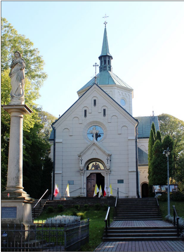
Ryc. 1. Ogólny widok obiektu, 2019; fot. M. Zub. Fig. 1. General view of the building, 2019; photo by M. Zub.

tów, rozdzielonych przeszłem transeptu. Korpus o trójkątnym szczycie od strony prezbiterium pozbawiono oszkarpowania, a ściany zdołi fryz ze ślepych arkadek o półkolistych zamknięciach oraz profilowany gzyms wieńczący. Kryje go dwuspadowy dach kryty blachą, a wewnątrz przekrywa trójkątna konstrukcja oszalowana drewnianymi belkami z inkrustacją, wsparta na konsolach. Komunikację wewnętrzną zapewniają arkady ulokowane między nawą główną i transeptem oraz między przeszłami transeptu (ryc. 3). Zamknięto je półkoleście, a dźwigane są przez zdwojone kolumny o stylizowanych złożonych roślinnych kapitelach i złożonych bazach. Filarom dano plan krzyża greckiego, na ramionach umieszczono pary dekoracyjnych kolumnienek o złożonych głowicach i bazach, a podłuczca polichromowano motywami roślinnymi (ryc. 4). Komunikacja z przedsionkami i kaplicami została ozdobiona małymi arkadkami z kolumnienkami o stylizowanych złożonych roślinnych kapitelach i złożonych bazach, a łuki arkad opofilowano i ozłociono. Ściany korpusu pozbawione są dekoracji, jedynie podłuczca arkad ozdobiono barwną polichromią o ornamentyce roślinnej. Drewniane szalunki przekrycia dźwigane przez konsolki ozdobiono inkrustacją. Elementem dekoracyjnym i funkcjonalnym nawy jest chór muzyczny umieszczony w przeszle północnym, wsparty na dwóch spiralnych drewnianych kolumnach, z balustradą bogato zdobioną motywami drobnych pełnych arkad i dużych ażurowych trójkątnych koniczyn, z mocno profilowanym wysuniętym parapetem.