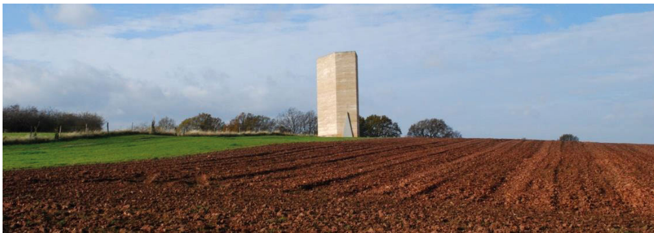
II. 4. Kaplica Brata Klausa w krajobrazie, Wachendorf, Niemcy, arch. Peter Zumthor, 2007.