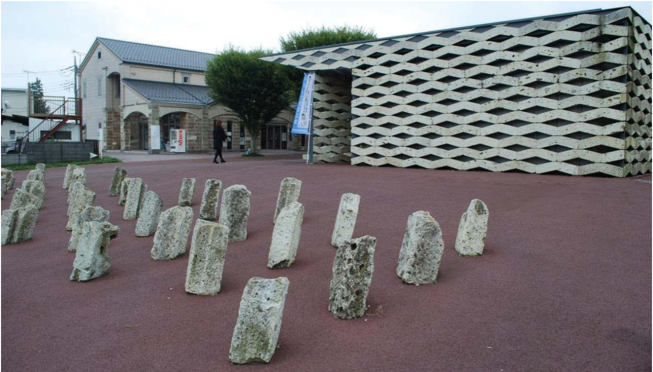
II. 2. Plac Chokkura, Takanezawa, Japonia, arch. Kengo Kuma, 2006 (fot. B. Stec).