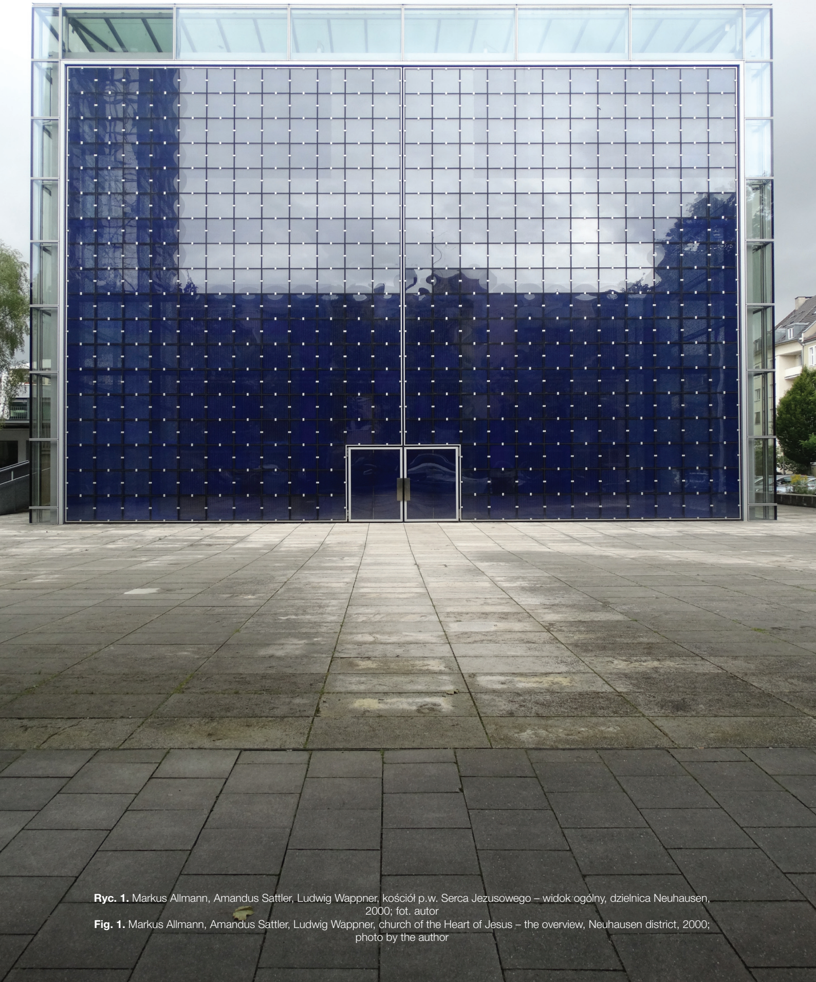
Ryc. 1. Markus Allmann, Amandus Sattler, Ludwig Wappner, kościół p.w. Serca Jezusowego – widok ogólny, dzielnica Neuhausen, 2000