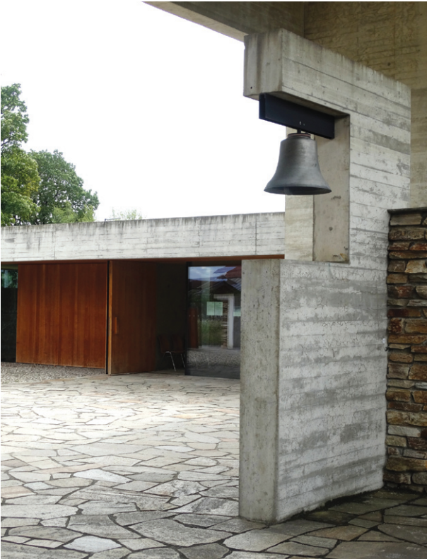
Ryc. 6. Andreas Meck, Stephan Köppel, kaplica cmentarna – zestawienie charakterystycznych materiałów wykończeniowych, dzielnica Riem, 2000