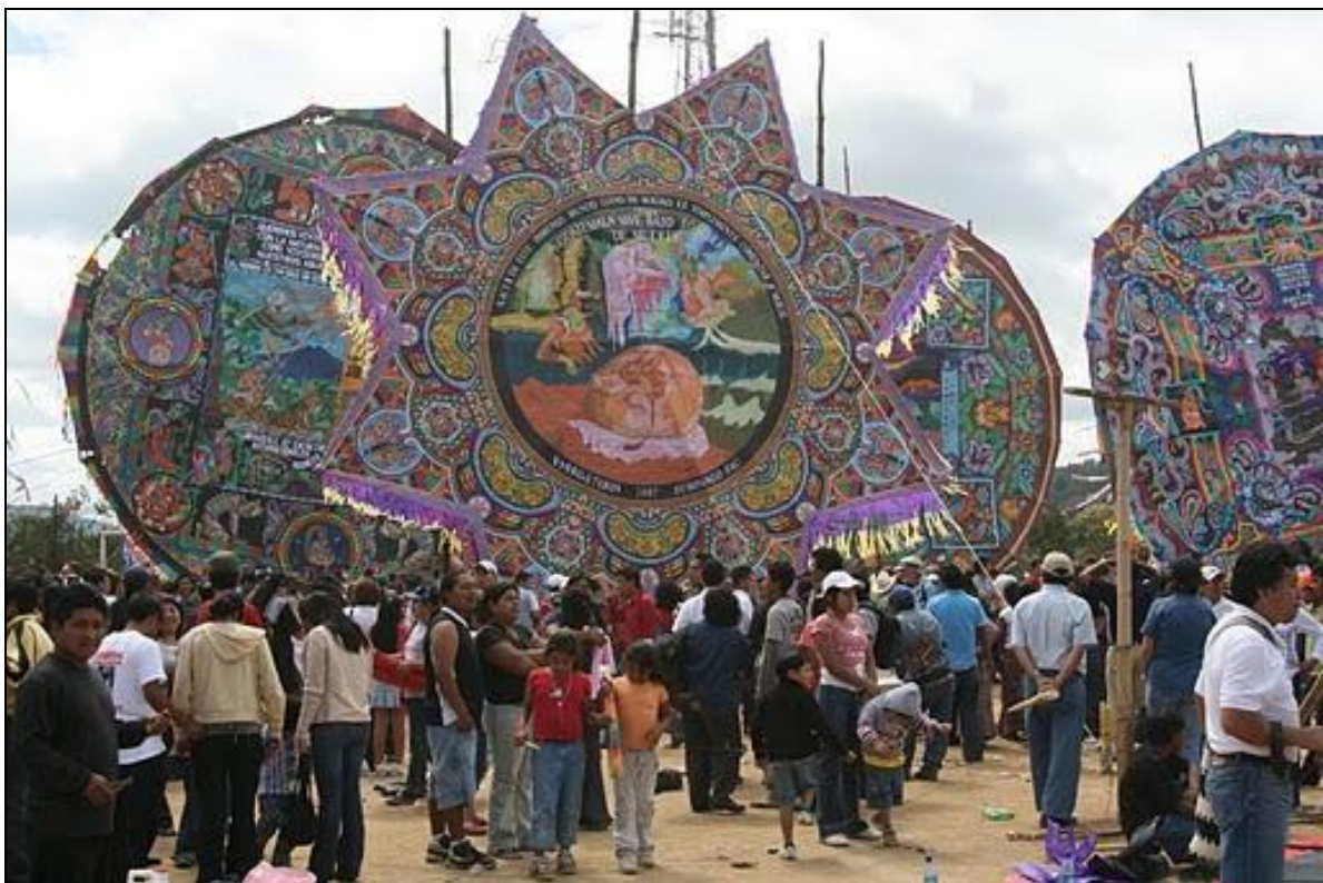
Fot. 3. Latawce „łączące” żywych ze zmarłymi (Gwatemala).