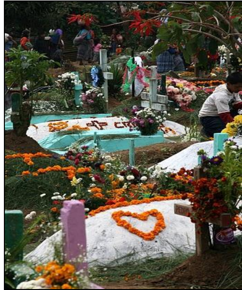
Fot. 2. „Biedniejsze” nagrobki zmarłych.