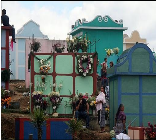
Fot. 1. Nagrobki zamożniejszej części społeczeństwa gwatemalskiego.