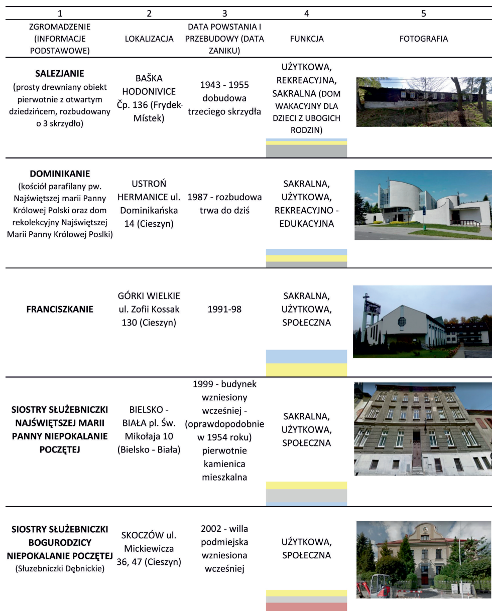
Tabela 1. Zestawienie przykładowych, wybranych obiektów rozpoznanych podczas badań wstępnych.