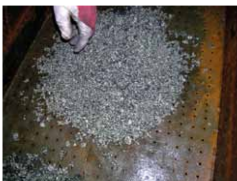
Rys. 9. Granulat staliwa GXCrNiMo18-10-2 uzyskany w wyniku zastosowania ceramicznego filtra odlewniczego Fig. 9. Granulate of cast steel GXCrNiMo18-10-2 obtained as a result of the use of a ceramic casting filter

A compilation of all the performed tests has been included in Table 3.