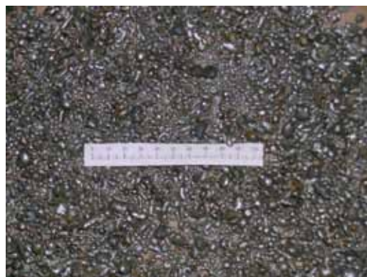
Rys. 6. Uzyskany granulaty o kształcie zbliżonym do globularnego Fig. 6. The obtained granulate, with a globular-like shape

The melt used for the tests was high-alloy cast steel GXCrNiMo18-10-2 in the form of coarse granulate from the previous melts. The only procedure which was made in the liquid metal was, similarly to the preceding trials, deoxidation 0.1% FeCaSi-75%. The melts were also performed in a Radyne type furnace with the capacity of 40 kg. The melted metal of the temperature of 1580°C, after a sample for the chemical composition analysis was collected, was poured into a ladle of the capacity of 10 kg and with inert lining. The liquid alloy was poured through the filter – the double neck-down cores. After coming through the filter, the falling metal, as it was mentioned before, was additionally cooled with compressed air. The metal drops were falling into the vessel with water. As a result of the performed tests, globular-like granulate was obtained (Fig. 6).