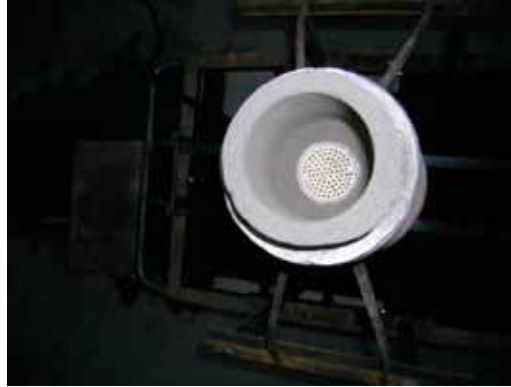
Rys. 7. Ceramiczny filtr odlewniczy zamocowany w tulei, przez który przelewany był stopiony metal Fig. 7. Ceramic casting filter mounted in a bushing, through which the melted metal was poured

Next, an experiment was carried out with the use of an identical set of devices, except for the neck-down cores through which the melted metal had been poured, which were replaced with a ceramic casting filter (Fig. 7).