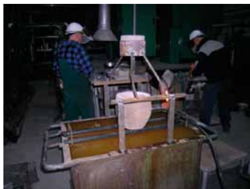
Rys. 5. Kołnierz z otuliny ZTA-4 z tuleją wewnętrzną z doprowadzeniem sprężonego powietrza Fig. 5. Lag collar ZTA-4 with an external bushing with compressed air supply

Użyty do prób stopem było staliwo wysokostopowe GXCrNiMo18-10-2 w postaci granulatu grubego z poprzednich wytopów. Jedynym zabiegiem, jaki był wykonywany w ciekłym metalu było, podobnie jak w poprzednich próbach, odtlenianie 0,1% FeCaSi-75%. Przetopy przeprowadzano również w piecu typu Radyne o pojemności tygla 40 kg. Roztopiony metal o temperaturze 1580°C, po pobraniu próbki do zbadania składu chemicznego, przelewano do kadzi o pojemności 10 kg o wyłożeniu obojętnym. Ciekły stop przelewano przez filtr – podwójne przeponki. Po przejściu przez filtr spadający metal schładzany był, jak już wspomiano, dodatkowo sprężonym powietrzem. Krople metalu wpadały do pojemnika z wodą. W wyniku przeprowadzonych prób uzyskano granulaty o kształcie zbliżonym do globularnego (rys. 6).