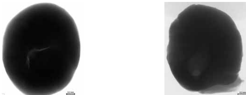
Rys. 10. Zdjęcia rentgenowskie granulki wykonanych z zastosowaniem przeponek Fig. 10. X-ray images of the granules made through the application of neck-down cores

The presented exemplary X-ray images are the proof of good quality granulate containing only small amounts of pollutants (light spots).