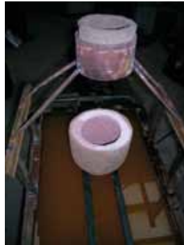
Rys. 3. Zmodyfikowana konstrukcja do granulacji stopów Fig. 3. Modified construction for alloy granulation