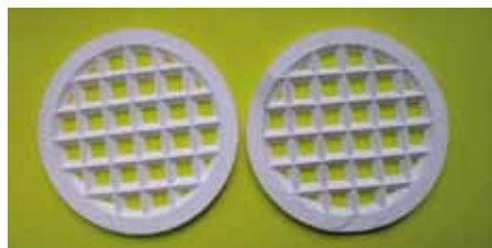
Rys. 4. Ceramiczne przeponki Fig. 4. Ceramic neck-down cores