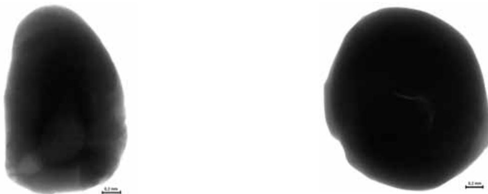
Rys. 11. Zdjęcia rentgenowskie granulek wykonanych z zastosowaniem ceramicznego filtra odlewniczego Fig. 11. X-ray images of the granules made with the use of a ceramic casting filter