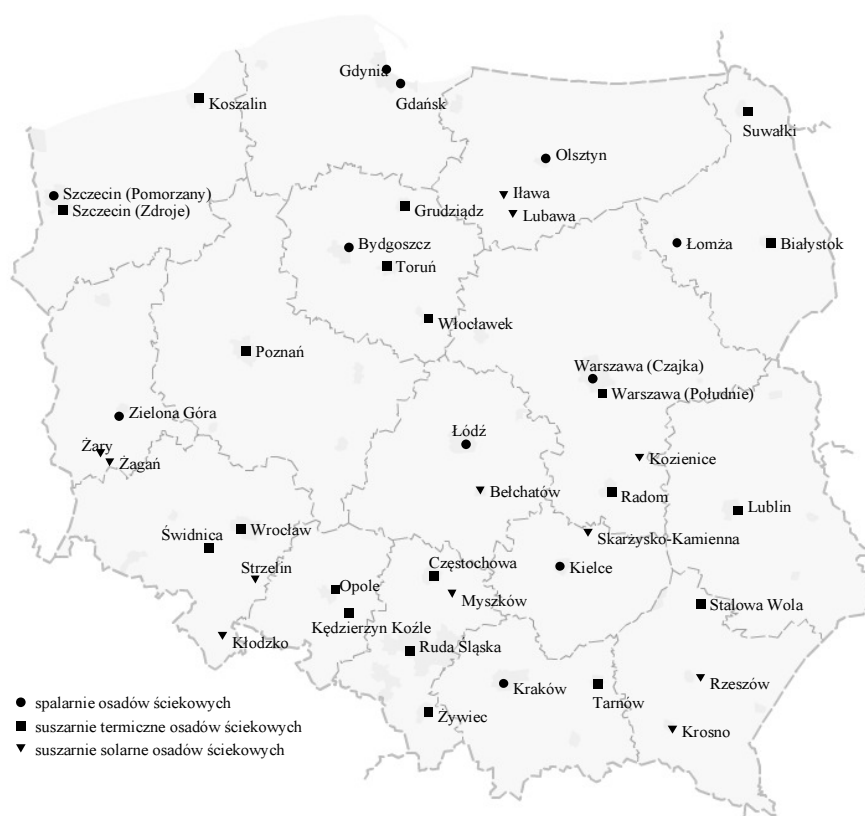
Rys. 2. Lokalizacja instalacji suszenia oraz spalarni osadów ściekowych

Aktualnie w Polsce jest jedenaście zakładów zajmujących się termicznym przekształcaniem osadów ściekowych. Siedem z nich wykorzystuje technologię fluidalną, w czterech przypadkach osady ściekowe spalane są na ruszcie. Pierwsza polska instalacja do spalania osadów z oczyszczalni ścieków komunalnych została uruchomiona w 1997 r. w Gdyni - Dębogórze. Najnowsza instalacja, będąca obecnie na etapie rozruchu i przed uzyskaniem pozwolenia na użytkowanie to Stacja Termicznej Utylizacji Osadów Ściekowych w Warszawie na oczyszczalni „Czajka”.