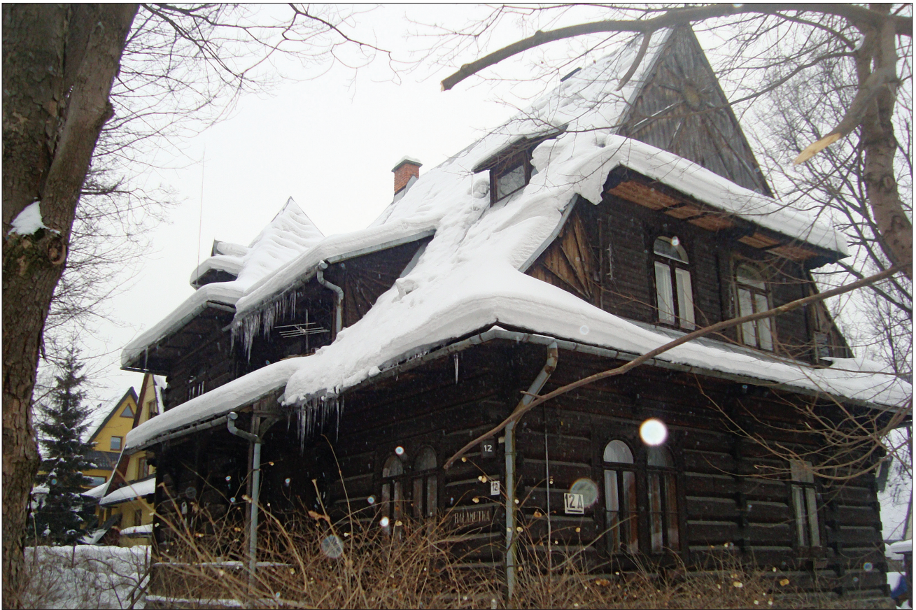
5. Zakopane, styl zakopiański, willa „Bałamutka”, ul. Jagiellońska 6. 5. Zakopane, the Zakopane style, the villa “Bałamutka”, 6 Jagiellońska St.

nobiegowe schody wiodą do głębokiego portyku, który flankują dwie kolumny, nad nim znajduje się obszerny ażurowy balkon. Balkon poddasza wieńczy dach „zakopiański” z wydatnym okapem, łamany z półszczytem górnym z wysoką sterczyną. 9