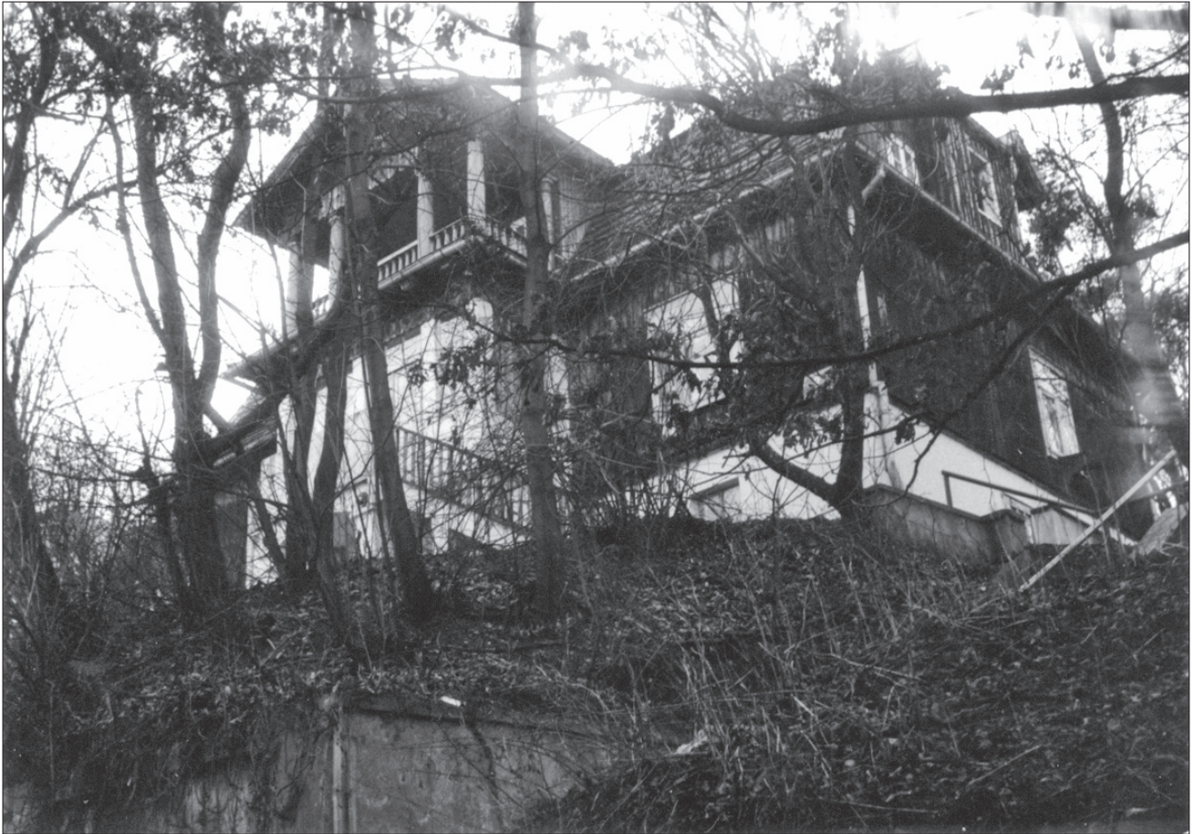
1. Gdynia, styl zakopiański, willa „Orla”, ul. Kasprowicza 2, 1928 r. 1. Gdynia, the Zakopane style, the villa “Orla”, 2 Kasprowicza St, 1928.

Ewolucja form „opływowych” w Polsce zachodziła w trzech etapach. Pierwszym jej stopniem były domy z przeszklonymi narożnikami; drugim – stosowanie linii krzywej w całych elewacjach. Najbardziej rozwinięty, trzeci stopień stanowiły „domy-okręty” zawierające w swych bryłach o zaokrąglonych narożnikach i jasnych elewacjach długie poziomy bulajów, balkonów i tarasów, a także nadbudówki na dachu (często maszynownie wind) stylizowane na „gniazdo kapitańskie” statku.