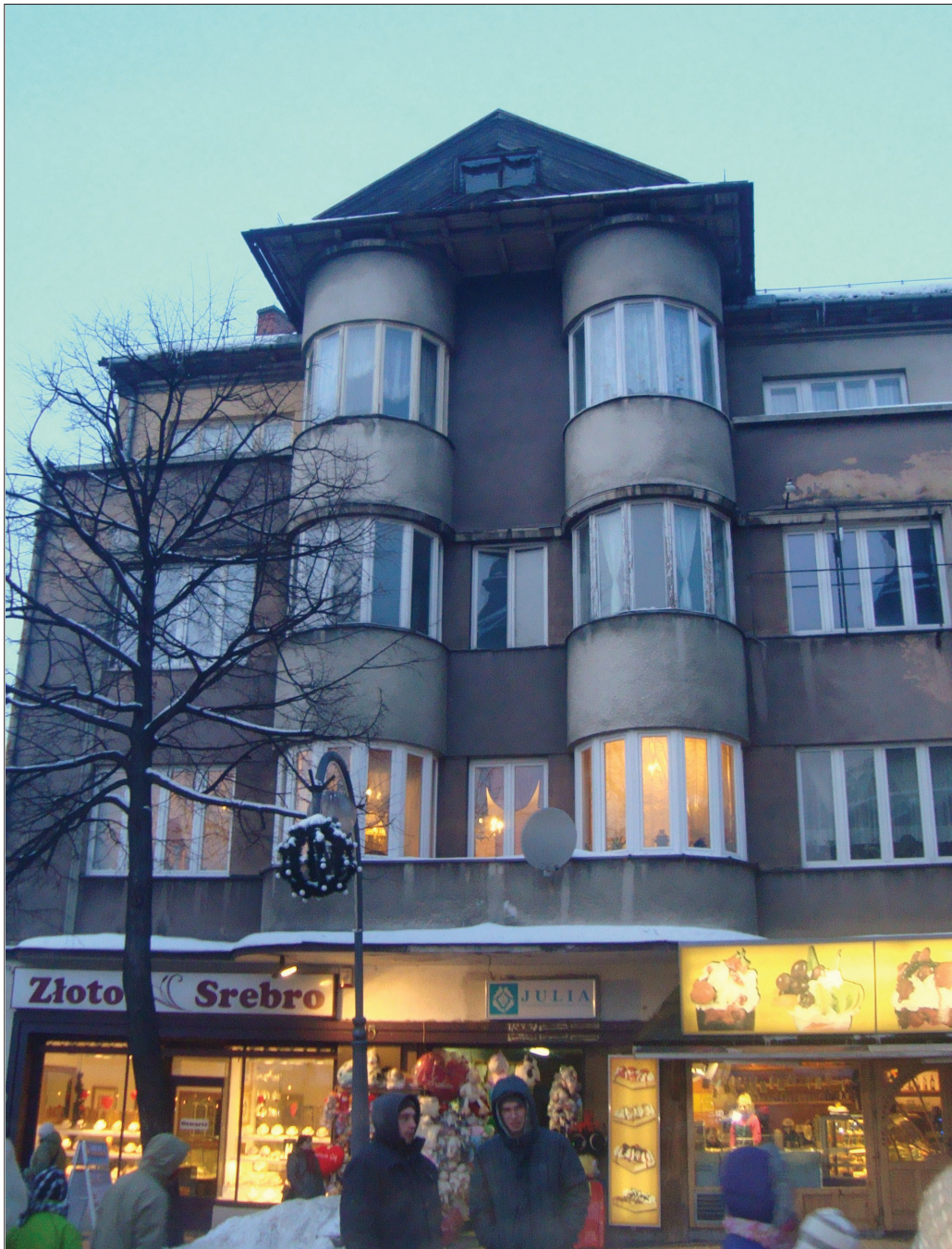
4. Zakopane, funkcjonalizm, kamienica z apteką, ul. Krupówki 35, lata 30. XX w. 4. Zakopane, functionalism, the house with a pharmacy at 35 Krupówki St, 1930s.

a wejście flankowane jest przez okna-światliki. Po wojnie w budynku mieściło się przedszkole, od 1969 r. obiekt był użytkowany przez Automobilklub Morski w Gdyni. 8