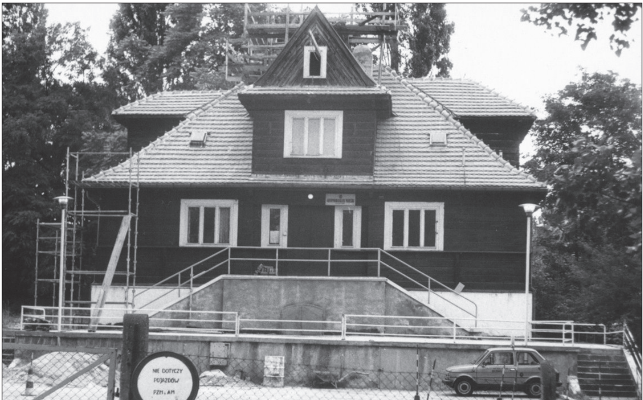
2. Gdynia, styl zakopiański, willa przy ul. I Armii Wojska Polskiego 28. 2. Gdynia, the Zakopane style, the villa at 28 I Armii Wojska Polskiego St.

uksztalowano symetrycznie z werandą parteru na osi, na profilowanej podwalinie w formie nawiązującej do filarów skarp odsuniętych od muru i połączonych od góry łukami odcinkowymi. Na poddaszu weranda przechodzi w balkon o tralkowej balustradzie, który został przekryty dwuspadowym dachem wspartym na sześciu dobrze wyważonych drewnianych kolumnach związanych od góry fryzem gontowych kształtek. Ponad nim znajduje się trójkątny szczyt daszku zwieńczony sterczyną z lukarną. 7