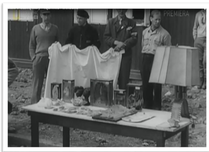
Foto 2. Kadr z filmu dokumentalnego: "Abazur z ludzkiej skóry - tajemnica Holokaustu" przedstawiający prawdopodobnie przedmioty wykonane z ludzkiej skóry