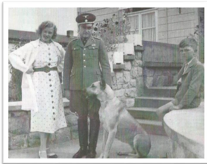
Foto. 1. Ilse Koch wraz ze swoim mężem Karlem Kochem i synem.

w przypadku obozu w Buchenwaldzie, gdzie zhierarchizowana władza w szczególności dbała o to, by przede wszystkim stosować takie metody „motywacji” więźniów do pracy, by były one skuteczne, a co istotne by nikt spoza obozu się o tym nie dowiedział. Taką kontrowersyjną sprawą są niemoralne zachowania osoby żyjącej wewnątrz więziennej struktury, formalnie nie należącą do osób zarządzających a mającą istotny wpływ na życie więźniów. Mowa o Ilse Koch, żonie komendanta obozu Karla Kocho. I. Koch bardzo szybko zyskała przydomek „Wiedźmy z Buchenwaldu” potem nawet „Suki z Buchenwaldu”. Analizowane opisy więźniów pomagają zobrazować postać żony komendanta, ocenianej jako gorszą w metodach postępowania od męża.