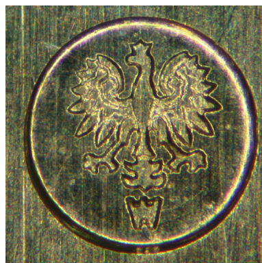
Wizerunek znaku z orłem

Ratyfikacja przez Prezydenta RP Konwencji nastąpiła w lipcu 2005 r., po uchwaleniu przez Sejm RP ustawy z dnia 11 marca 2005 r. (Dz. U. Nr 78, poz. 681), zgodnie z przewidzianą w polskich przepisach procedurą. Odrębnie,