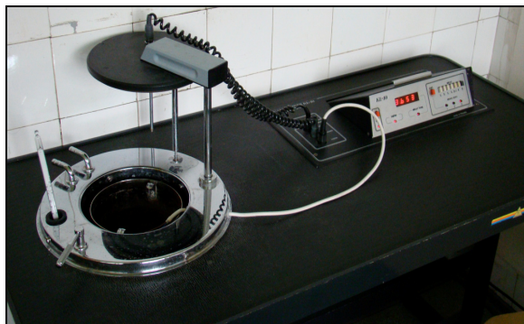
Rysunek 1. Stanowisko do badań kalorymetrycznych Figure 1. A calorimeter research stand

Ciepło spalania próbki paliwa było obliczane automatycznie wg wewnętrznego programu urządzenia.