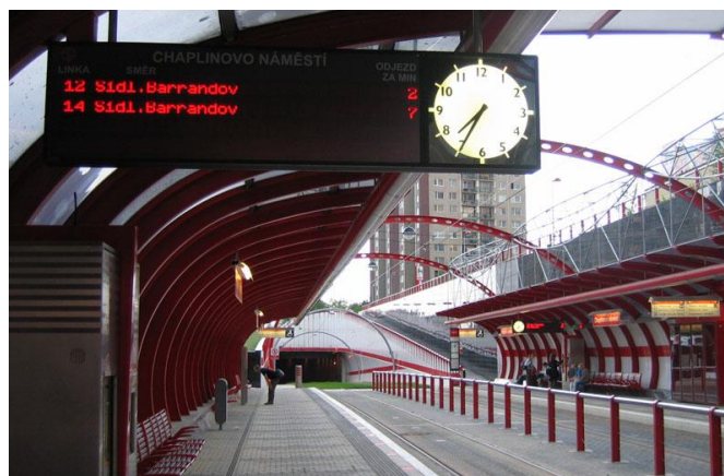
Rys. 4. Wyraźnie wydzielone strefy na przystanku przy linii tramwajowej na Barrandov w Pradze

Na bezpieczeństwo na wyspie przystankowej wpływa także odseparowanie użytkowników transportu zbiorowego od ruchu samochodowego przy pomocy barier, słupków oddzielających lub żywoplotów. Rozwiązanie takie powoduje, że pasażerowie mają wydzieloną strefę poruszania się, co wpływa na ich poczucie komfortu oraz podświadomie podnosi poziom ostrożności. Stanowi także utrudnienie w przechodzeniu przez jezdnię lub dobieganiu do przystanku w miejscu do tego niedozwolonym (rys. 4 i 5) [4].