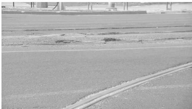
Rys. 11. Wypiętrzania nawierzchni z asfaltu laneo