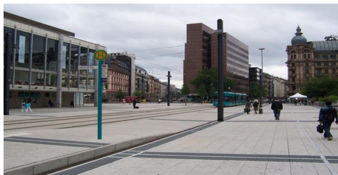
Rys. 7. Odcinek funkcjonujący jako „shared space” na Willy Brandt Platz we Frankfurcie nad Menem

Kolejnym sposobem lokalizacji torowiska w przestrzeni miejskiej jest tzw. „shared space” (rys. 7). Jest to poprowadzenie torowiska przez strefę ruchu pieszego. W przestrzeni przeznaczonej zarówno dla pieszych jak i tramwajów brak jest sygnalizacji świetlnej, przejść dla pieszych i krawężników. Wszyscy uczestnicy ruchu są równouprawnieni. Motorniczy musi dostosować prędkość do panujących warunków ruchu. Rozwiązanie to wymusza na pieszych i motorniczych większą ostrożność i wbrew pozorom w miejscach, gdzie zastosowano taki system liczba wypadków z udziałem pieszych maleje [23]. Mimo wszystko, wymagana jest wysoka kultura komunikacyjna i szereg badań przed realizacją takiego systemu.