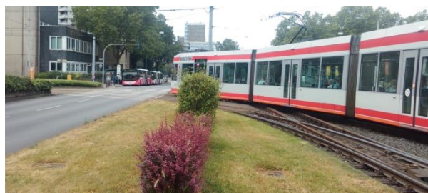
Rys. 5. Wyraźnie wydzielone strefy na przystanku przy linii tramwajowej na Barrandov w Pradze