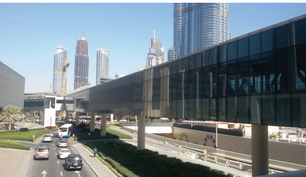
Il. 5–8. Widoki miasta (fot. autora)/ Views of the city (phot. by the author)

Dubaj przyjął własne unikalne podejście do inteligentnego miasta. Ta aspiracja opiera się na trzech filarach: komunikacji (czyli technologii), integracji (process) i współpracy międzyludzkiej (il. 2).