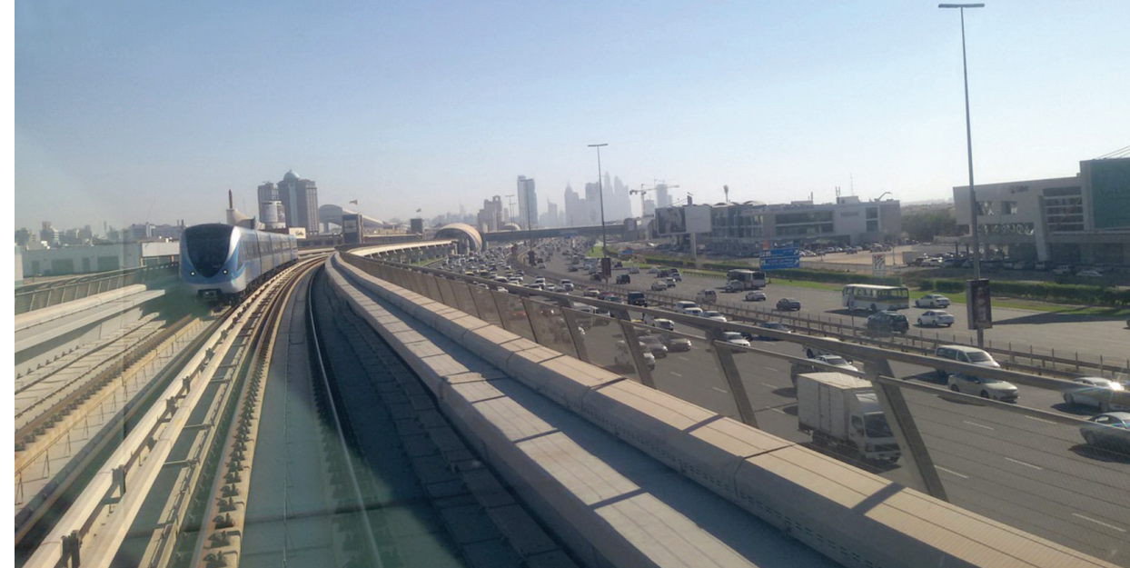
Il. 1. Bezobsługowe, w pełni zautomatyzowane i klimatyzowane metro usytuowane nad 14-pasmową autostradą/Uncrewed, fully automated and air conditioned metro rail situated above a 14-lane freeway.

The Dashboard collects and shows data from public and private sources, as well as from social media (Facebook – personal channels, Twitter – gov-