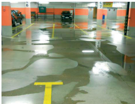
Rys. 5. Tworzące się kałuże na stropie poziomym +0,5 w trakcie przeprowadzania próby wodnej