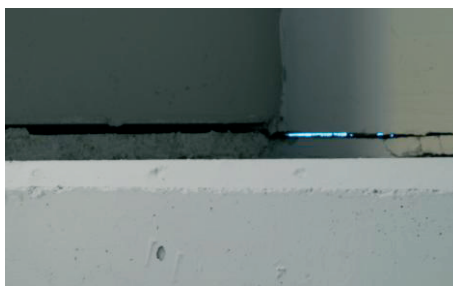
Rys. 6. Widok dylatacji stropu od dołu – widoczna niewypełniona szczelina dylatacyjna