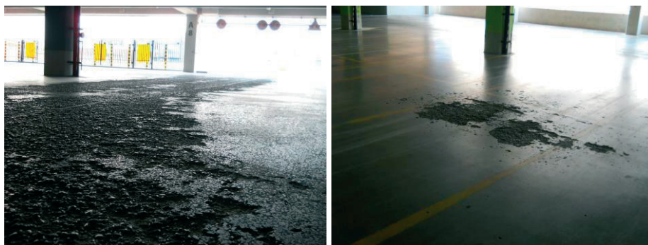
Rys. 3. Uszkodzenia powierzchni betonu: płyta na gruncie w strefie wjazdu na poz. -2 (z lewej), strop międzykondygnacyjny na poz. -0,5 (z prawej)

Górne powierzchnie stropów międzykondygnacyjnych oraz płyty na gruncie wykazują miejscowe uszkodzenia w postaci złuszczeń i ubytków betonu o głębokości 2-3 cm. Największe uszkodzenia występują na najniższym poziomie i obejmują całą trasę od głównego wjazdu do pochylni wjazdowej. Uszkodzenia powierzchni betonu stropów są mniej rozległe i pojawiają się przede wszystkim w miejscach zastoisk wodnych, w strefach zwiększonego ruchu samochodów oraz przy wpustach stropowych (por. Rys. 3). Przy braku prac zabezpieczających zasięg uszkodzeń z roku na rok się powiększa.