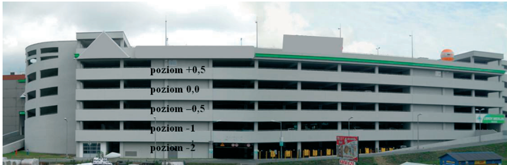
Rys. 1. Widok ogólny garażu z oznaczeniem poziomów kondygnacji

Sześciokondygnacyjny garaż wielopoziomowy o pow. użytkowej 16583 m 2 jest obiektem zbudowanym na planie prostokąta o wymiarach 86,95×32,65 m, z dwiema półkolistymi pochylniami – wjazdową i wyjazdową na osi podłużnej obiektu (Rys. 1).