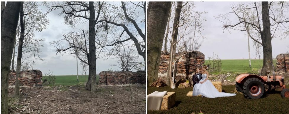
Fot. 6. Fragment parku z otwarciem widokowym, fot: K. Kliś, kwiecień 2022. Wiz. 1. Aranżacja „polska wieś”, opr. własne

powiązane z uprawą roli, a także maszyny rolnicze, jako elementy dekoracji (fot. 6, wiz. 1). Powyższe wnętrza, dzięki pagórkowatemu ukształtowaniu terenu i zadrzewieniu, są odseparowane od siebie, tworząc odrębne strefy, dzięki czemu można w tym samym czasie zorganizować kilka wydarzeń.