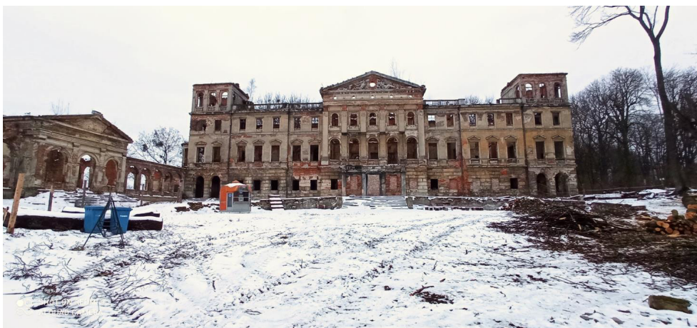
Fot. 3. Widok frontowy zespołu: oranżeria (po lewej), pałac (centralnie), fot: B. Buława, styczeń 2022

Zespół pałacowo-parkowy (w szczególności park krajobrazowy przypałacowy - zgodnie z nazewnictwem w rejestrze zabytków), pochodzi z przełomu XVIII/XIX w. i jest wpisany do rejestru zabytków pod numerem rejestrowym A/746/2021 (pierwszy wpis z 1959 r.). [11], [12] Zespół jest w stanie ruiny (fot. 3.). Oryginalna kompozycja krajobrazowa zabytkowego układu jest zatarta, w wyniku wielu dekad zaniedbań w zakresie prac pielęgnacyjnych (fot. 5.).[13] Problem ten wskazał Jan Duda, opisując piękno i walory przyrodnicze gminy Rudnik. [14] O samym Parku w Sławikowie napisał: (...) część parku, mauzoleum popada w ruinę, (...) mało widoczne są ruiny oranżerii, (...) od ostatniej wojny park był zaniedbany, park otaczają ruiny (...), stanowił on niegdyś piękny architektoniczny obiekt (...), obecnie jest w stanie ruiny i grozi zawaleniem ".