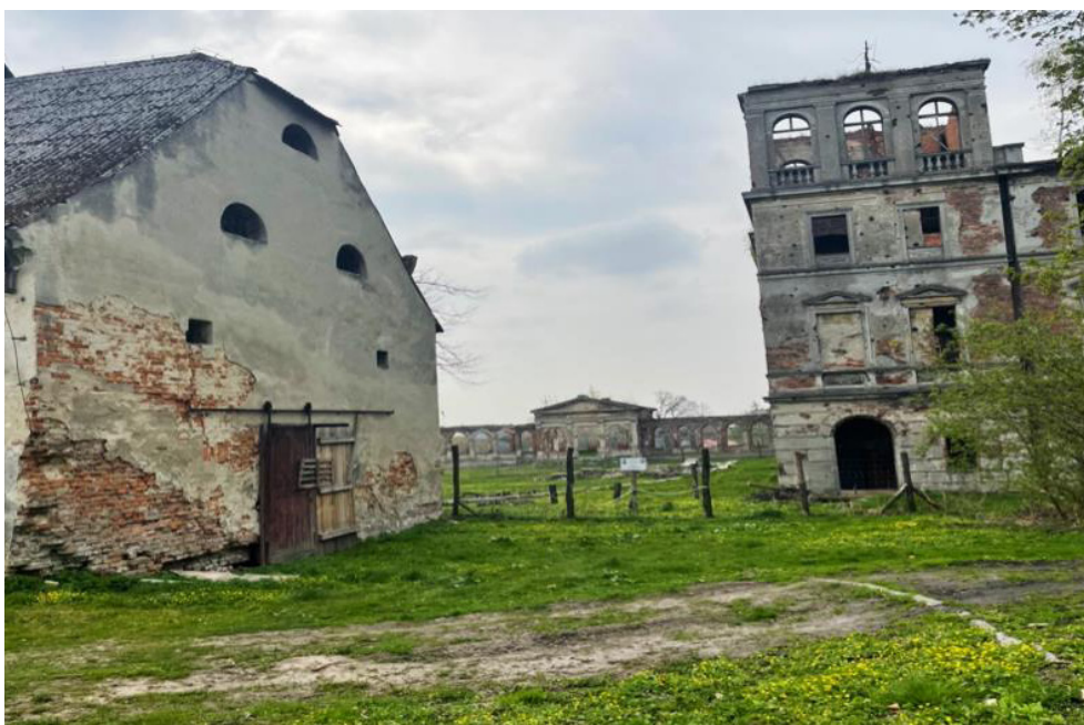
Fot. 4. Istniejące budynki: spichlerz (po lewej), ruiny oranżerii (centralnie, na drugim planie) oraz ruiny pałacu (po prawej), fot: J. Maciejczyk, kwiecień 2022