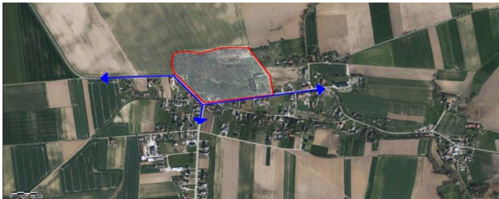
Rys. 1. Analiza lokalizacji zespołu

Zespół (ozn. na rys. 1 na czerwono) jest zlokalizowany centralnie, w miejscowości (sołectwie) Sławików i przylega do zwartej zabudowy jej centrum. Obszar parku o powierzchni 4,61 ha swym kształtem zbliżony jest do wieloboku (rys. 1). W szerszym ujęciu krajobrazowym, zespół jest zintegrowany z sylwetką miejscowości, tworząc zwartą kompozycję krajobrazową (fot. 1). Zespół zlokalizowany jest wzdłuż drogi, z osią kompozycyjną otwartą na wieżę pobliskiego kościoła parafialnego p.w. św. Jerzego (fot. 2).