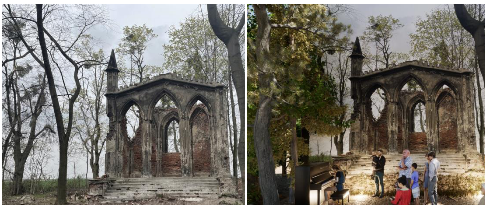
Fot. 7. Fragment parku, ruiny mauzoleum, fot: K. Kliś, kwiecień 2022. Wiz. 2. Aranżacja „koncert plenerowy”, opr. Własne

Dla mieszkańców została przewidziana strefa aktywności lokalnej - integracji społecznej i relaksu (ozn. żółtym szrafem na rys. 2). Taka potrzeba została wyraźnie zdiagnozowana przez samych interesariuszy, podczas wcześniej zrealizowanych technik konsultacyjnych. Skupiono się na stworzeniu atrakcyjnej przestrzeni, dla zróżnicowanych wiekowo grup użytkowników. Zostały zaprojektowane miejsca spotkań, spacerów, miejsca na leżaki oraz hamaki. Strefa ta uwzględnia także możliwość organizowania koncertów i występów plenerowych, festynów, kina plenerowego, czy dożynek. Dla nieco młodszych odbiorców przewidziano edukacyjny / tematyczny plac zabaw. W parku zostały odtworzone istniejące leśne ścieżki, które wieczorami będą oświetlone. Mieszkańcom gminy Rudnik, tj. społeczności lokalnej, zaproponowano szeroki wachlarz czasowych aranżacji tematycznych, w ramach poszczególnych wnętrz parkowych. Wokół ruin mauzoleum, zaproponowano strefę kontemplacji oraz miejsce organizacji kameralnych koncertów plenerowych (fot. 7, wiz. 2). Jest to przestrzeń łącznie realizująca potrzeby z perspektywy gminnej, jak i lokalnej. Tym samym zaproponowano ją, jako przestrzeń integrującą różne grupy użytkowników.