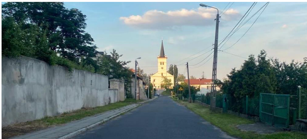
Fot. 2. Oś kompozycyjna wzdłuż zespołu (po lewej), fot: J. Maciejczyk, kwiecień 2022