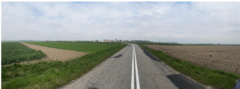
Fot. 1. Sylweta miejscowości Sławików wraz z zespołem, widok od strony południowej, kwiecień 2022