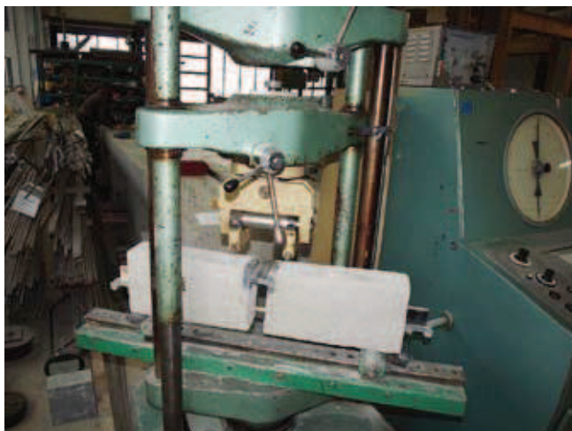
Rys. 3. Próbkę na stanowisku badawczym