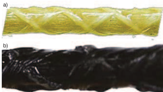
Rys. 1. Widok powierzchni prętów kompozytowych: a) GFRP (szkło), b) BFRP (bazalt)

Badaniu przyczepności poddano pręty GFRP o średnicach nominalnych 8,5 mm i 11 mm oraz pręty BFRP o średnicach nominalnych 7 mm i 9 mm, wytwarzane przez tego samego producenta. We wszystkich prętach zastosowano dwukierunkowo wypukły oplot pasmami włókien nasączonych żywicą, o kącie pochylenia pasm około 45° (rys. 1).