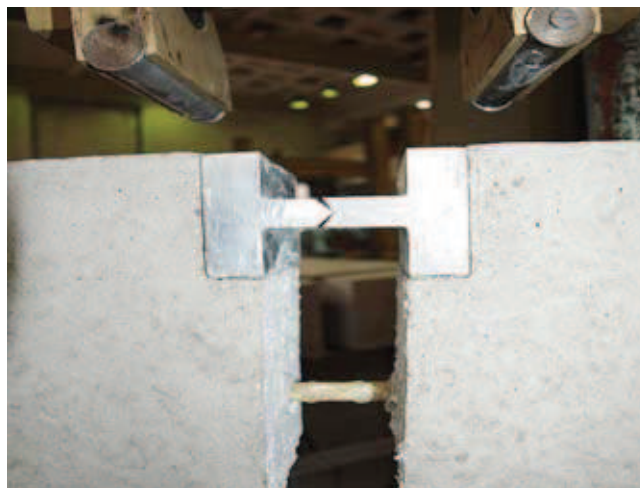
Rys. 4. Widok przegubu belki