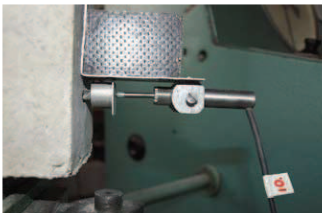
Rys. 5. Zamocowanie przetwornika przemieszczeń liniowych przy czole próbki

długości pręta przyczepność wykluczano, stosując tulejki z tworzywa sztucznego o średnicy wewnętrznej 14,6 mm. Dla każdej ze średnic wykonano po 5 belek. Wszystkie wymiary próbek spełniały wymagania normowe.