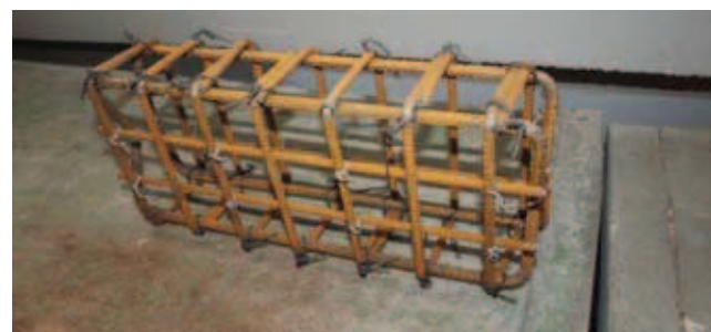
Rys. 2. Widok stalowego pomocniczego zbrojenia próbek umieszczanego w obu jej częściach

Badania przyczepności prętów przeprowadzono metodą belkową jak dla prętów stalowych, zgodnie z załącznikiem C normy PN-EN 10080 [4]. Stalowe pomocnicze zbrojenie próbek wykonano ze stali St500 zgodnie z rysunkiem C.3 normy – Badanie belki typu A ( d < 16 mm) – jest ono pokazane na rysunku 2. Długość odcinka przyczepności wynosiła w każdym przypadku 10d ( d – nominalna średnica pręta), na pozostałej