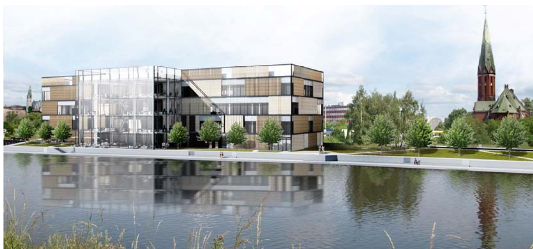
Fig. 1. Lab building on Łasztownia in Szczecin, aut.: Małgorzata Duda and Anna Malinowska, KPA, ZUT, 2017 Ryc. 1. Budynek laboratorium na Łasztowni w Szczecinie, aut.: Małgorzata Duda i Anna Malinowska, KPA, ZUT, 2017

important is the author's model based on P. H. Lindsay and D. A. Norman decision model (ibid. 40-42; C.f. Lindsay, P. H. and Norman, D. 1984: Human Information Processing (An Introduction to Psychology) , Państwowe Wydawnictwa Naukowe, Warszawa). The evaluation process is designed to make it possible to correct the course of design, but also to carry out the necessary revision of the architect's decision, in extreme cases resulting in the reprogramming of the task, fundamental changes affecting the criteria hierarchy or other assumptions for the task, in which the specificity of the activity in the discipline of architecture is expressed.