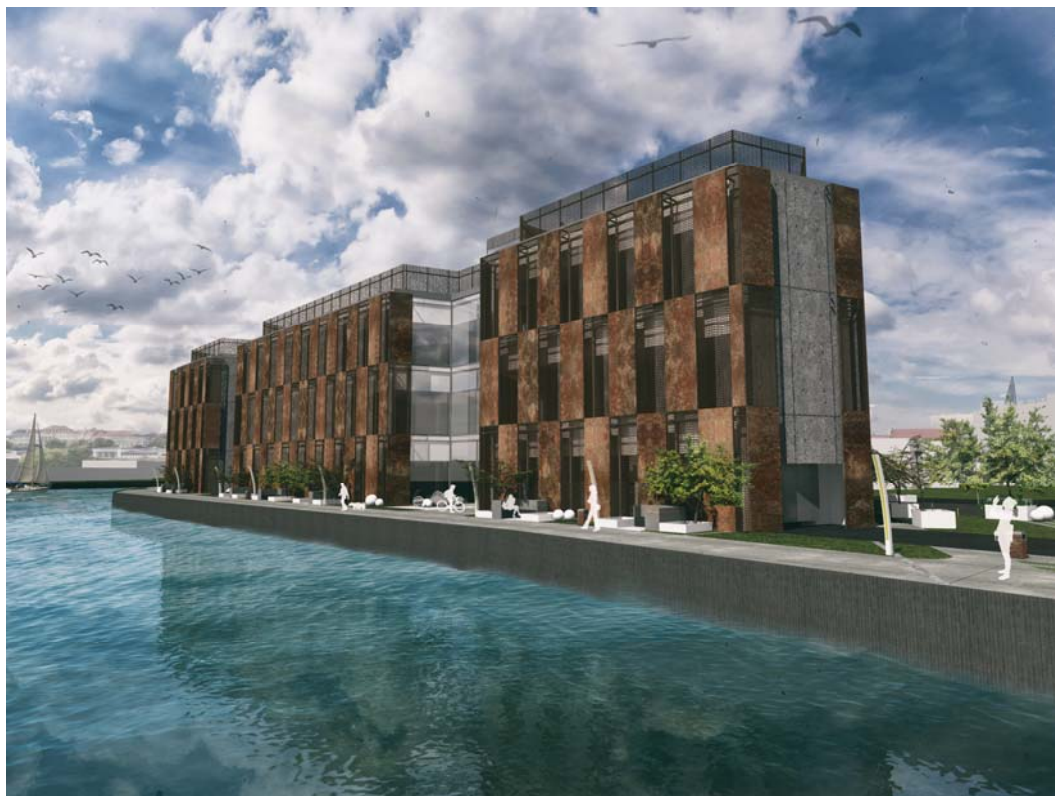
Fig. 2. Lab building on Łasztownia in Szczecin, aut.: Justyna Rudnicka and Ewa Tomanek, KPA, ZUT, 2017