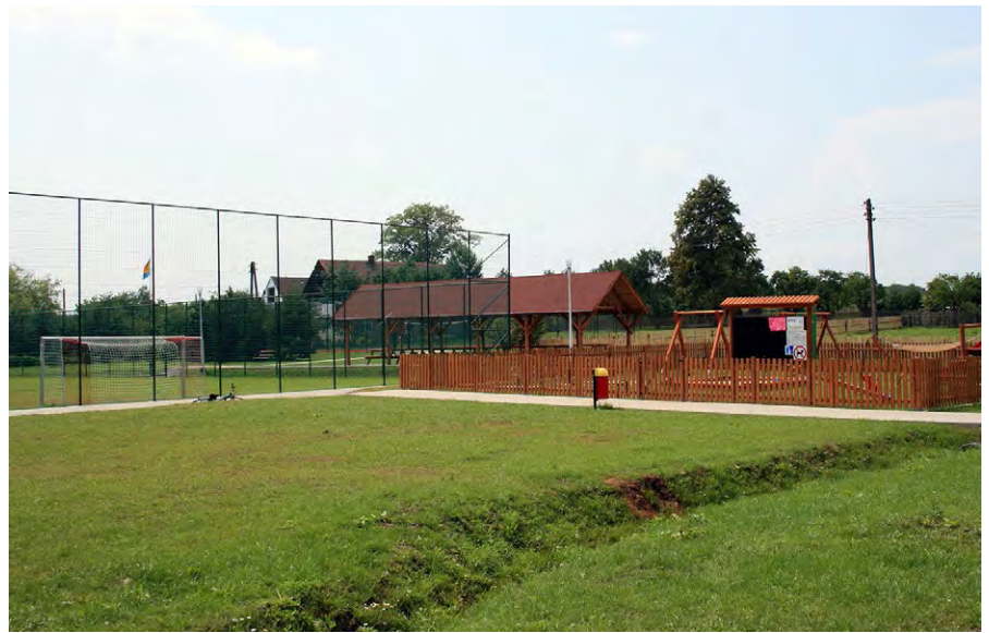
Fig. 4. Recreational area near a sports field in Rudzica