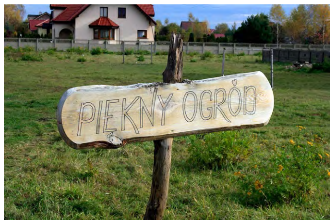
Fig. 1, 2. Sign for the most beautiful garden in the village of Pęgów