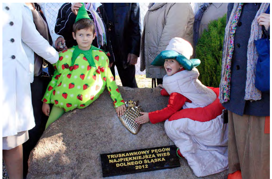
Fig. 5. Pęgów – the Strawberry Village