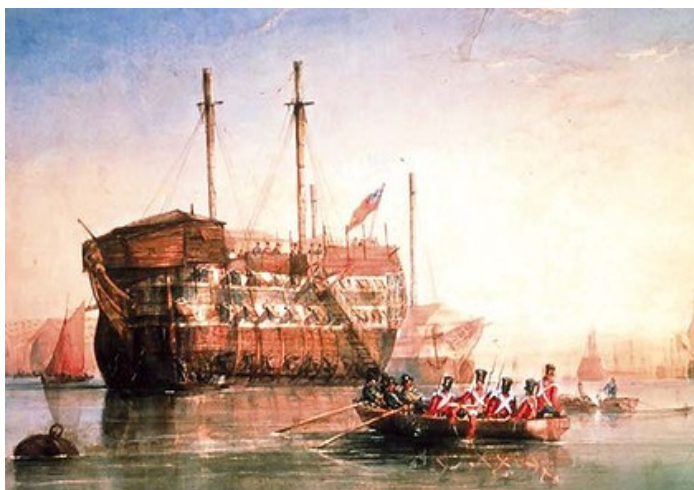
Rys. 2. E. Tucker, Strażnicy płynący na statek jeniecki zacumowany w porcie Deptford