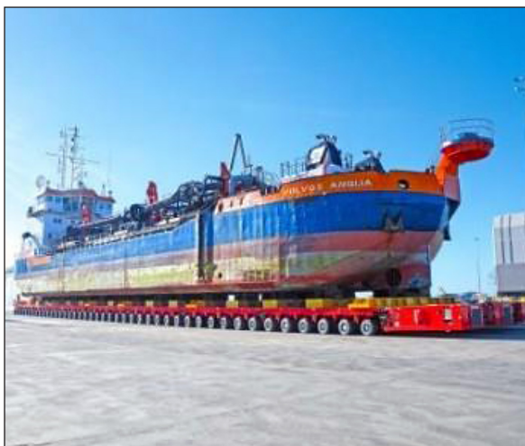
Rys. 7. Transport statku towarowego na wieloosiowej platformie [Transport statku towarowego...]