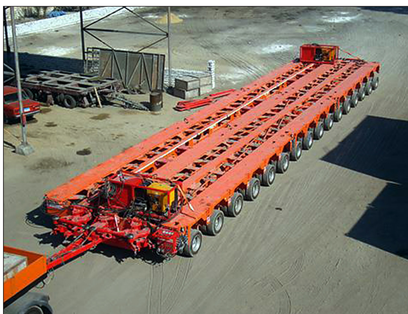
Rys. 6. Wieloosiowa platforma do transportu statków firmy Scheuerle Fahrzeugfabrik GmbH [Wieloosiowa platforma...]