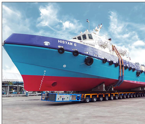
Rys. 8. Transport statku pasażerskiego na wieloosiowej platformie samojezdnej [Transport statku pasażerskiego...]

oddalonym od miejsc tarła i przebywania ryb, w miejscu przewężenia mierzei, oraz w pobliżu wejścia do rzeki Elbląg. Istotne jest ukształtowanie terenu, mierzeja posiada kilkumetrowej wysokości wydmy. Przejście lądowe należałoby tak umiejscowić, żeby droga jezdna była o łagodnym nachyleniu, być może nawet pozioma, aby nie trzeba było wykonywać przekopu na wydmie. Usytuowana na poziomie nieznacznie wyższym od poziomu morza, aby łatwiejsze było wydokowanie platformy ze statkiem i wjazd platformy z doku na drogę lądową. W przeciwnym wypadku trzeba będzie stosować dodatkowe urządzenia dostosowujące poziomy, rampy wjazdowe lub nawet zamiast doku stosować śluzy, co znacznie podroży koszty rozwiązania.