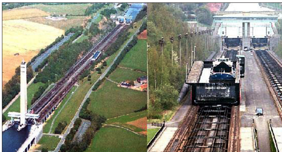
Rys. 5. Przeważanie statków na kanale Brukselskim – Charleroi. Pochylnia Ronqieres. Podnośnik statków. Statek podnoszony w basenie równoległym windą pochyłą – wciągarką torową [Pochylnia Ronqieres...]