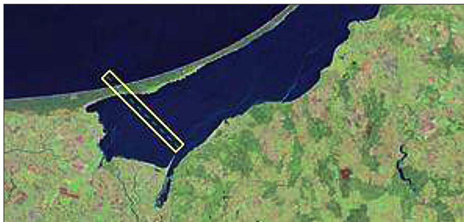
Rys. 3. Kanał żeglugowy Nowy Świat na Mierzei Wiślanej – projekt połączenia drogą morską Zalewu Wiślanego z Zatoką Gdańską w obrębie terytorium Polski, mający na celu skrócenie, pogłębienie i uproszczenie morskiego szlaku na Bałtyk [Projekt...]

Lokalizacja przejścia lądowego nie jest tak istotna, jak w przypadku kanału. Należy wybrać rozwiązanie jak najmniej zmieniające środowisko. Przejście to również powinno znajdować się w miejscu jak najbardziej oddalonym od siedlisk: ptaków, zwierząt, roślinności prawnie chronionej,