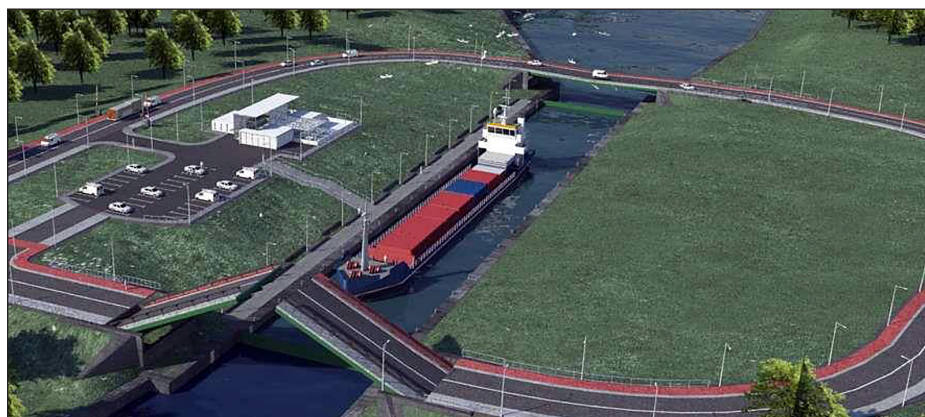
Rys. 2. Przeprawa przez Mierzeję Wiślana [Przeprawa...]

pejskiej i Zalewu Wiślanego (żegluga po nim znajduje się poza kontrolą UE). Jest to szczególnie ważne w kontekście istniejących zagrożeń geopolitycznych.