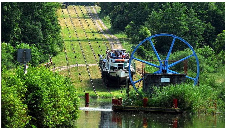
Rys. 4. Przeważanie statków na Kanale Elbląskim, pochylnie na kanale Elbląg – Ostróda [Pochylnie...]