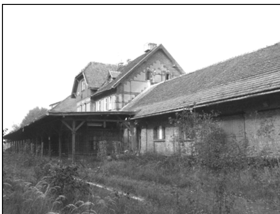
Fot. 5. Budynek stacji kolejowej w Łądku-Zdroju.

Photo 4. The station building in Odrzychowice.