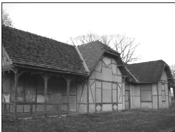
Fot. 4. Budynek stacyjny w Odrzychowicach.

Photo 3. The station building in Żelazno.