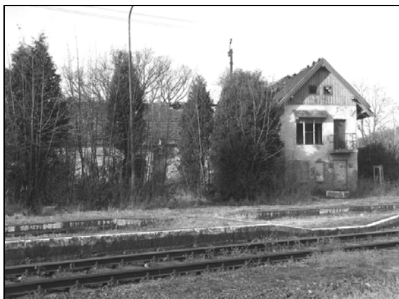
Fot. 2. Budynek stacyjny w Krosnowicach.

Photo 2. The station building in Krosnowice.