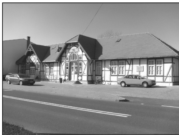
Fot. 7. Dawny budynek stacji kolejowej w Stroniu Śląskim, obecnie siedziba Centrum Edukacji, Turystyki i Kultury.

Photo 6. The station building in Stójków.