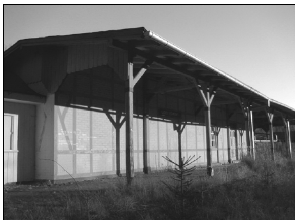
Fot. 6. Budynek stacyjny w Łądku Stójkowie.

Photo 6. The station building in Stójków.