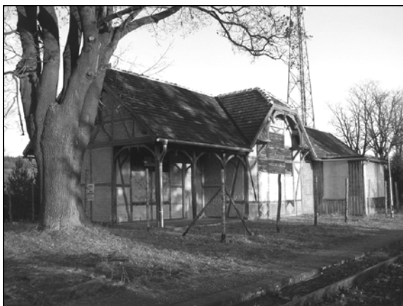
Fot. 3. Budynek stacyjny w Żelaznie.

Photo 2. The station building in Krosnowice.