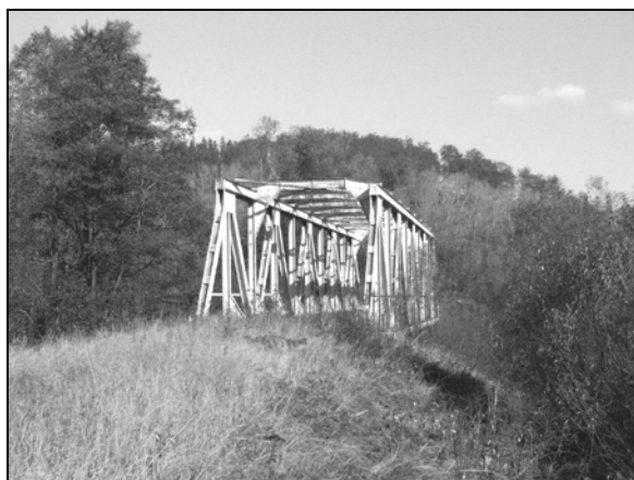
Fot. 1. Wiadukt kolejowy linii Kłodzko-Stronie Śląskie w Strachocinie.

2009). Drugi most wpisany w krajobraz Doliny Białej Łądeckiej znajduje się w Strachocinie (fot. 1). Jest to jednoprzęsłowy most kratownicowy o długości 48,56 m i wysokości podtorza nad lustrem wody 3 m (Kumor, 1996). Wzdłuż omawianej linii kolejowej wybudowano dwie drewniano-murowane wieże ciśnień w Trzebieszowicach i stacji końcowej w Stroniu Śląskim. Linia od stacji w Krosnowicach do punktu docelowego w Stroniu Śląskim liczy 24 km długości. Na tym odcinku wybudowano 8 przystanków kolejowych (tab. 2).