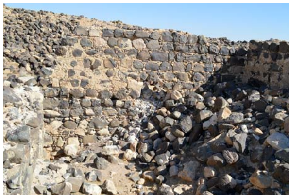
Ryc. 9. Wykop sondażowy T.1 ( aedes principiorum ) po eksploracji w ramach Limes Arabicus Project (stan na listopad 2017).

Mimo że stanowisko nie jest ogrodzone, jego względna izolacja od współczesnej zabudowy sprawia, że do tej pory nie było ono przedmiotem systematycznego pozyskiwania budulca. W efekcie stan zachowania pozostałości architektonicznych można określić jako relatywnie bardzo dobry (ryc. 10). Mury obronne zachowane są miejscami do wysokości przekraczającej 4 m od poziomu gruntu. Niestety są one szczególnie narażone na zniszczenie, gdyż zbudowano je z opracowanych raczej symbolicznie bazaltowych bloków. Często nie tylko nie