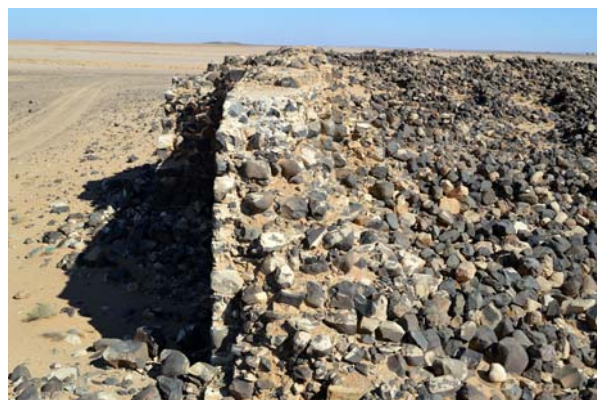
Ryc. 11. Dajaniya. Przekrój przez mur obronny