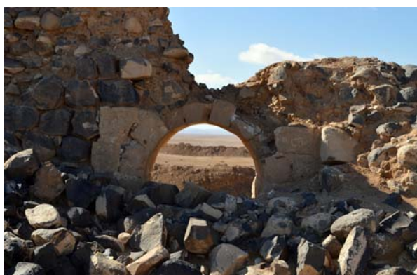
Ryc. 10. Dajaniya. Przejście w murze obronnym fortu