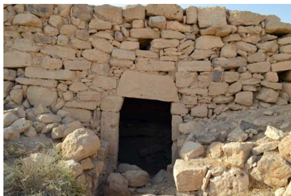
Ryc. 6. Umm er-Rasas. Budynek przebudowany na potrzeby pasterzy z wykorzystaniem bloków kamiennych znalezionych na stanowisku

Fig. 5. Umm er-Rasas. Traces of fire left (by shepherds) on the ceiling of a well-preserved building