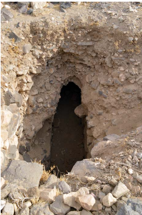
Ryc. 15. Tuwaneh. Wkop rabunkowy do kanału odprowadzającego wodę i nieczystości ze szczytu wzgórza południowo-wschodniego

Fig. 14. Tuwaneh. Large pit, probably dug during construction of the road running through the site