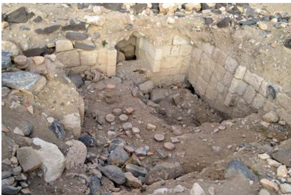
Ryc. 13. Tuwaneh. Pozostałości łaźni rzymskich ze śladami działalności rabusiów

Fig. 13. Tuwaneh. Remains of Roman baths, with traces of looting