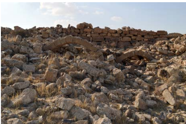
Ryc. 3. Umm er-Rasas. Typowy stan zachowania pozostałości architektonicznych przed eksploracją

Fig. 2. Umm er-Rasas, satellite imagery