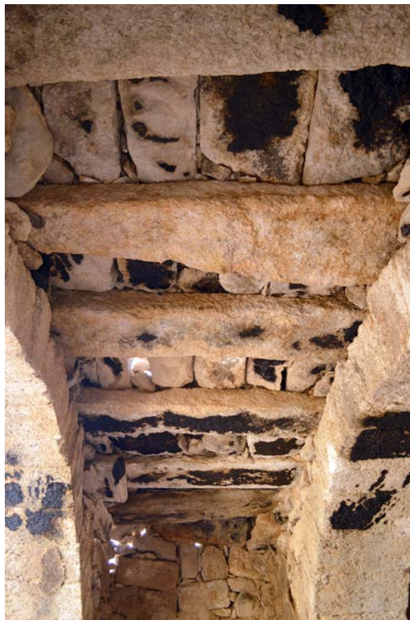
Ryc. 5. Umm er-Rasas. Ślady ognia (działalność pasterzy) na stropie dobrze zachowanego budynku

W 1986 roku wykopaliska na stanowisku rozpoczęła ekspedycja Studium Biblicum Franciscanum pod kierownictwem Michele Piccirillo (ryc. 4). Do tej pory ekspedycji tej udało się przebadać zaledwie niewielką część stanowiska. Mimo to zidentyfikowano tam już aż 16 kościołów. W części z nich odkryto dobrze zachowane mozaiki. Szczególnie godne uwagi są te, które odkryto i wyekspozowano w kościele św. Stefana, gdzie m.in.