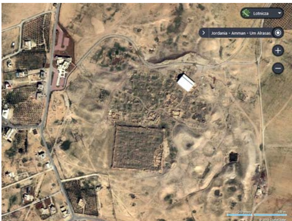
Ryc. 2. Umm er-Rasas. Zobrazowanie satelitarne

Fig. 2. Umm er-Rasas, satellite imagery