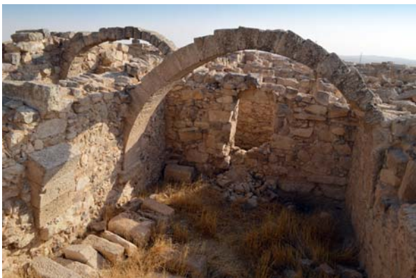
Ryc. 4. Umm er-Rasas. Typowy stan zachowania pozostałości architektonicznych po eksploracji

Fig. 3. Umm er-Rasas. Typical condition of architectural remains before exploration