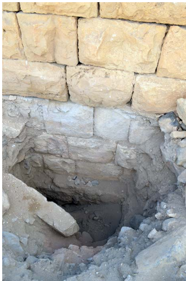
Ryc. 16. Tuwaneh. Wkop rabunkowy przy murze jednej z budowli

Fig. 15. Tuwaneh. Looting pit in a ditch carrying water and sewage from the top of the south-eastern hill