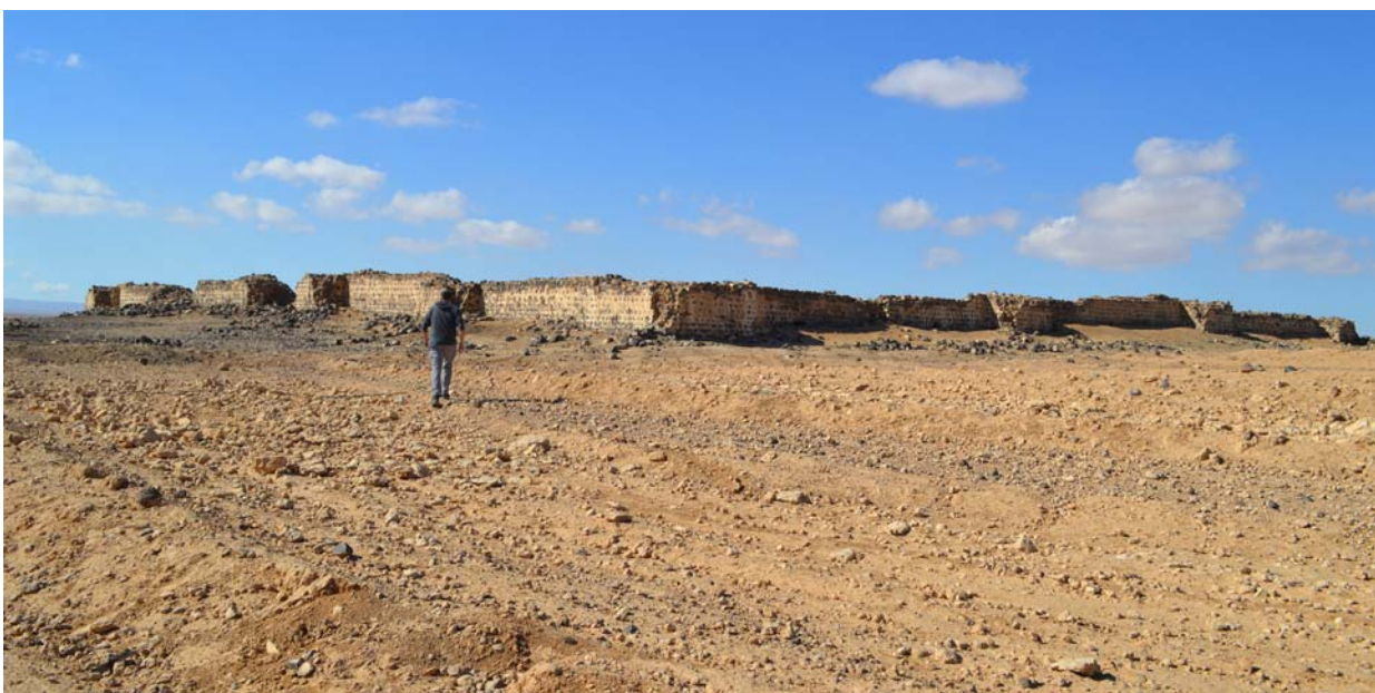
Ryc. 8. Dajaniya. Widok z zewnątrz na mury fortu

The most extensive archaeological research on Dajaniya was conducted in 1989 as part of the Limes Arabicus Project , including seven trial trenches (fig. 9). The archaeological work done so far has not provided a final answer as to when the fort was built. The material obtained in field surveys was mainly pottery from the Late Roman and Early Byzantine period (up to early 6 th century). However, it also included earlier pottery, dating back to the early 2 nd century CE [23, pp. 93–94]. The presence of Early Roman pottery indicates that there was some human activity in the region then. According to Brünnow and von Domaszewski [17, p. 311], the fort in Dajaniya was built in the 2 nd century CE. However, no architectural structures have been found that would confirm such an early presence of Roman troops there. According to Lander [29, pp. 144–145], the layout of the fort represents a transitory stage between early and late Roman military camps. Comparing the fort in Dajaniya