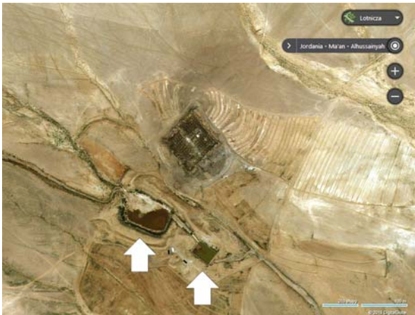
Ryc. 7. Dajaniya. Zobrazowanie satelitarne. Strzałkami zaznaczono współczesne rezerwuary wody. Na północ i północny wschód od fortu widoczne ślady działalności rolniczej

Fig. 7. Dajaniya. Aerial imagery. Arrows show present water reservoirs. Traces of agricultural activity to the north and north-east of the fort are clearly visible.