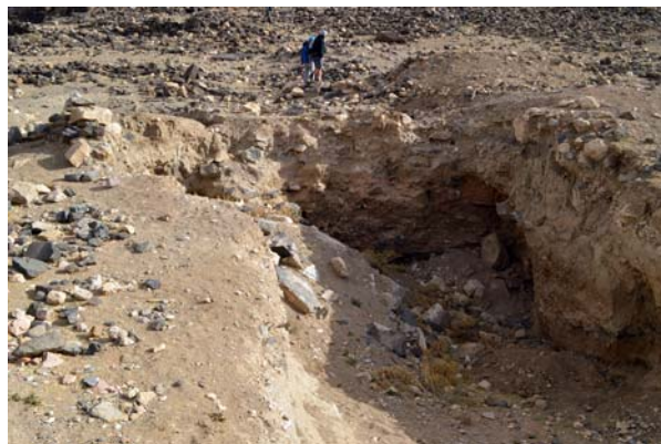
Ryc. 14. Tuwaneh. Duży wkop związany być może z budową drogi przebiegającej przez środek stanowiska

Fig. 13. Tuwaneh. Remains of Roman baths, with traces of looting