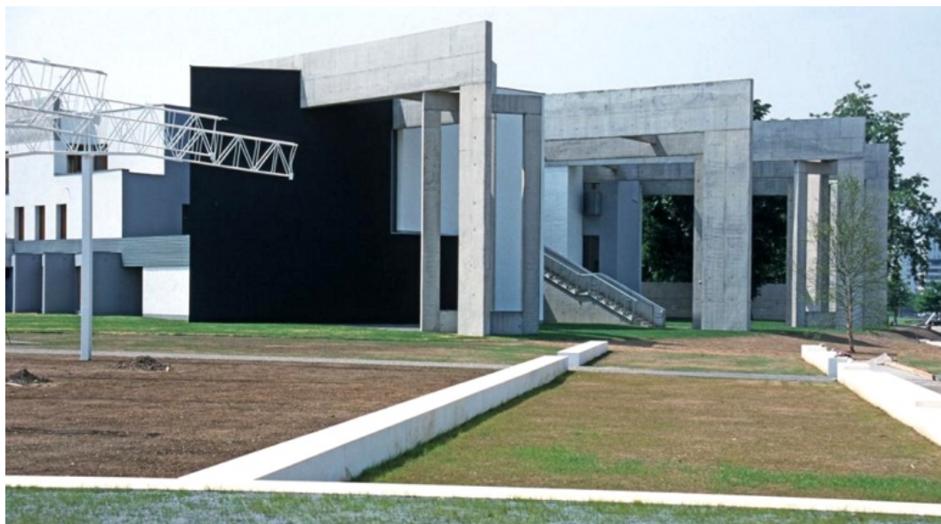
Fig. 1. Z. Hecker, Jewish Community Centre, Duisburg, Germany.

Ryc. 1. Z. Hecker, Centrum Wspólnoty Żydowskiej, Duisburg, Niemcy.