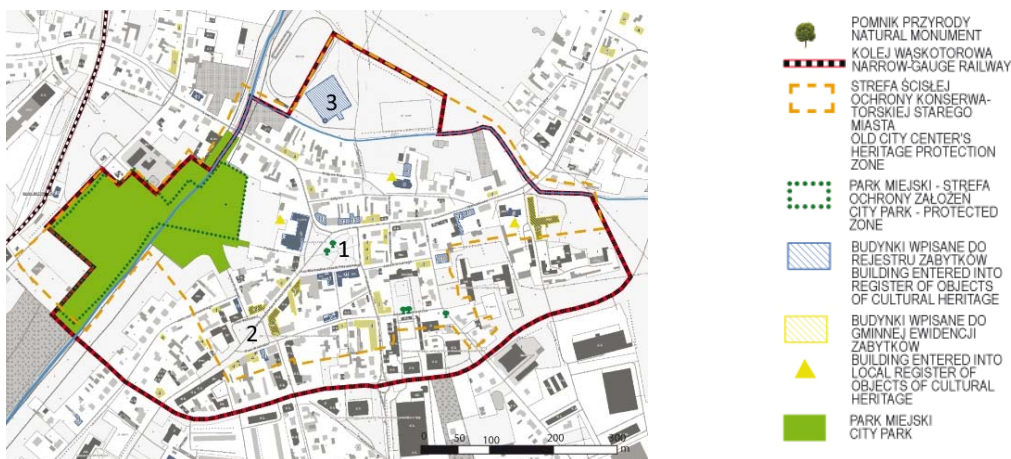
Fig.3 Cultural values of Rawa Mazowiecka, 1. market square, 2 square Koński Targ, 3. Castle, source: [20]

Ryc. 3 a) Fragment pierzei północnej rynku b) jatki miejskie. Źródło: fot. Sandra Perska, 2016