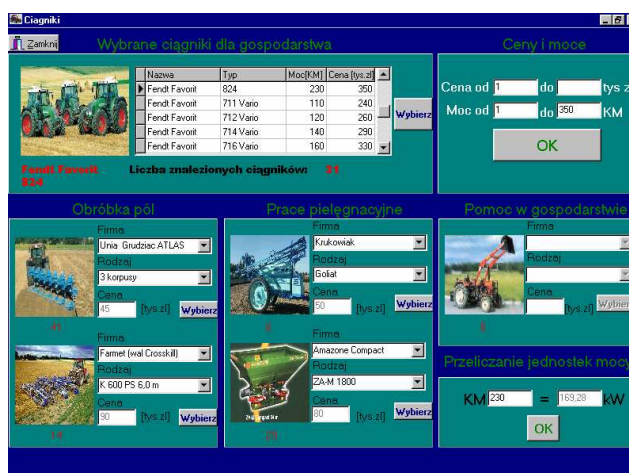
Rys. 3. Widok formularza Ciągniki Fig. 3. View of "Tractors" sheet

Każdy z powyższych wyborów zarówno ciągniki jak i maszyny rolnicze, mogą być na życzenie użytkownika zaakceptowane i dołączone do spisu wybranych maszyn. Po akceptacji otwiera się formularz Wybor (rys. 5), którego opcje pozwalają m.in. na korektę decyzji inwestycyjnej ( Usuń wybraną maszynę ) przed przejściem do formularza wydruku wybranego sprzętu.