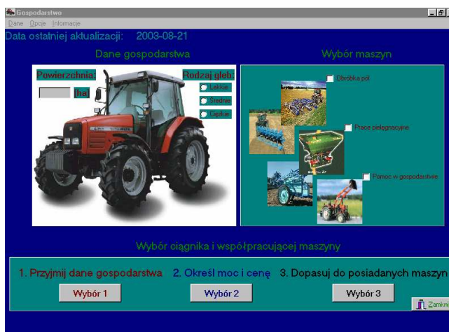
Rys. 2. Widok formularza głównego Fig. 2. View of the main sheet

wybrać firmę, następnie rodzaj. W tabeli formularza Maszyny (rys.4) wyświetlone zostaną ciągniki współpracujące z odpowiednią maszyną rolniczą.