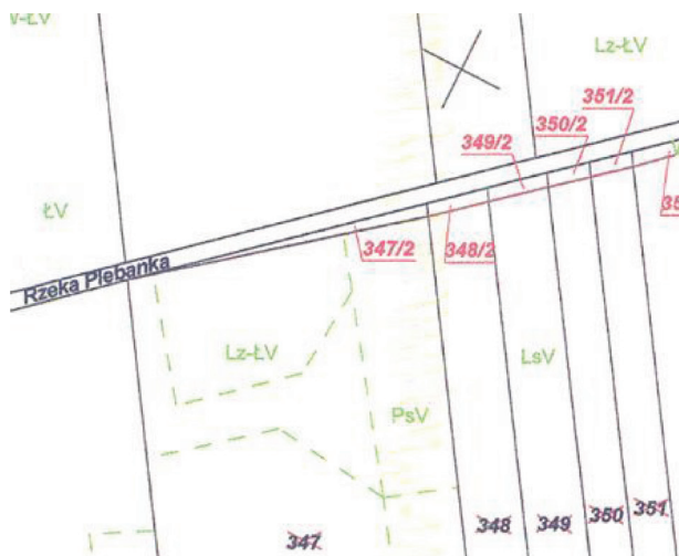
Figure 4. Fragment of a map with the draft delimitation stream Bulówka.