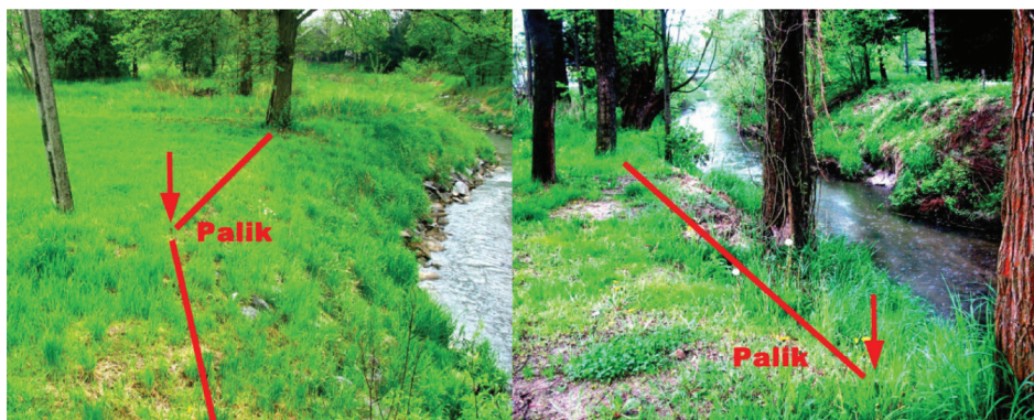
Figure 1. The course of the shore line in cross-section.