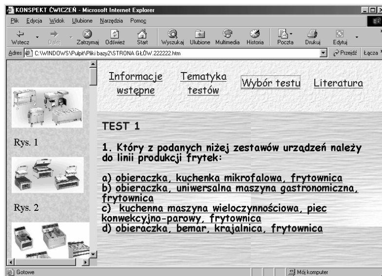
Rys. 4. Okno z przykładowo wybranym testem Fig. 4. Window with selected exemplary test