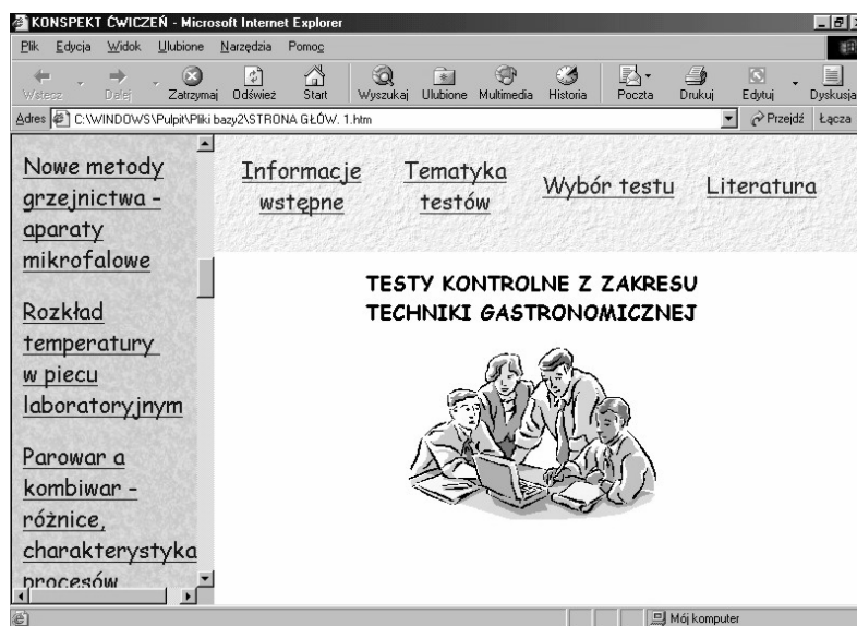
Rys. 1. Okno główne testu kontrolnego z techniki gastronomicznej Fig. 1. Main window of control test on the subject of gastronomic technique

Opracowany test weryfikacji wiedzy jest testem jednokrotnego wyboru. Tematyka poszczególnych testów jest skoordynowana z tematami zajęć prowadzonych ze studentami na wykładach i ćwiczeniach z przedmiotu Technika Gastronomiczna. Możliwy jest również wybór testu sprawdzającego wiedzę z całego zakresu materiału po wcześniejszym uzgodnieniu z prowadzącym zajęcia.