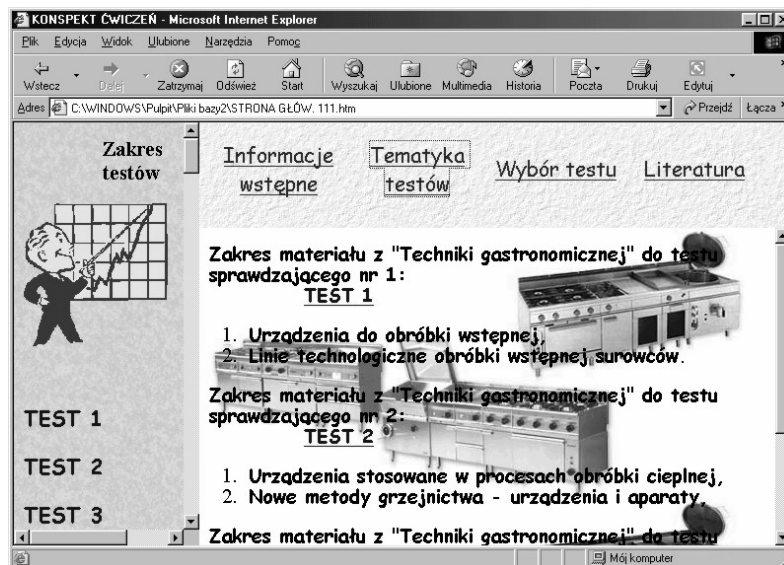
Rys. 3. Okno z tematyką i zakresem przedstawionych testów kontrolnych Fig. 3. Window with the subject-matter and range of presented control tests