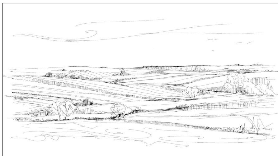
Ryc. 3. Rolniczy krajobraz w otoczeniu Słomnik (rys. A. Wójtowicz-Wróbel, 2016)

the basic forms of use for residents and visitors, but the main direction is culture and tourism supported both by local government, social institutions and the residents themselves. These two branches are developed on the basis of the preserved measurable qualities of the town (numerous historical buildings adapted for use as art galleries, painting studios, sculpting workshops and others, as well as services for tourists visiting the town for festivals, arts and crafts fairs or recreational stays), as well as non-measurable (the unique character of the place, local rituals, traditions and art). The creation of attractive and unique new forms of use based on local traditions and art is one of ways of increasing the attractiveness of the venue. The third town, Niepołomice, is experiencing the most dynamic changes significantly influencing its image and leading to