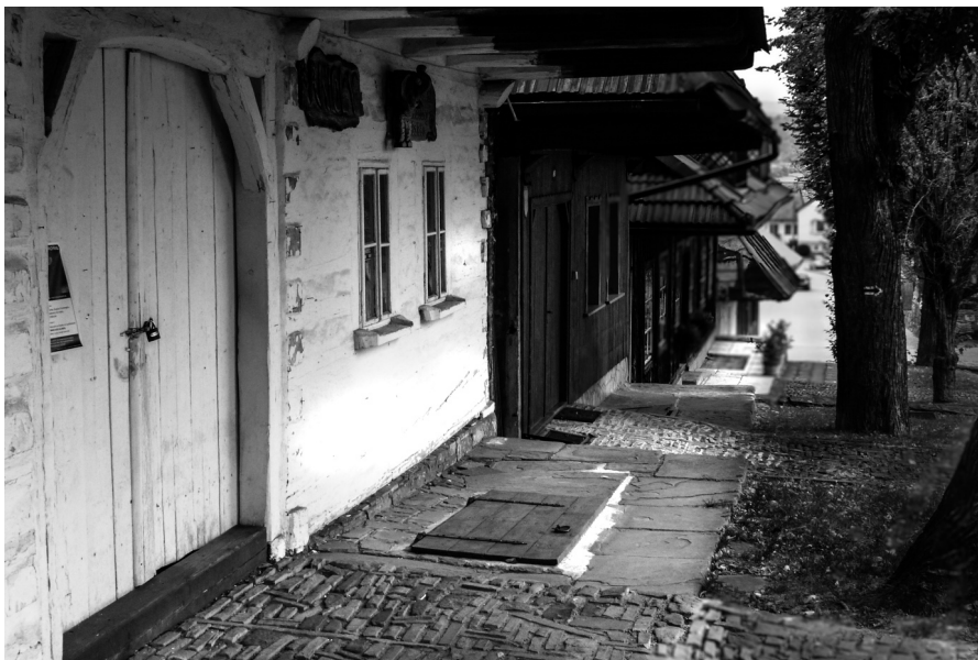
Fig. 2. The well-preserved historical buildings of Lanckorona

Other elements strongly influencing the image of a town are its main forms of use. Kalwaria Zebrzydowska, Lanckorona and Niepołomice are three towns, where forms of use were found very attractive in comparison to other towns. In the case of Kalwaria Zebrzydowska it is first and foremost its functioning as a site of pilgrimage (the monastery of the Order of St. Bernard along with its surroundings), as well as the craftsmanship and production within the town (the production of traditional furniture from Kalwaria). Lanckorona is a rather small town, but has a strong cultural role. Lanckorona provides