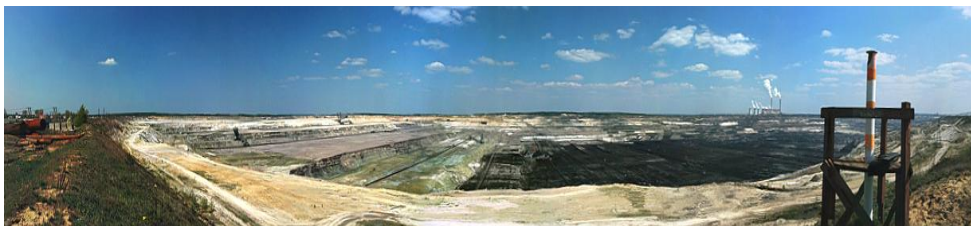
Rys.1. Odkrywka KWB „Bełchatów”- Widok od strony południowej krawędzi wyrobiska górniczego.

Obecnie eksploatowana odkrywka pola „Bełchatów”, wraz ze zwałowiskiem wewnętrznym rozciąga się na długości 11km, a jej szerokość wynosi ponad 3km. Roboty górnicze prowadzone są na 10 poziomach o wysokości 15-30metrów, a zwałowanie na 5 poziomach o wysokości 15-45m. Maksymalną głębokość eksploatacji planuje się do rzędnej 80m p.p.m. przy średniej wysokości terenu 200m n.p.m. Każdego miesiąca wydobywane jest ok. 9mln m 3 nadkładu i 3mln ton węgla. Inwentaryzacja wydobywania musi objąć ok.20km frontów roboczych wyrobiska i zwałowiska.