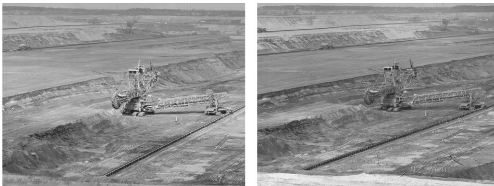
Rys.2. Fragmenty fotogramów (prawego i lewego) frontu roboczego z dn. 28.04.2004r., obejmujące obszar objęty stereogramem zdjęć naziemnych

Z uwagi na równoległy postęp frontów eksploatacyjnych ze wschodu na zachód, zdjęcia wykonywane są pod niedużym kątem do nowo wykonanych skarp roboczych. Fragmenty skarp przy zboczach stałych, trudne do sfotografowania, uzupełniane są pomiarem tachimetrycznym. Przykładowe rozmieszczenie punktów bazowych i wykonanych stereogramów przedstawiono na rysunkach 2 i 3.