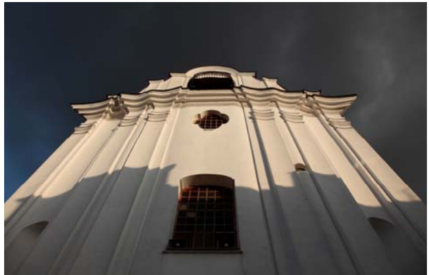
Fot. 2. Fasada kościoła opactwa w Sieciechowie.