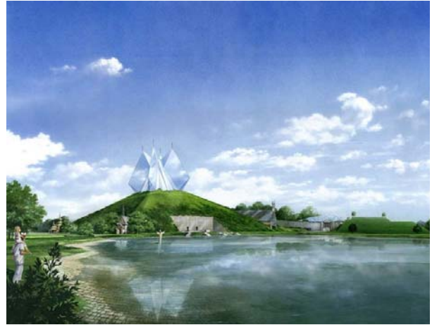
Fot. 1. Świątynia Opatrzności w Warszawie, projekt konkursowy (autor: Marek Budzyński z zespołem, akwarela Marek Ziarkoski).