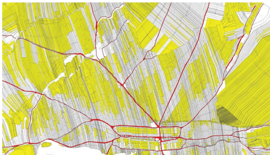
Rysunek 3. Przykład braku dostępności działek do sieci drogowej (zaznaczone kolorem żółtym). Wieś Nowa Biała, powiat nowotarski.