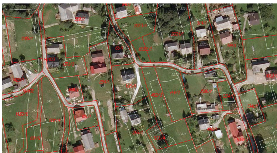
Rysunek 4. Przykład zmian układu granic ewidencyjnych, na obszarze zabudowanym, w wyniku scalenia gruntów (wieś Łętownia). Kolorem białym przedstawiono granice przed scaleniem, kolorem czerwonym – po scaleniu.