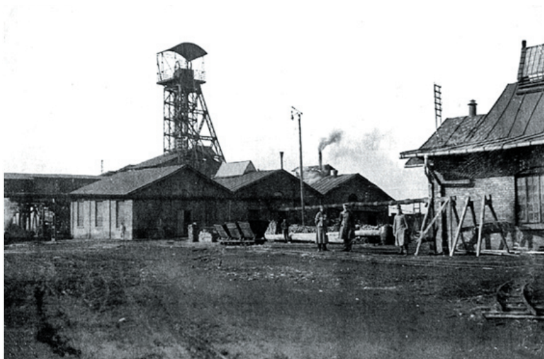
Ryc. 3. Kopalnia „Flora” – 1916 rok (ze zbiorów Muzeum Miejskiego „Szttygarka” w Dąbrowie Górniczej)

Rozwój gospodarki II Rzeczypospolitej historycy dzielą na cztery okresy (Jaros, 1969). Pod koniec pierwszego z nich (1918–1925, zwanego okresem inflacji), w wyniku wojny handlowej między Polską a Niemcami, na terenie Zagłębia Dąbrowskiego upadło bardzo dużo niewielkich kopalń (Niepielski, 1927). W okresie