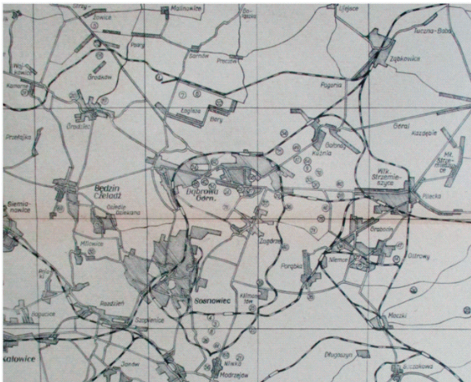
Ryc. 1. Mapa kopalń Zagłębia Dąbrowskiego lata 1919–1939 (Rippel, 1960)