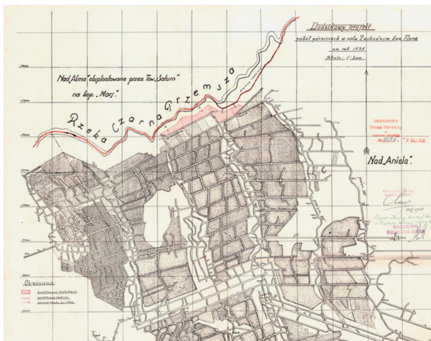
Ryc. 4. Dodatkowy projekt robót górniczych w polu Zachodnim kopalni Flora

W okresie międzywojennym i wojennym zasoby węgla kamiennego pokładów podreddenowskich, na terenie nadań górniczych należących do Towarzystwa, praktycznie wydobyto (Czarnocki, 1920, 1935; Strzeszewski, 1935). W przededniu II wojny światowej działała już tylko należąca do Towarzystwa Kopalń Węgla „Flora” S.A. kopalnia „Jan II”, będąca wcześniej jednym z ruchów kopalni „Flora” (ryc. 4).