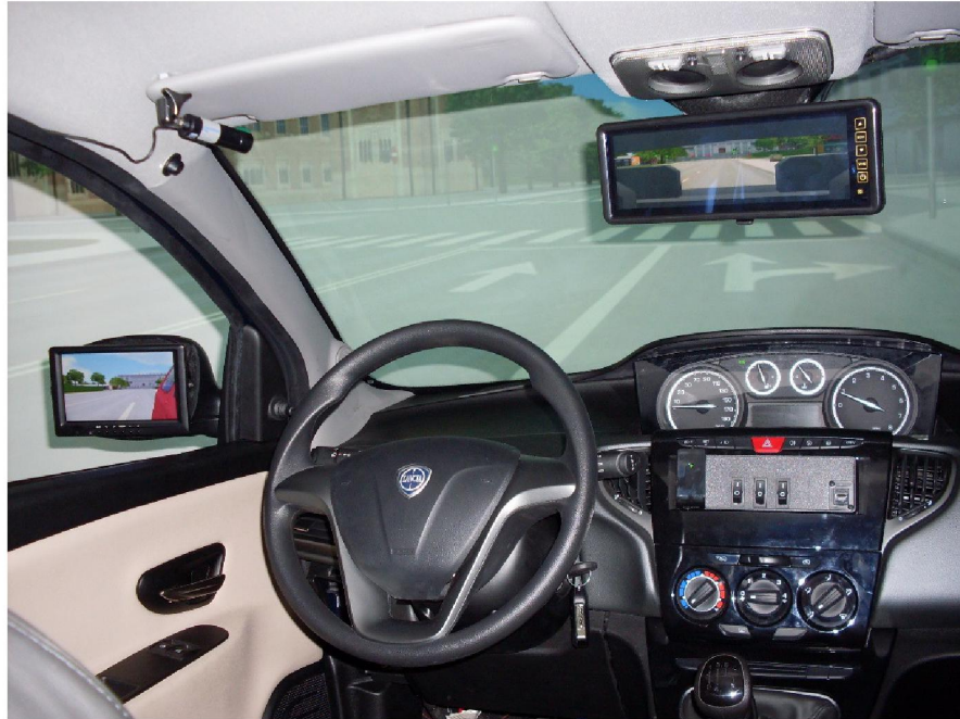
Rys. 2. Wnętrze kabiny symulatora AS 1200-6