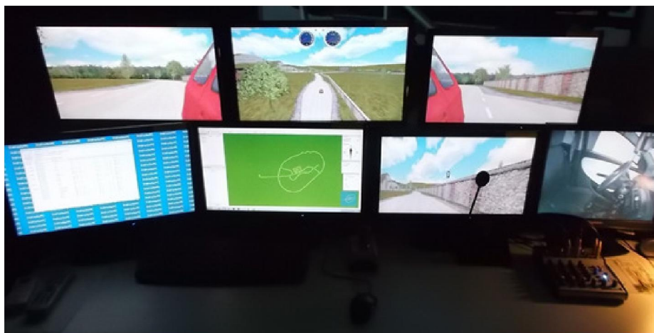
Rys. 1. Stanowisko instruktora symulacji

Za stanowisko badawcze – obiekt badań – posłużył symulator pojazdu samochodowego AS 1200-6 firmy AutoSim wraz z dedykowanym oprogramowaniem (rys. 1 i 2). Przedmiotowy symulator umożliwia tworzenie powtarzalnych i dostosowanych tras przejazdów pod względem natężenia ruchu, elementów sygnalizacyjnych, informacyjnych oraz wielu innych [3, 6]. Dzięki temu możliwe jest obiektywne sprawdzenie umiejętności kierowców z zakresu eco-drivingu – sprawdzenie, jak zazwyczaj jeżdżą pojazdami, a następnie wprowadzenie korekt w stylu jazdy i przetestowanie ponownie badanych kierowców z nowo nabytą wiedzą. Istotną zaletą omawianego zestawu jest możliwość rejestracji istotnych wirtualnych parametrów samochodu, które w sposób bezpośredni są powiązane z rzeczywistymi parametrami pojazdu osobowego. Zebrane informacje umożliwiają w prosty i przejrzysty sposób przedstawienie najistotniejszych aspektów umiejętności kierowcy w kontekście eco-drivingu, nawyków, odruchów czy zdolności psychofizycznych (np. czasu reakcji).