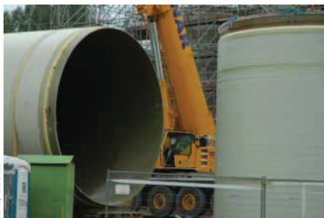
fol. Rejmurta Onitba

Dodatkowe wymagania materiałowo-konstrukcyjne mogą wystąpić w przypadku konieczności eksploatacji kominów także w trakcie awarii IOS [4, 6]. Wówczas gorące, nieodsiarczone spaliny o temperaturze około +160^{\circ}\text{C} kierowane są kanałami obejściowymi ( by-pass ) wprost do przewodów spalin w kominie. Występuje wtedy wstrząs termiczny, który może spowodować uszkodzenie konstrukcji przewodu spalin lub jego wykładziny wewnętrznej. Skutecznym sposobem rozwiązania problemu eksploatacji bloku energetycznego, w trakcie awarii IOS, może być odprowadzanie gorących spalin do dodatkowego, specjalnie do tego celu przeznaczonego, stalowego przewodu spalin zlokalizowanego wewnątrz tego samego trzonu żelbetowego. Przewód taki jest wykorzystywany tylko w stanach awaryjnych IOS. Krótkotrwały wzrost temperatury spalin występuje także w momentach uruchamiania oraz wyłączania bloku energetycznego z eksploatacji.