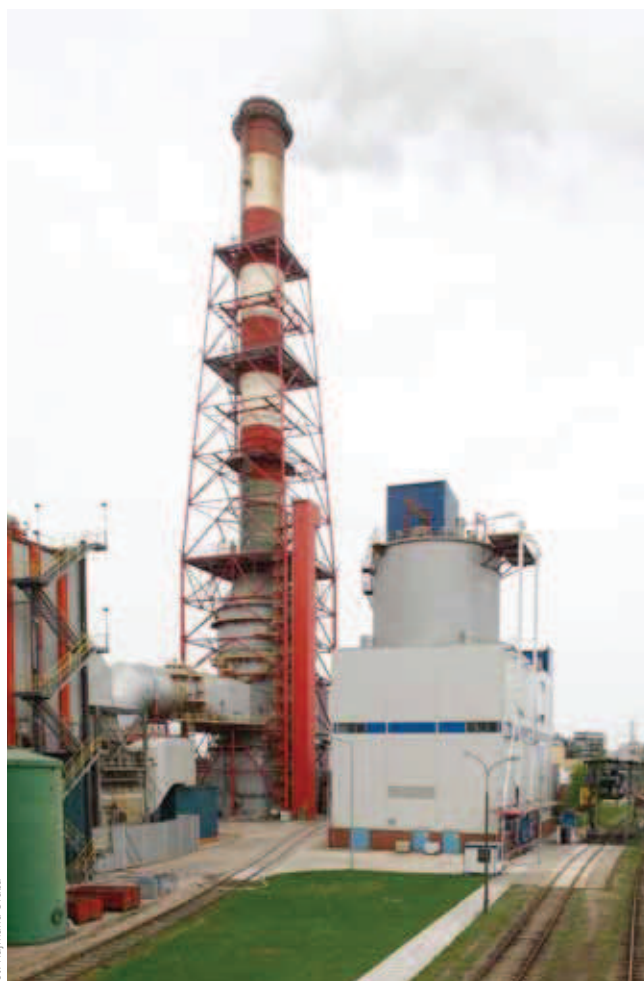
Rys. 2. Komin jedнопrzewodowy z TWS posadowiony na absorberze

Stosunkowo nowym rozwiązaniem konstrukcyjnym kominów do odprowadzania odsiarczonych spalin jest aplikowanie wykładziny z bloczków z piankowego szkła borokrzemianowego bezpośrednio na wewnętrzną