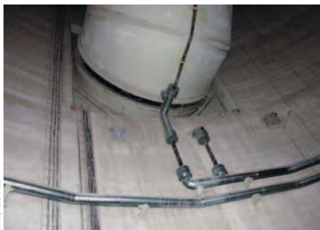
fol. Rejmurta Onitba