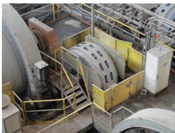
Rys. 2. Widok silnika typu SAS w otoczeniu urządzeń technologicznych

Silniki budowy otwartej są szczególnie wrażliwe na warunki środowiskowe podczas eksploatacji. Kilkudziesięcioletnia praca jednostek napędowych w tak trudnych warunkach, pomimo przeprowadzanych napraw i remontów, doprowadziła do poważnego zużycia silników. Podstawowym problemem jest utrzymywanie odpowiednich wartości stanu izolacji uzwojeń silników. Słaby stan techniczny przekłada się w wielu przypadkach na bardzo szybki spadek stanu izolacji po zatrzymaniu. Silniki w takich sytuacjach wymagają długotrwałego „suszenia”. W procesie suszenia silników wykorzystywane są różne metody: wbudowanymi grzałkami, prądem wzbudzenia, niskim napięciem 500V przyłączanym do uzwojenia stojana oraz zewnętrznymi nagrzewnicami. Konsekwencją długotrwałego suszenia izolacji silników są wydłużające się postoje młynów bębnowych i kruszarek, co negatywnie wpływa na realizację zadań produkcyjnych [7]. Pracujące silniki wyprodukowane zostały ze znamionową sprawnością rzędu 90-93%.