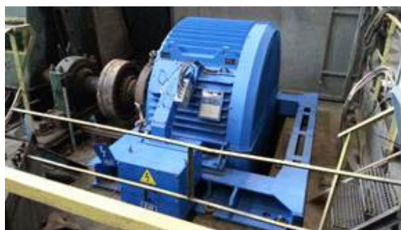
Rys. 3. Widok silnika typu SMH-1732S (1250 kW) zainstalowany na stanowisku MD-323 w Oddz. Zakłady Wzbogacania Rud Polkowice

wiązań stosowanych dotychczas przez fakt, iż nie wymagają stosowania żadnych układów wzbudzenia i układów rozruchowych. Układy zasilania takich silników są takie same jak w silnikach indukcyjnych klatkowych. Specjalna konstrukcja prętowego uzwojenia rozruchowego [10, 11] umożliwia skuteczne wykonanie rozruchu i synchronizacji, pomimo obecności strumienia wzbudzenia od magnesów trwałych.