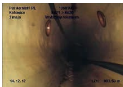
Obraz z kamery TV po instalacji kształtek kapeluszowych

Prace renowacyjne za pomocą technologii Aarsleff nie wymagały żadnych wykopów. Do renowacji użyto specjalnie zaprojektowany zestaw samochodowy, w którym znajdują się wszelkie niezbędne urządzenia do wykonania prac. W trakcie prowadzonych robót zajęto teren ok. 100 m 2 (3 x 30 m) w obrębie studni, z której wprowadzany jest rękaw. Ścieki z kanału głównego i, w razie konieczności, z przykanalików były w czasie prac renowacyjnych przepompowywane za pomocą zatapialnych pomp oraz elastycznych węży lub w przypadku większych ilości rurami PE.