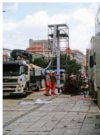
Rozpoczęcie instalacji dolnego rękawa