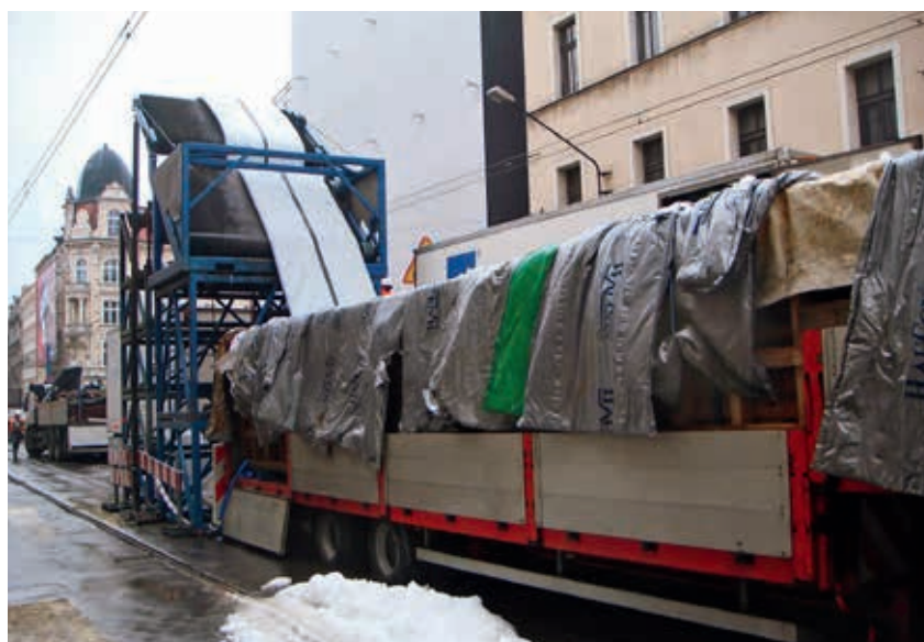
Instalacja górnego rękawa za pomocą inwersji wodnej