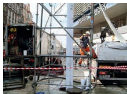
Instalacja dolnego rękawa

Przykanaliki były naprawiane w technologii długiego profilu kapeluszowego Aarsleff, a kanały główne w technologii rękawa filcowego, nasączonego żywicami poliestrowymi Aarsleff, utwardzanego termicznie. Ramy czasowe kontraktu to sierpień 2012 r. – styczeń 2013 r. Realizacja została nagrodzona statuetką Experta 2014 w kategorii bezwykopowa odnowa na konferencji No-Dig Poland 2014 .