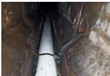
Zainstalowany dolny rękaw

widocznym na ekranie znalazły się następujące informacje: data, godzina, nazwa ulicy, numer studzienki początkowej i końcowej, średnica kanału, dystans bezpośredni od studni początkowej. Raport z wykonanej inspekcji, zawierający opis danych technicznych kanału, a także spis przyłączy do posesji z ich numerami administracyjnymi oraz zestawem zdjęć włączeń przykanalików, zarchiwizowano na płycie DVD. Inspekcja telewizyjna kanałów wraz z inwentaryzacją ich stanu technicznego została wykonana w zakresie i stopniu dokładności wymaganym do prawidłowej realizacji robót (m.in. ustalenie rodzaju i miejsca uszkodzeń, kształtu, rozmiaru, położenia i kąta włączenia przykanalików).