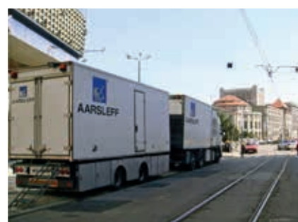
Prace przygotowawcze do instalacji dolnego rękawa