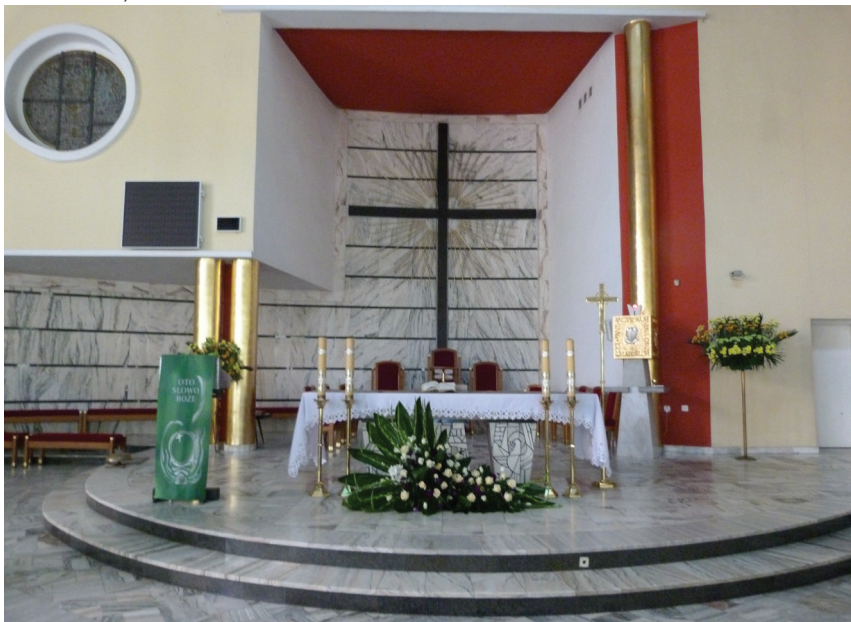
Fot. 9. Kościół Najświętszego Serca Pana Jezusa z 1957 r. w Katowicach, gruntownie przebudowany w 1999 roku (arch. arch. T. Czerwiński, J. Muszyński). Posoborowe prezbiterium prezentujące ambonę, ołtarz i tabernakulum oraz strefę przewodniczenia jako osiowe zwieńczenie układu sakralnego

ołtarza, należy do celebransa. Pięć niższych krzeseł należy do księży współcelebrujących i do służby liturgicznej. Charakterystyczne jest umiejscowienie ambony naprzeciwko jednej grupy trzech krzeseł, a pulpitu symetrycznie wobec osi głównej układu naprzeciwko drugiej grupy trzech krzeseł. To syntetyzujące scalenie strefy przewodniczenia, strefy błagania w imieniu ludu ze strefą stołu słowa Bożego jest charakterystyczne w tym wnętrzu. Umocnia ono siłę przekazu symetrii definiującej ołtarz poprzedzający zwieńczającą całość na wspólnej osi tabernakulum jako centrum kompozycyjne kościoła (fot. 5.).