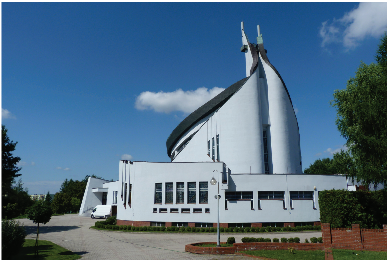
Fot. 3. Kościół Matki Bożej Częstochowskiej w Knurowie. Forma zewnętrzna świątyni jako architektoniczne zwieńczenie strefy Liturgii Eucharystii

istniejącej i projektowanej zabudowy mieszkaniowej o gabarytach od pięciu do jedenaśtu kondygnacji, następnie szkoły, nowego zespołu handlowo-usługowego, a także sąsiedztwa parku jordanowskiego [8].