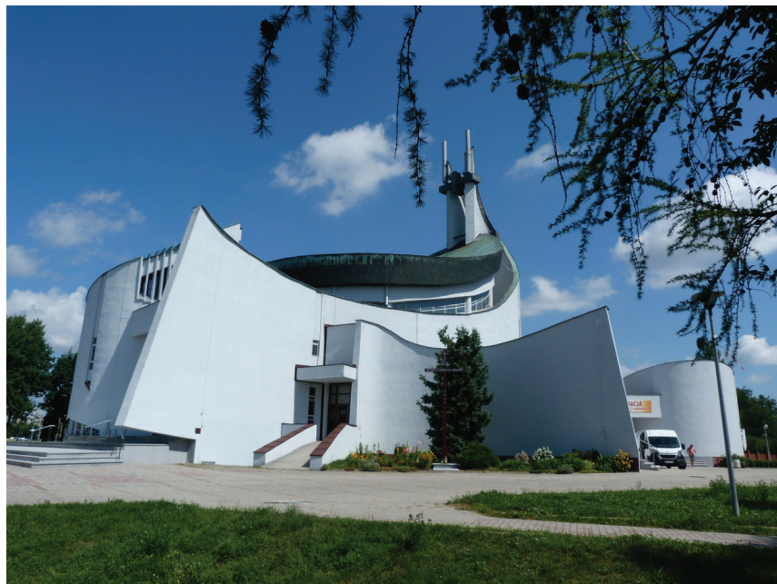
Fot. 4. Kościół Matki Bożej Częstochowskiej w Knurowie. Obraz organicznie zróżnicowanej kompozycji jako zespół kubatur współzależnych osłaniających wraz ze ścianami kurtynowymi trzon nawowy świątyni

Dotyczy to piękna architektonicznego o zewnętrznym odbiorze, odmiennym od