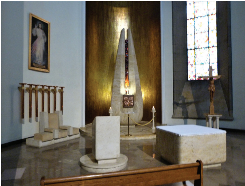
Fot. 8. Katedra Chrystusa Króla w Katowicach (architekci: Z. Gawlik, F. Mączyński, 1927–1939, 1947–1955). Kaplica kościoła tygodniowego z funkcją tabernakulum świątyni (aranżacja arch. M. Król, 1973)