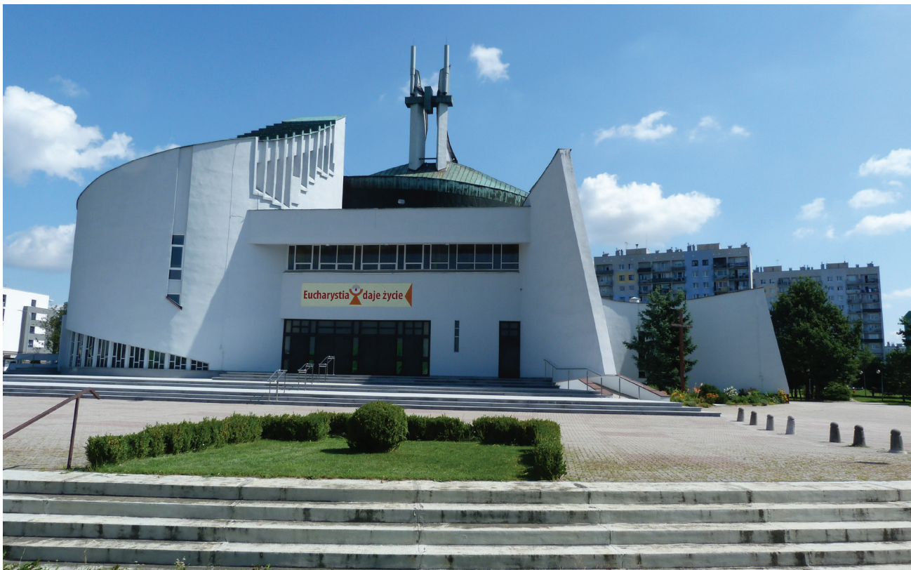
Fot. 2. Kościół w Knurowie. Elewacja wejściowa do kościoła, początek głównej osi układu prowadzącej we wnętrzu do ołtarza