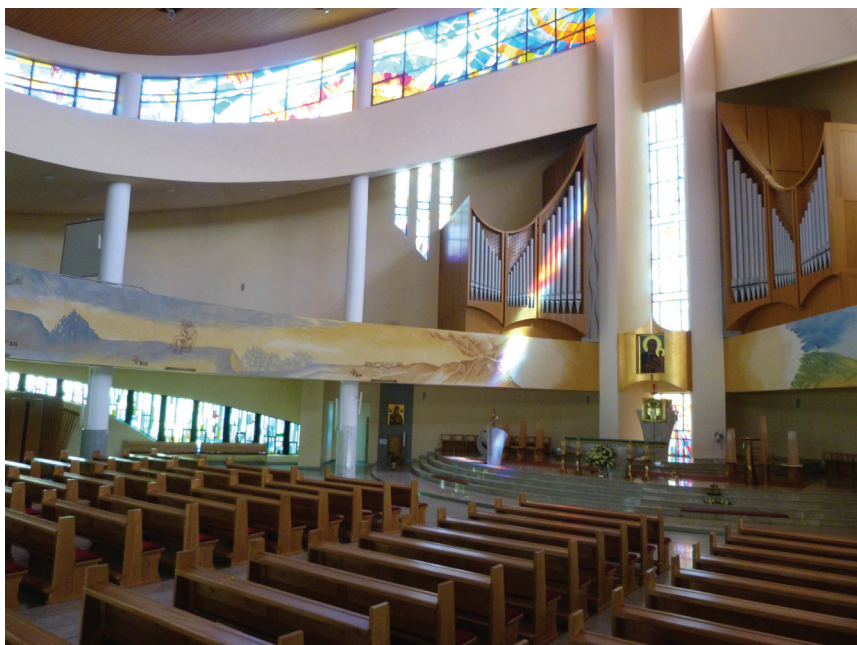
Fot. 6. Kościół Matki Bożej Częstochowskiej w Knurowie. Wnętrze ukierunkowane na strefę Liturgii Eucharystii

stanowiący autonomiczne zdylatowane struktury przestrzenne ma przekrycia o formie stropów płytowo-żebrowych [8].