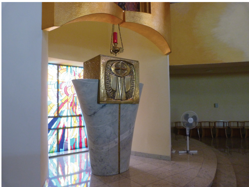
Fot. 10. Kościół Matki Bożej Częstochowskiej w Knurowie. Tabernakulum potraktowane w sposób szczególny, zamontowane w transparentnej wnęce na osiowym zwieńczeniu prezbiterium

Najświętszego Serca Pana Jezusa z 1957 r. w Katowicach, gruntownie przebudowanego w 1999 r. według projektu Tadeusza Czerwińskiego i Jana Muszyńskiego, podkreślająca obecność miejsca przewodniczenia zgromadzenia liturgicznego, sedilia, na zakończeniu głównej osi układu sakralnego (fot. 9).