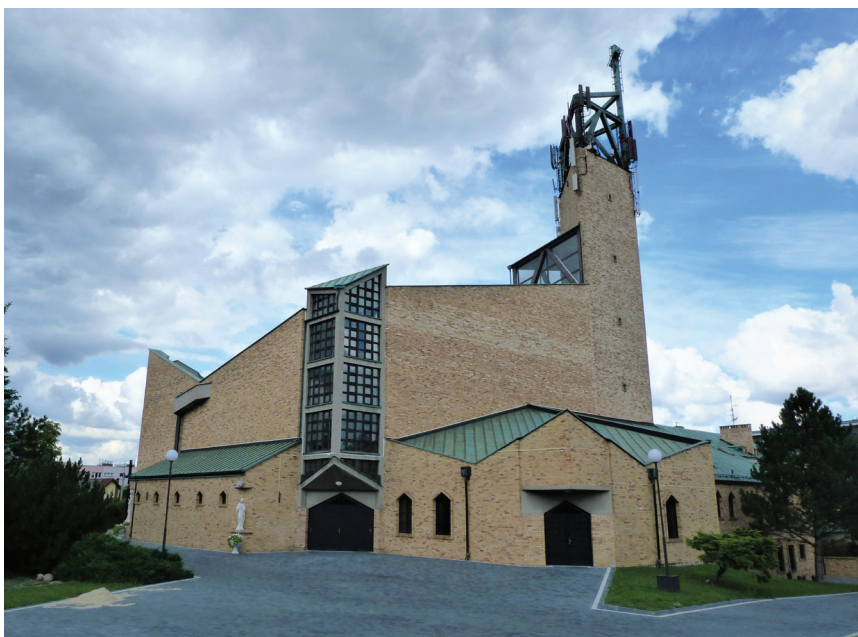
Fot. 1. Kościół św. Anny w Gliwicach (1984–1990). Elewacja boczna świątyni prezentująca wysokościowe narastanie formy, aby zbudować architektoniczne dzwonicowe zwieńczenie strefy Liturgii Eucharystii, oświetlonej wertykalnie światłem dziennym

Autor niniejszego artykułu odnajduje w podobnym zabiegu formalnym podkreślenie rangi potrydenckiego umiejscowienia tabernakulum, gdy przewyższając menşe ołtarza głównego, stanowiło ono zwieńczenie prezbiterium. Służyło to i służy zawsze aktualnej funkcji jego eksponowania oraz uhonorowania jako obiektu widocznego z największej części wnętrza kościoła. Szafka przechowująca Komunię Świętą, stanowiąca kompozycyjne zwieńczenie układu sakralnego, a tak się dzieje w Knurowie, dotyczy tymczasem dopiero trzeciego, niewuwzględnionego