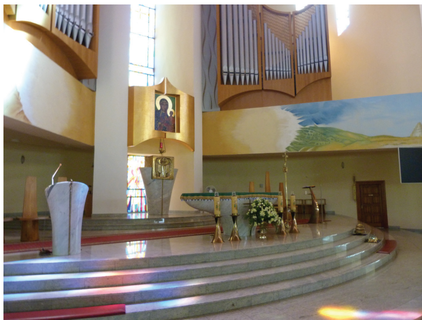
Fot. 5. Kościół Matki Bożej Częstochowskiej w Knurowie. Ołtarz i tabernakulum, zwieńczenie prezbiterium, gdzie zastosowany materiał konstrukcyjny dla obiektów liturgicznych łącznie z amboną buduje koncentryczność układu

stabilizacji historycznych układów bazylikowych i halowych. Cała kompozycja kościoła jest strukturalnie płynna i falista. Ekspozycja detalu architektonicznego powiązanego z transparentą ścianą nie zagłusza w tym układzie znaczenia przegród zewnętrznych jako kurtyń, których układ tworzy kompozycję przestrzenną. Podkreśla ją nawowy trzon kościoła kompozycyjnie osłaniany przez kurtynowy układ ścian zewnętrznych kubatur współzależnych (fot. 4.).