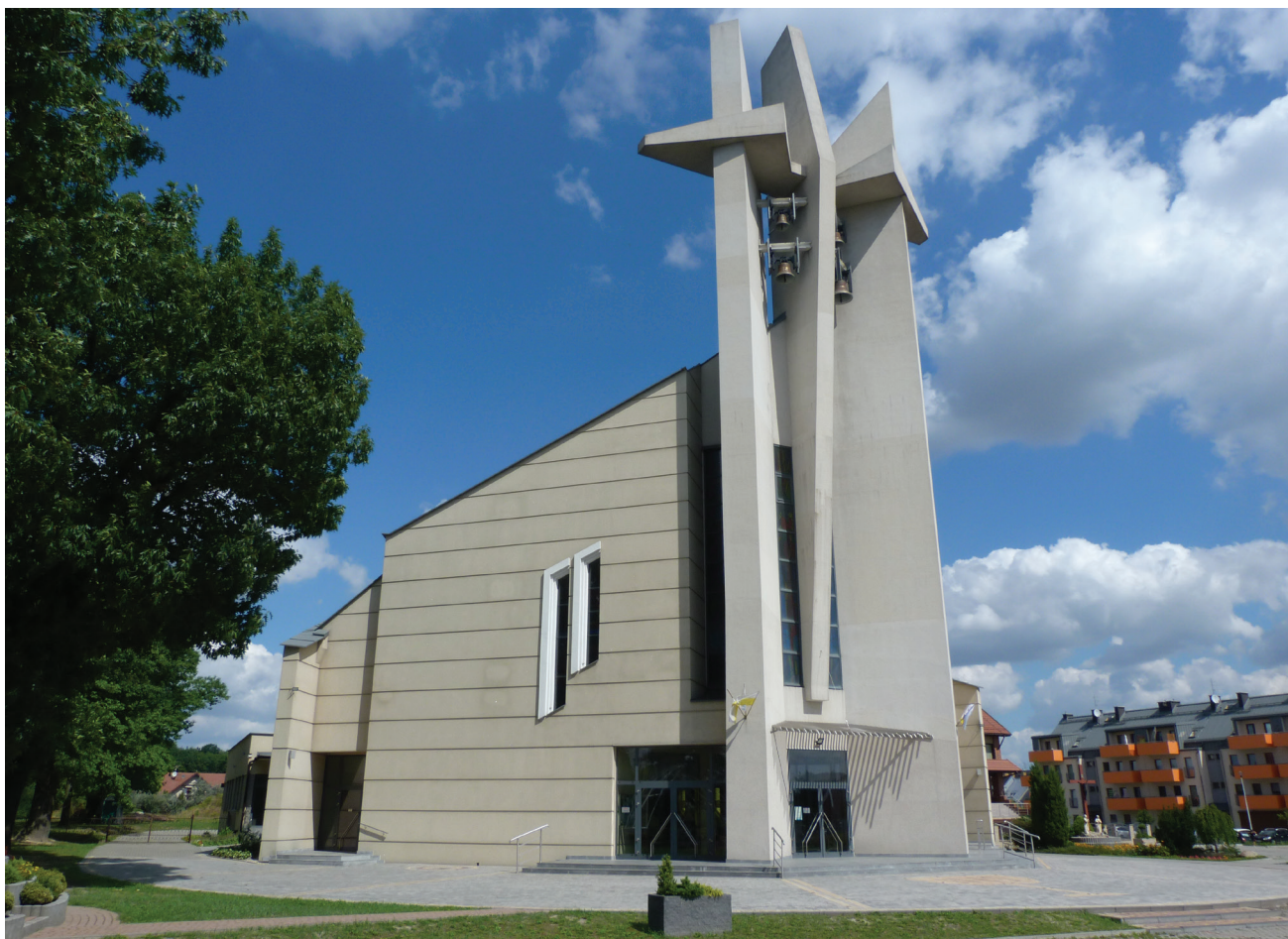
Fot. 7. Kościół Miłosierdzia Bożego w Gliwicach. Fasada wejściowa jako dominanta kompozycyjna układu sakralnego

W przypadku wnętrz posoborowych trzy obowiązkowe obiekty zapewniają liturgiczną funkcję strefy Liturgii Eucharystii. Są to: ołtarz stanowiący uprzywilejowane miejsce w kompozycji wnętrza (stół ciała i krwi Pańskiej), ambona (stół słowa Bożego) oraz miejsce przewodniczenia – miejsce błagania w imieniu ludu (sedilia) [12]. Właśnie ono w knurowskim kościele reprezentuje sześć krzesel zgrupowanych po trzy na zasadzie dwustronnego flankowania osi głównej układu. Jedno z nich, przewyższające oparciem inne, krzesło środkowe w grupie zorganizowanej na prawo wobec tabernakulum, odnajdywanej tak przy czołowym oglądzie