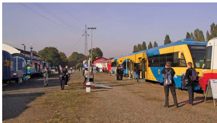
VI TRAKO Gdańsk październik 2005 r. – wystawa taboru na terenie stacji Gdańsk Oliwa