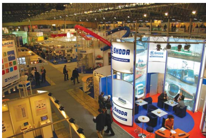
VII TRAKO Gdańsk październik 2007 r., stoiska targowe w hali MTG

ulicy Tadeusza Wendy 7/9. Tabor kolejowy natomiast został wystawiony na jednym z torów stacji wówczas jeszcze posiadającej nazwę Gdynia Główna Osobowa. Na I Międzynarodowej Konwencji TRAKO wystawiły się 103 firmy krajowe i zagraniczne.