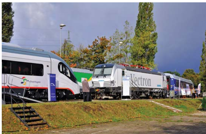
IX TRAKO Gdańsk październik 2011 r. – wystawa taboru