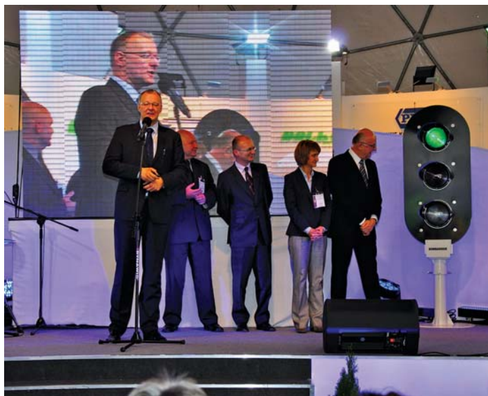
IX TRAKO Gdańsk październik 2011 r. – uroczystość otwarcia targów TRAKO

Podobnie jak w Gdyni początkowo teren wystawienniczy MTG w Gdańsku przy ul. Beniowskiego nie miał bocznic kolejowej, umożliwiającej zorganizowanie wystawy taboru. Problem ten rozwiązano przystosowując miejsca ekspozycyjne na terenie nieczynnej tawolnicy publicznej na stacji kolejowej Gdańsk Oliwa. Osoby odwiedzające targi mogły korzystać ze specjalnej targowej linii autobusowej, kursującej między terenem MTG a wystawą taboru. Taki stan utrzymywał się do 2007 r. Wówczas to prezentacja taboru zorganizowana została w dwóch miejscach – trady-