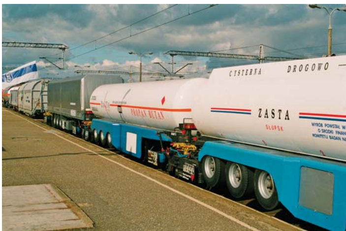
I TRAKO Gdynia październik 1996 r., wystawa taboru na stacji Gdynia Gł – zestaw bimodalny

Pierwsza Międzynarodowa Konwencja Kolei TRAKO zorganizowana zostaje przez WTC Expo Gdynia w dniach 1–4 października 1996 r. W trakcie trwania konwencji zorganizowano sympozjum podczas którego analizowano tematykę przewozów kombinowanych, prezentowano usługi transportowe oraz techniki transportowe. Wygłoszono między innymi referaty Polskie Koleje Państwowe na rynku transportowym , Region Gdański w europejskim systemie transportowym oraz przedstawiono osiągnięcia restrukturyzacji szwedzkich kolei SJ. Obradom konwencji towarzyszyła wystawa firm działających na rynku transportu kolejowego, która zorganizowana została w halach WTC Expo w Gdyni przy