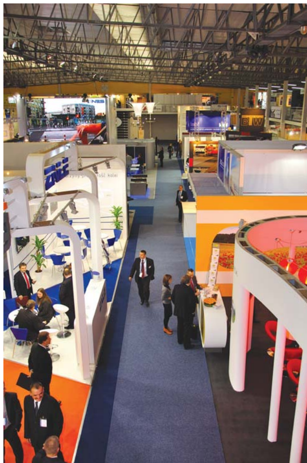
IX TRAKO październik 2011 r.