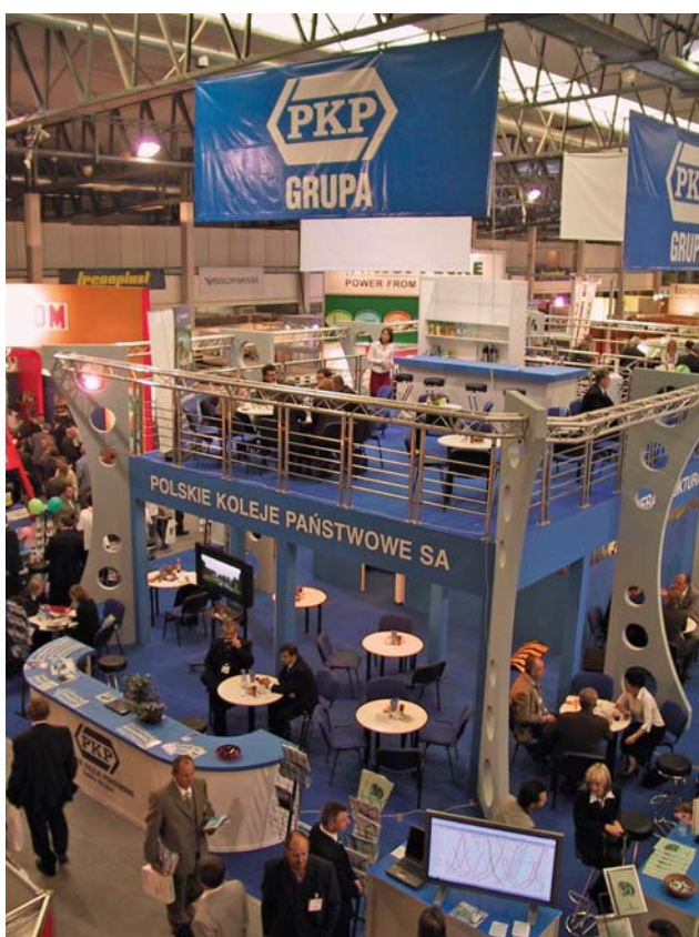
VI TRAKO Gdańsk październik 2005 r. – stoisko Grupy PKP S.A.