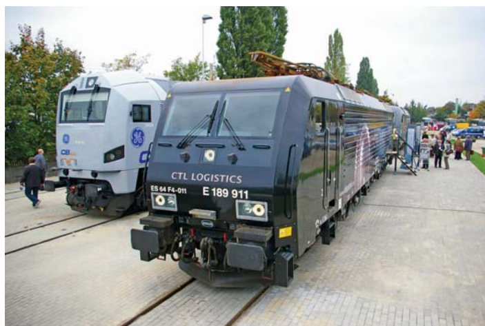
VII TRAKO Gdańsk październik 2007 r. – wystawa taboru