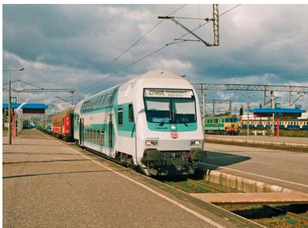
I TRAKO Gdynia październik 1996 r., wystawa taboru na stacji Gdynia Gł – wagon sterowniczy piętrowy produkcji DWA Gorlitz