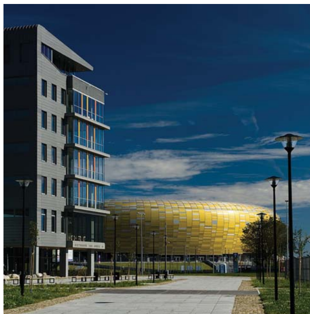
Centrum Wystawienniczo-Kongresowe AmberExpo

kowych torach, o łącznej długości 1000 m, będzie zlokalizowana ekspozycja taborowa TRAKO 2013.