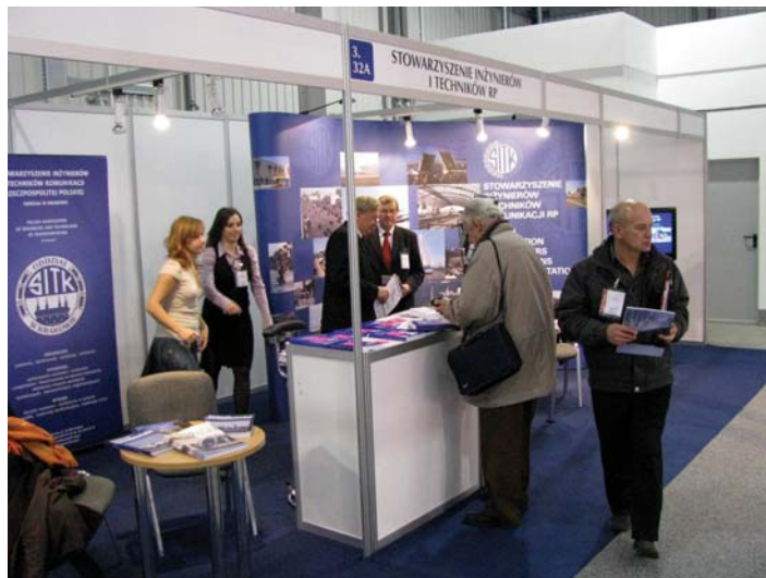
Wspólna ekspozycja SITK RP i miesięcznika Technika Transportu Szynowego na TRAKO 2009

Centrum AmberExpo ma dostęp także do przystanku osobowego SKM Gdańsk Stadion Expo. Przy tym peronie i na 4 dodat-