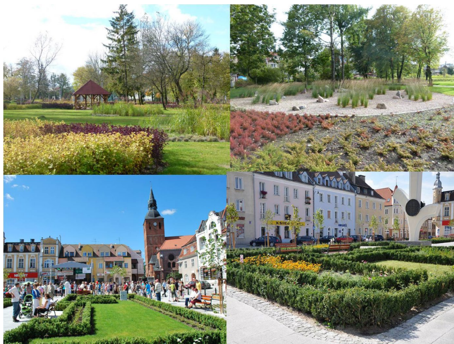
Fig. 4. The municipal park and the restored Wolności Square in Biskupiec (author of projects Agnieszka Jaszczak)

The members of the International Cittaslow Network prepare individual development plans which are based on the movement's general aims and objectives, including the prevention of degradation processes and the use of cultural, natural, social and economic resources for improving the local quality of life. The network's general objectives, namely the improvement of quality of life and promotion of sustainable development, can only be achieved through the implementation of local actions. In line with the movement's policy requirements, every region-town works individually and accord-