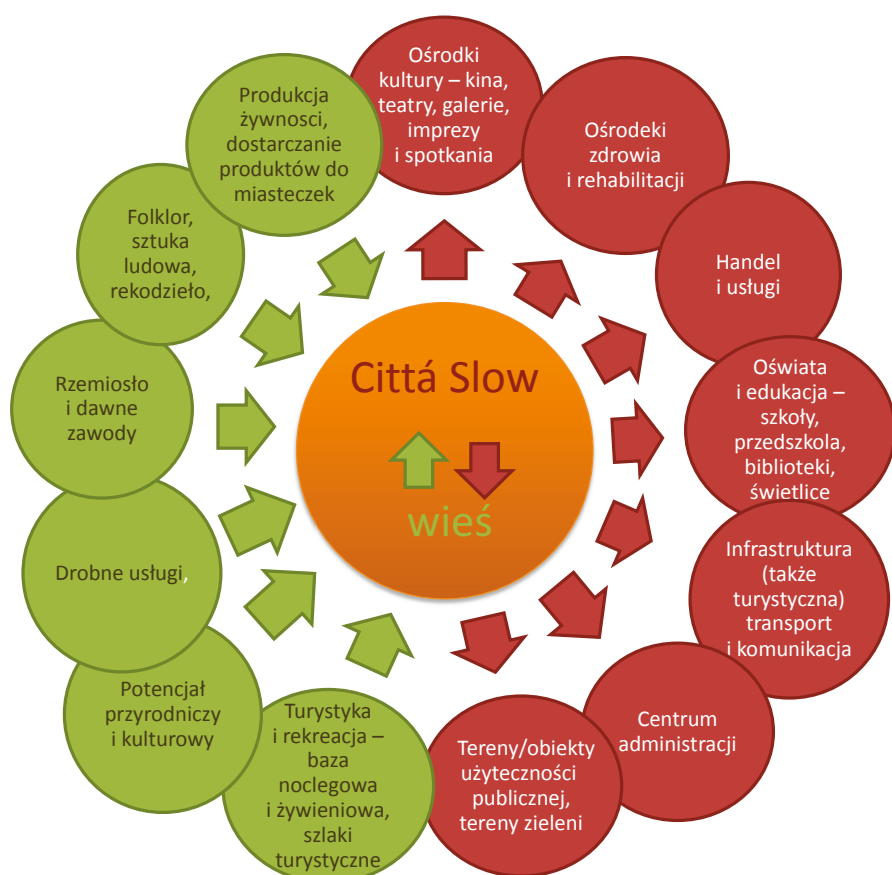
Fig. 6. Schemat zależności Cittaslow – wieś (rys. A. Jaszczak)

d) Miasta Cittaslow są wzorcem dla aglomeracji, np. miejskie inicjatywy slow life , slow food , urban agriculture . Zaangażowanie w kwestii poprawy jakości życia przenosi się na pojawiający się w dużych miastach trend „życia spokojnego”, bez pośpiechu i w zgodzie z naturą. Pojawiają się inicjatywy dostrzegające korzyści życia w małych miastach i w części wzorujące się na kulturze, produktach rzemieślniczych