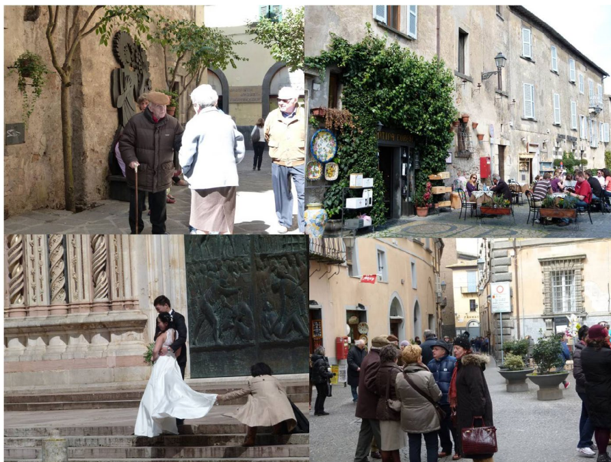
Ryc. 2. Cittaslow „dla ludzi”. Orvieto, Włochy

sibility for their surroundings. The anticipated results can be achieved only through a community-driven approach.