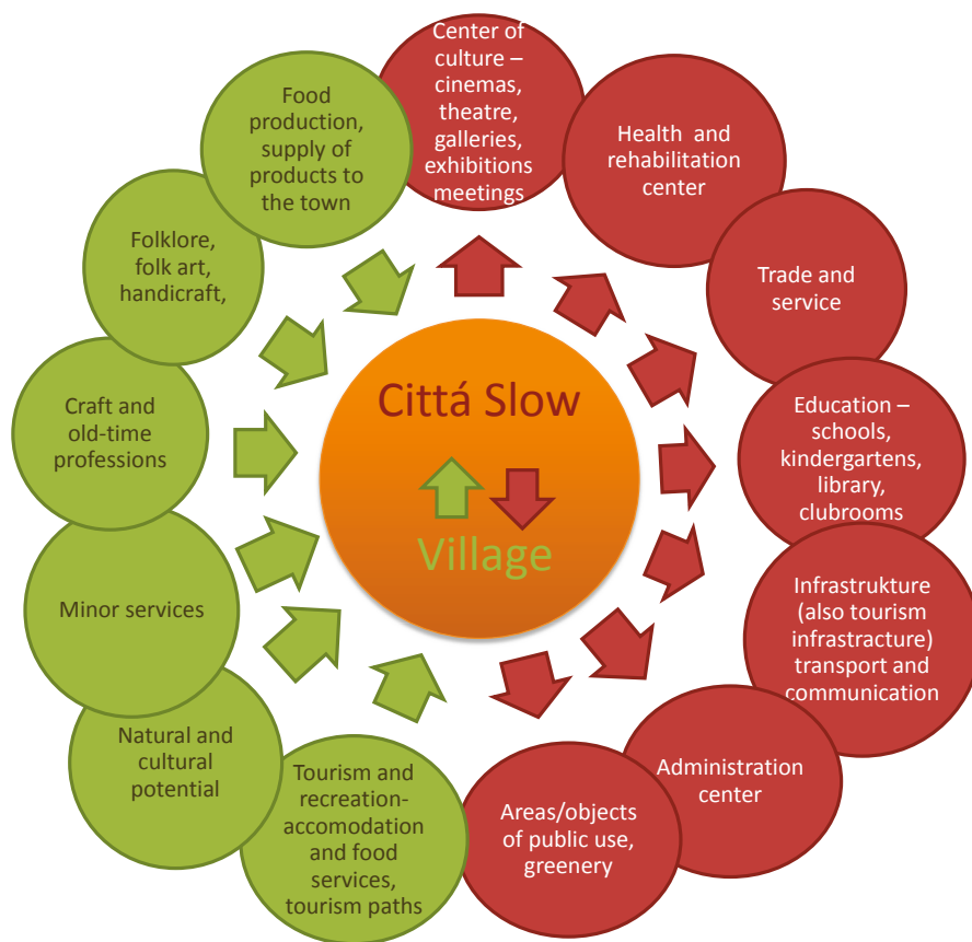
Fig. 6. Diagram of correlations between Cittaslow towns and rural areas (A. Jaszczak)

c) Cittaslow towns offer an alternative to large-scale urban development as recreational areas. Seasonal and year-round housing can be adapted to the needs of visitors from large urban areas. This goal requires new programs for improving the local infrastruc-