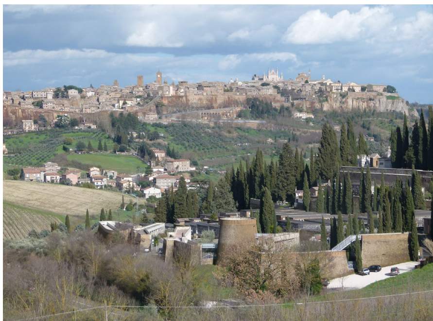
Fig. 1. Orvieto – headquarters of the Cittaslow International Network

Od początku głównym jego celem było podniesienie jakości życia mieszkańców poprzez promowanie zdrowia, produktów regionalnych i kuchni, ochronę wartości przyrodniczych i kulturowych, poszanowanie tradycji oraz alternatywne, przeciwstawne globalnym formy rozwoju [Mayer, Knox 2006, Knox, Mayer 2009]. Szczególne znaczenie przypisano w nim przestrzeniom pu-