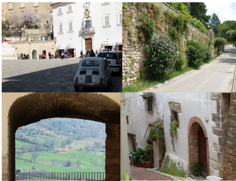
Fig. 3. Urban space in a small town – San Gemini, Umbria, Italy

Z kolei stosunkowo niedawno przyjęte do stowarzyszenia miasta tureckie (pierwsze miasto Seferihisar dołączyło do sieci w 2009 r.) zloka-