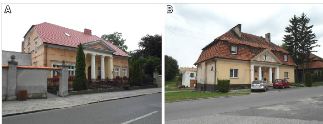
Ryc. 8. Inne przykłady zastosowania „stylu dworkowego” w latach 1918-1939: A – plebania w Środzie Wilkp., B – ochronka w Winnej Górze

Późniejsze konkursy, których celem było poszukiwanie formy dla budynków użyteczności publicznej (Ryc. 8), podkreślały możliwości aplikacyjne formy dworu do różnorodnych potrzeb i funkcji 13 . Powstająca wówczas zabudowa określana z dzisiejszej per-