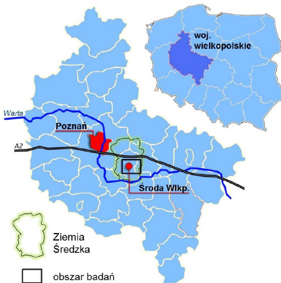
Ryc. 1. Lokalizacja Ziemi Średzkiej i obszaru badań (oprac. własne)

obiekty z portykiem kolumnowym 2 powszechnie uznawanym za wyróżnik „dworu”. W kolejnym etapie rozpoznano przemiany w projektowaniu siedzib ziemiańskich na tle poszukiwań stylu narodowego oraz stopniowe wykształcanie się „stylu dworkowego”.