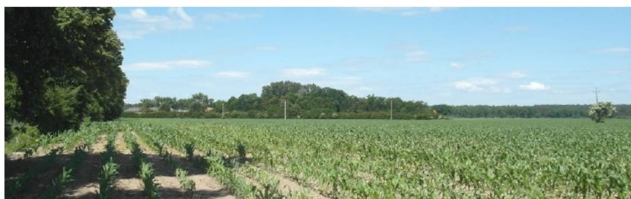
Ryc. 3. Ekspozycja widokowa zespołu dworskiego w Kopaszycach

spójność przestrzenną zespołu 5 . Choć dwór stanowił centralny punkt majątku ziemskiego, to jego egzystencja uzależniona była od pozostałych elementów kompozycji. Słusznie zatem, od wielu lat, podkreślana jest przez badaczy konieczność rozpoznania i ochrony siedziby ziemiańskiej w kontekście całego zespołu dworskiego. Odrębność w krajobrazie i czytelna zwartość zespołów wynikała z gospodarczej i funkcjonalnej samowystarczalności co pozwala na nazywanie ich „mikroświatami” 6 (Kodym-Kozaczko, 2006: 219-220). Taką nazwę uzasadnia też ich szczególna ekspozycja w przestrzeni wiejskiej, co w przypadku obszaru badań zapewniają płaskie, pozbawione zieleni szerokie przedpola widokowe – płaszczyzny pól akcentowane zespołami zieleni parkowej (Ryc. 3). Trzeba też podkreślić, że same bryły siedzib ziemiańskich, skromnych w formie, nie są szczególnie eksponowane, a często nawet niewidoczne w krajobrazie.