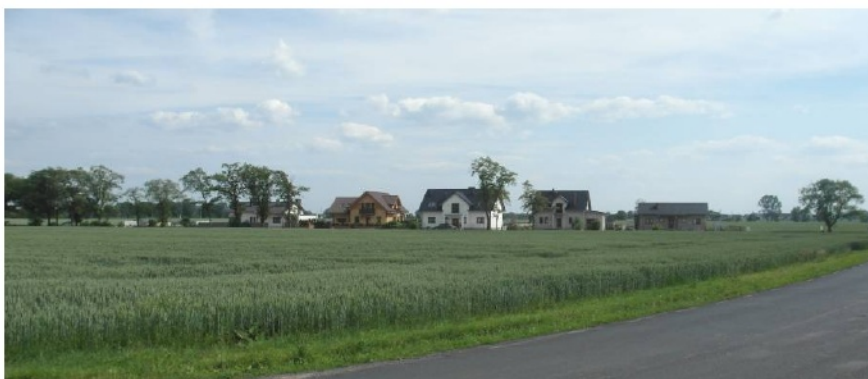
Ryc. 12. Współczesna zabudowa powstająca wzdłuż alei pałacowej w Dębiczu. Widoczne postępujące wraz z zabudową wypady drzew w układzie alejowym

Współczesna zabudowa w „stylu dworkowym” koncentruje się głównie na obszarach cennych krajobrazowo (nad Jeziorem Średzkim), silnie urbanizujących się (Dominowo, siedziba gminy) oraz w miejscowościach, w których zlokalizowane są wysokiej klasy ar-