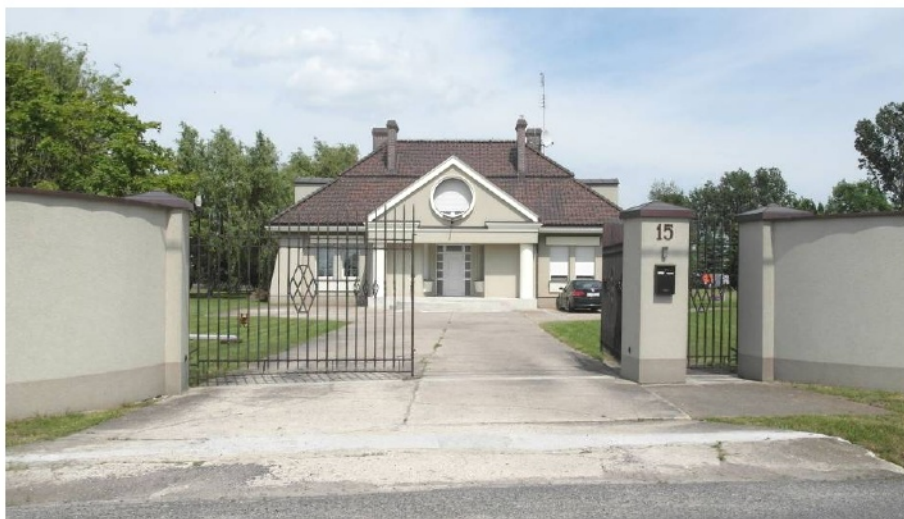
Ryc. 13. Dom mieszkalny w „stylu dworkowym”