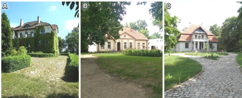
Ryc. 4. Dwory z początku XX wieku: A – Kopaszycy, B – Rusibórz, C – Ulejno

łowy XVIII wieku 8 (Jaroszewski, 1993: 31-33). Odnalazło to swój wyraz w ogłaszanych na początku XX wieku konkursach na dwór 9 a zwłaszcza w konkursie na dwór w Niegowici 10 . Trudno stwierdzić, czy miejscowe środowisko ziemiańskie było świadome tych narastających trendów. Na analizowanym fragmencie Ziemi Średzkiej pojawiły się trzy dwory, które operują klasycystycznym detalem w sposób powierzchowny. Są to: przebudowany w 1905 roku dwór w Kopaszycach, dwór w Rusiborzu z 1905 roku i wybudowany w roku 1910 dwór w Ulejnie (Ryc. 4).