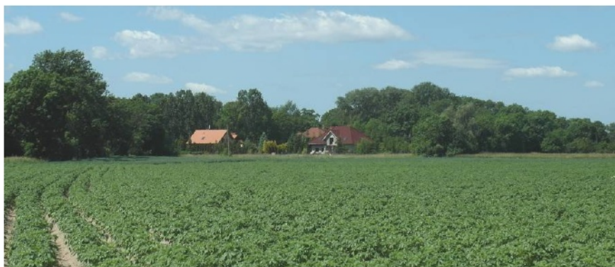
Ryc. 11. Zabudowa w „stylu dworkowym” powstająca na przedpolu widokowym zespołu dworskiego w Koszutach

„dworu polskiego” 25 . Wzmagają go również działania licznych pracowni świadczących usługi w zakresie wykonywania projektów domów typowych, określanymi mianem „dworów” czy „dworków”. Rezultatem jest ożywienie „stylu dworkowego”, który stał się narzędziem do zaznaczania statusu materialnego inwestora, a nawet środkiem realizacji aspiracji społecznych. „Dwory” te najczęściej nawiązują do barokowych i klasycystycznych form siedziby ziemiańskiej, w które wpisana została współczesna funkcja mieszkalna. Wspólnym mianownikiem tej zabudowy jest brak ładu architektonicznego, błędne zrozumienie zasad proporcji, dowolne korzystanie z detalu architektonicznego oraz brak kontekstu krajobrazowego. Potwierdzają to wyniki badań terenowych przeprowadzonych w rejonie Środy Wielkopolskiej (tab. 1).