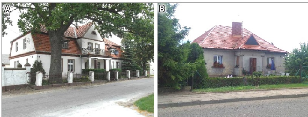
Ryc. 7. Zastosowanie „stylu dworkowego” w zabudowie mieszkalnej w okresie międzywojennym: A – dom w Brzeziu, B – dom mieszkalny tzw. poniatówka w Koszutach

Po odzyskaniu niepodległości, podobnie jak miało to miejsce po różnego rodzaju kłóskach wojennych, to właśnie „klasyczny” model dworu stał się najlepszą propozycją, która umożliwiała najszybszą odbudowę ludzkich siedzib (Leśniakowska, 1992: 59). Wyniki przeprowadzonych już wcześniej konkursów na dwór potwierdzały przydatność jego formy dla budownictwa mieszkalnego (Rozbicka, 2003: 35), w tym zabudowy podmiejskiej, willowej i wiejskiej (Ryc. 7).