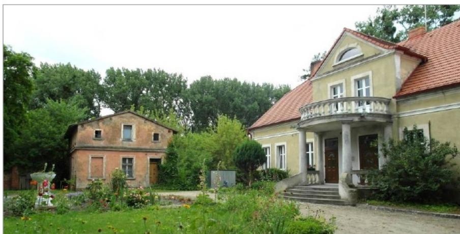
Ryc. 9. Dwór w Bagrowie, lata 20. XX wieku. Na fotografii widoczny fragment podjazdu; w tle oficyna

Ziemiaństwo, zniszczone ekonomicznie przez I wojnę światową, borykające się z kryzysem gospodarki rolnej i skutkami ówczesnych przemian politycznych, nie było w stanie podjąć przedsięwzięć budowlanych na tak wielką skalę jak przed wojną. Obszar Wielkopolski uległ relatywnie najmniejszym zniszczeniom (Rozbicka, 2003: 41, 54), stąd nieliczne przebudowy siedzib ziemiańskich, także na obszarze badań. Wyjątkiem jest gruntowna przebudowa pałacu w Połazejewie w stylu eklektycznym z elementami klasycystycznymi. W zmienionych uwarunkowaniach politycznych i społecznych, pozycja ziemiaństwa uległa znaczącemu spadkowi 15 . Formy szlacheckiego dworu stały się „bezradne” wobec funkcjonalnych i społecznych zadań dwudziestolecia międzywojennego, czego konsekwencją było coraz częstsze zrównywanie ich z wielkością i standardami innych budynków mieszkalnych (Rozbicka, 2003: 37–39). „Styl dworowy” redukował układ przestrzenny „dworu” do mieszkania, często już nie ziemianina, lecz przemysłowca czy bankiera. Zmianie ulegał kontekst krajobrazowy nowych siedzib, m.in. poprzez zmniejszający się areal założenia parkowego. Nadal jednak obowiązkowym elementem programu przestrzennego był podjazd 16 . Przykładem jest dwór w Bagrowie ukształtowany na wzór podmiejskiej willei (Ryc. 9).