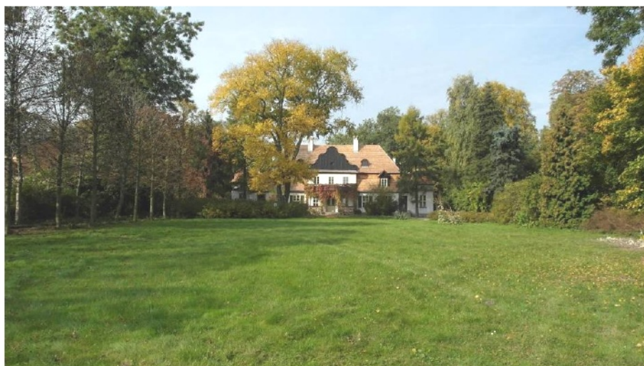
Ryc. 10. Dwór w Koszutach, poł. XVIII wieku

W końcu lat 80. XX wieku znacząco wzrosło, zauważalne już dekadę wcześniej, zainteresowanie problemem badawczym dworu na polu zarówno historii 21 , historii sztuki i architektury 22 oraz architektury krajobrazu 23 . Zaowocowało to z jednej strony stopniową ochroną i konserwacją zabytkowej substancji (architektonicznej i ogrodowej), a z drugiej zapoczątkowało współczesne realizacje domów mieszkalnych (niewielkich i dużych rezydencji) w „stylu dworowym” 24 . Trafnym wydaje się stwierdzenie, że ta fascynacja „polskim dworem” jako wzorcem architektonicznym wyrasta z fali odwrotu od „socjalistycznego modernizmu” (Leśniakowska, 1992: 60-61) i tęsknoty za tradycyjnym kształtem domu mieszkalnego. Na zjawisko to nałożył się coraz silniej docierający do Polski nurt postmodernizmu w wersji historyzującej, który pobudził wyobraźnię architektów projektujących domy jednorodzinne i nieliczne jeszcze rezydencje dla ówczesnej warstwy nouveaux riches potrzebujących niewątpliwie legitymizacji swego sukcesu ekonomicznego.