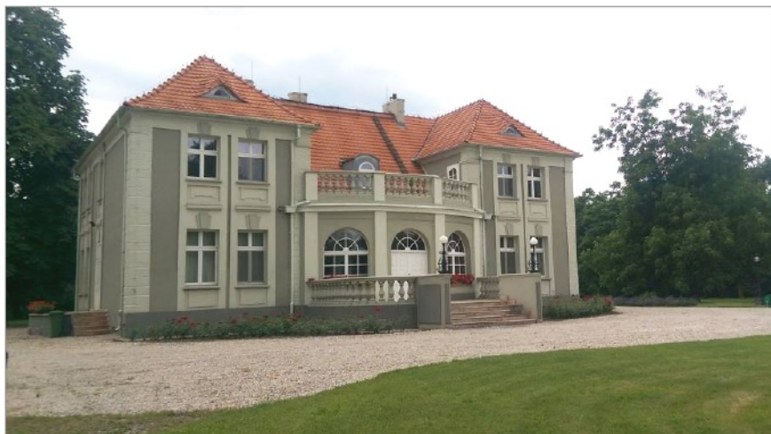
Ryc. 5. Dwór w Krerowie, arch. Roger Sławski, rozbudowa w roku 1908

są dwory w Krerowie (Ryc. 5) i Winnej Górze (Ryc. 6), gdzie architekci nie odwoływali się do naukowej wiedzy o przeszłości, ale do wyobrażenia o niej 12 .