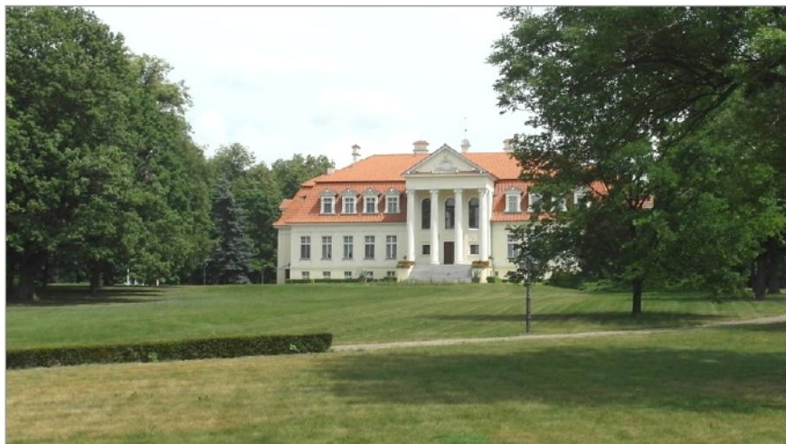
Ryc. 6. Dwór w Winnej Górze, arch. Stanisław Borecki, 1910

Mimo tych sprzeczności był to świadomy kierunek podejmowany przez ziemiaństwo polegający na łączeniu danej formy stylowej z określonymi rodowymi czy narodowymi treściami, które zawarto w tych nowych siedzibach (Skuratowicz, 1992: 128-129).