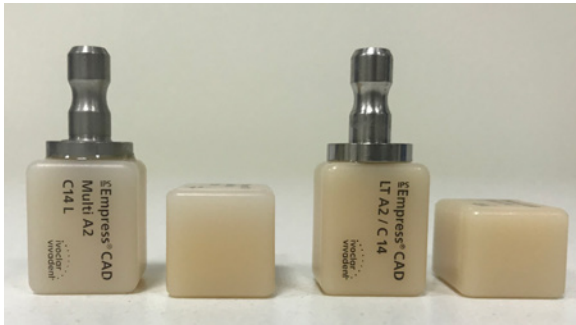
Fot. 2 Bloczki ceramiczne IPS Empress CAD. Od lewej Multi, LT

Wyfrezowane uzupełnienia stomatologiczne poddawane są procesowi polerowania lub indywidualnemu procesowi charakteryzacji z zastosowaniem specjalnych farbek do porcelany IPS Empress Universal Stains/Shade i glazurowania IPS Empress Universal Glaze Paste. Gotowe uzupełnienie jest cementowane w ustach pacjenta z zastosowaniem cementów adhezyjnych [17, 18].