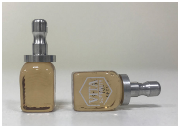
Fot. 4 Bloczek ceramiczny VITA Suprinity