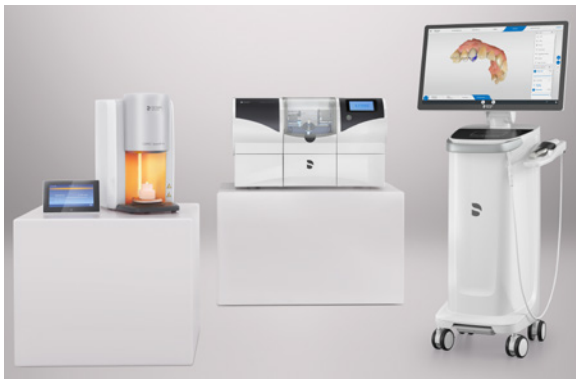
Fot. 1 Elementy systemu CEREC; źródło: materiały reklamowe firmy Sirona Źródło: www.sirona.com .