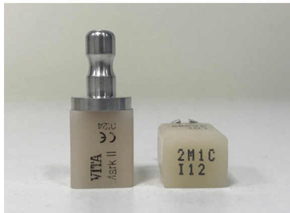
Fot. 5 Bloczek ceramiczny VITA Mark II