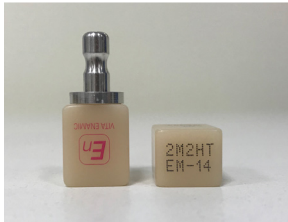
Fot. 7 Bloczek ceramiczny VITA Enamic