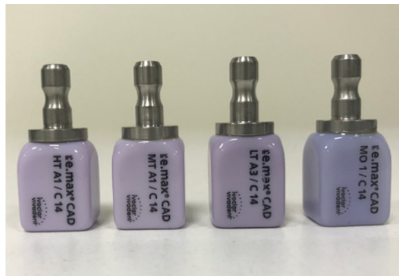
Fot. 3 Bloczki ceramiczne IPS e.max. Od lewej HT, MT, LT, MO

Podobnie jak w przypadku ceramiki wzmacnianej leucytem – wyfrezowane uzupełnienia protetyczne po krystalizacji poddawane są procesowi polerowania lub indywidualnej charakteryzacji farbami IPS e.max CAD Shades/Stains lub glazurowaniu IPS e.max CAD Glaze. Gotowe uzupełnienie jest cementowane w ustach pacjenta z zastosowaniem cementów adhezyjnych.