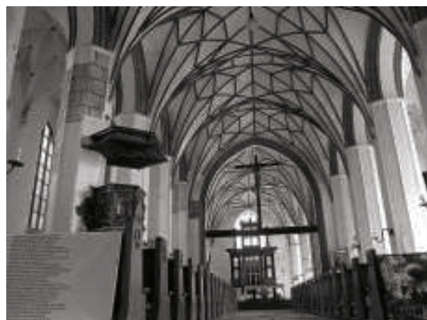
Ryc.4. Kościół św. Katarzyny Fig. 4. St. Katherine's Church