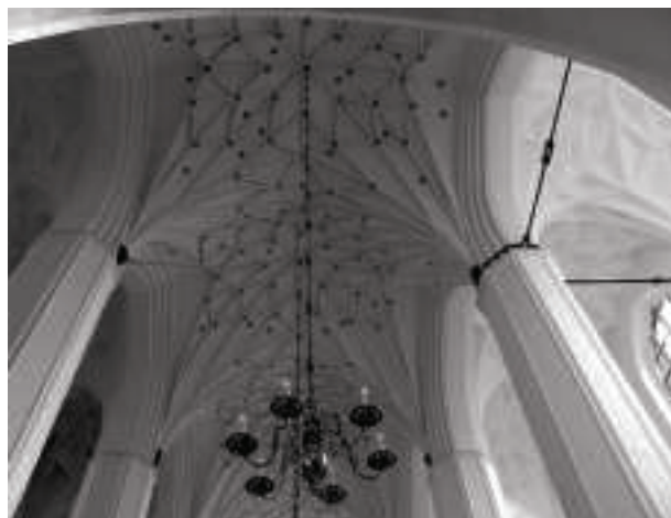
Ryc. 3. Kościół św. św. Piotra i Pawła Fig. 3. St. Peter and St. Paul's Church