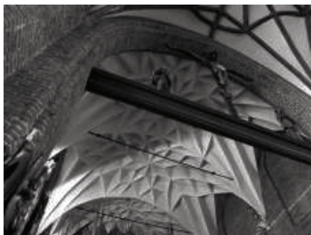
Ryc.5. Kościół św. Brygidy Fig. 5. St. Bridget's Church

Gotyckie sklepienia wznosili muratorzy, którzy umiejętność ich konstruowania doskonalili pod okiem mistrzów cechowych i zobowiązani byli do utrzymywania ścisłej tajemnicy zawodowej. Wraz z nastaniem nowych kierunków w architekturze wygasła potrzeba ich wznoszenia i zasady konstrukcji tych sklepień uległy zapomnieniu. B. Ranisch prawdopodobnie z przekazów rodzinnych