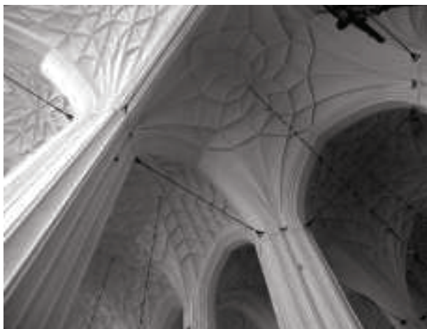
Ryc. 2. Kościół Mariacki Fig. 2. St. Mary's Church